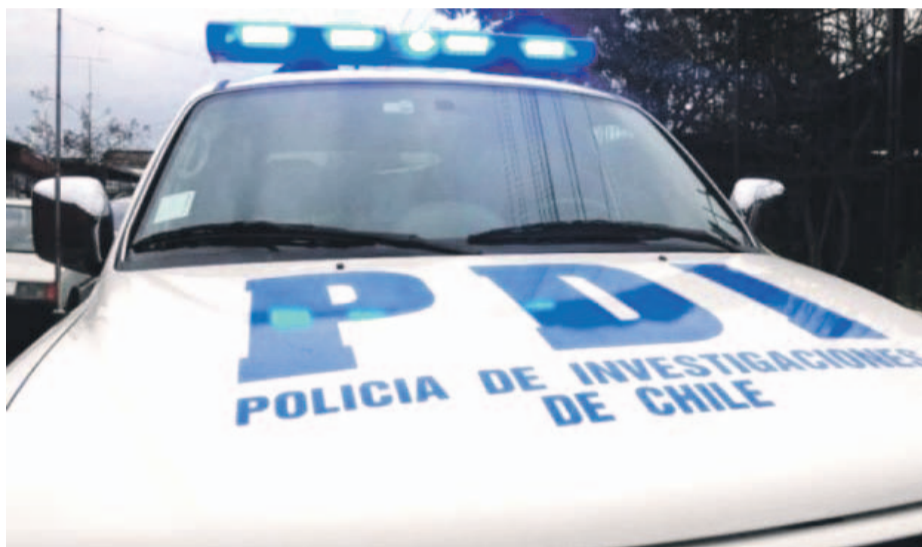
EL DÍA 6 años después de haber cometido el crimen, el presunto responsable del hecho, fue finalmente detenido por agentes de la PDI.

El imputado, de 33 años, fue detenido por la Brigada de Homicidios tras ser acusado de disparar a un hombre en esa población. El crimen tuvo como víctima a un sujeto de 31 años que falleció por una herida de bala en la cabeza.