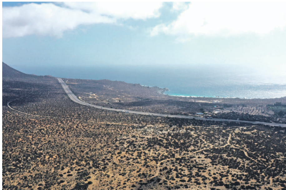
La desaladora estará ubicada al sur de la comuna de Coquimbo.

Justo antes que terminara el año, Contraloría tomó razón de las bases de licitación de dicha infraestructura, por lo que inmediatamente desde el MOP, publicaron en el Diario Oficial la oferta de carácter internacional, la que cerrará el 10 julio de 2025, para luego, conocer las propuestas que se presentaron.