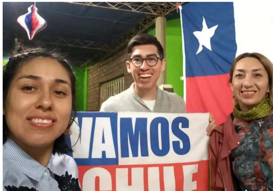
Un grupo de estudiantes universitarios chilenos de la Universidad Nacional de San Juan.