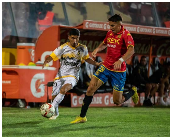
Coquimbo se quedó con las manos vacías en Santa Laura, aunque Díaz reservó a sus mejores hombres para el choque por la Sudamericana ante la U. Católica.