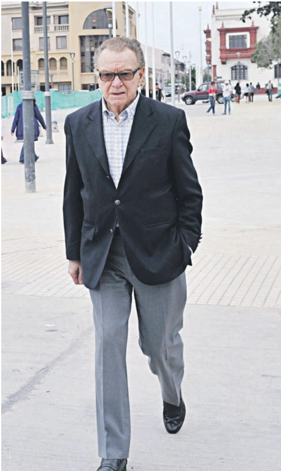
DESTACADO CIUDADANO SERENENSE