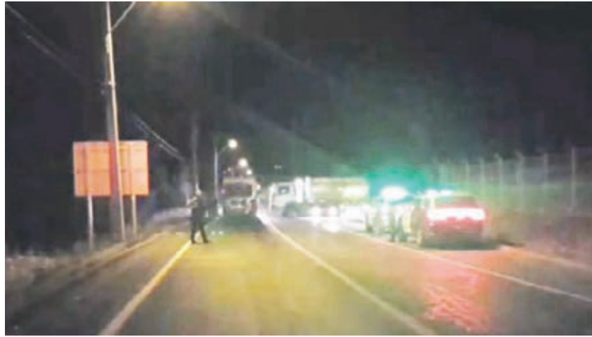
Con bloqueos cerraron el acceso a las comunas en medio de la propagación de la pandemia del Covid-19.

Los ediles son investigados por delitos contemplados en la "Ley Antibarricadas", luego de con la instalación de obstáculos impidieran la circulación de una ambulancia con pacientes adultos mayores.