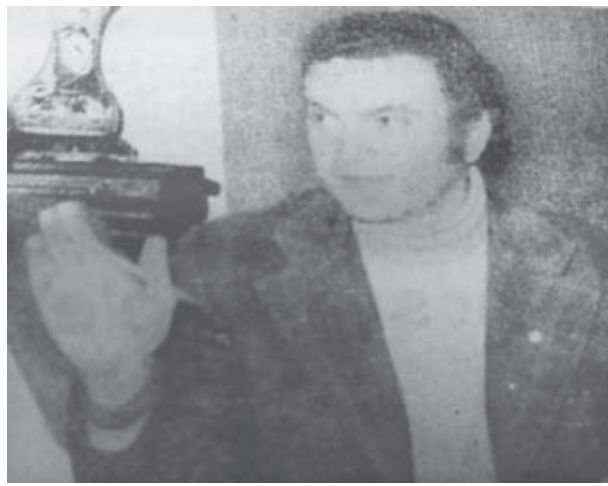
El aporte del dirigente granate fue clave en el desarrollo de Club Deportes La Serena.