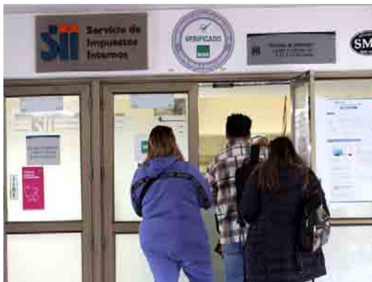
Para este año se espera que declaren el Impuesto a la Renta más de 4,7 millones de contribuyentes.

Cabe recordar que para este año se espera que declaren el Impuesto a la Renta 4.770.000 contribuyentes, de los cuales 1.900.000 son empresas y 2.870.000 personas. En este marco, el SII está ofreciendo propuestas de Declaración de Renta a 3.900.000 contribuyentes. Las y los contribuyentes tienen hasta el 8 de abril para declarar y recibir su devolución de impuestos, si corresponde, en el