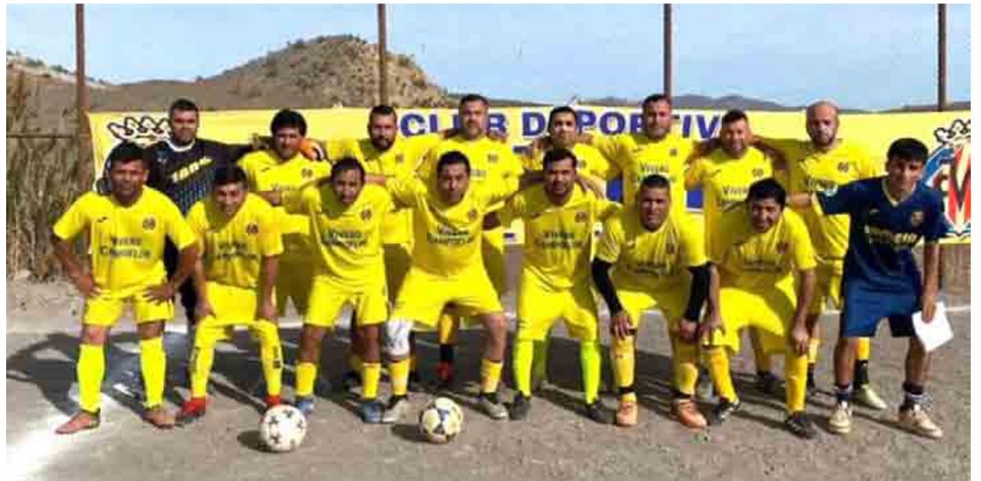
Un total de diez categorías comprende el club Villa Real de El Palqui, entre adultos y niños, con una clara tendencia a la formación y educación para entregarles posibilidades en la vida.

La prevención de nuevos episodios no se concentra solamente en parar la competencia en este periodo pues, aseguran, nada será diferente cuando se reactive la competencia, porque los incidentes que se han viralizado en los últimos días, corresponden a un problema país: el flagelo de la droga