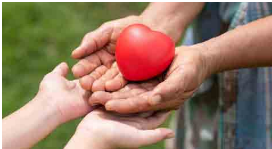
Imagen representativa de la bondad: entregar lo mejor de uno mismo al resto.

Los seres humanos aspiramos a la bondad, a hacer el bien, a dar y a darnos, pero lo olvidamos y dejamos de ejercer esa natural inclinación bienhechora, según un polifacético psicólogo, que propone diez sencillas claves para entrenar esa olvidada cualidad que “nos hace más felices a nosotros mismos y a los demás”.