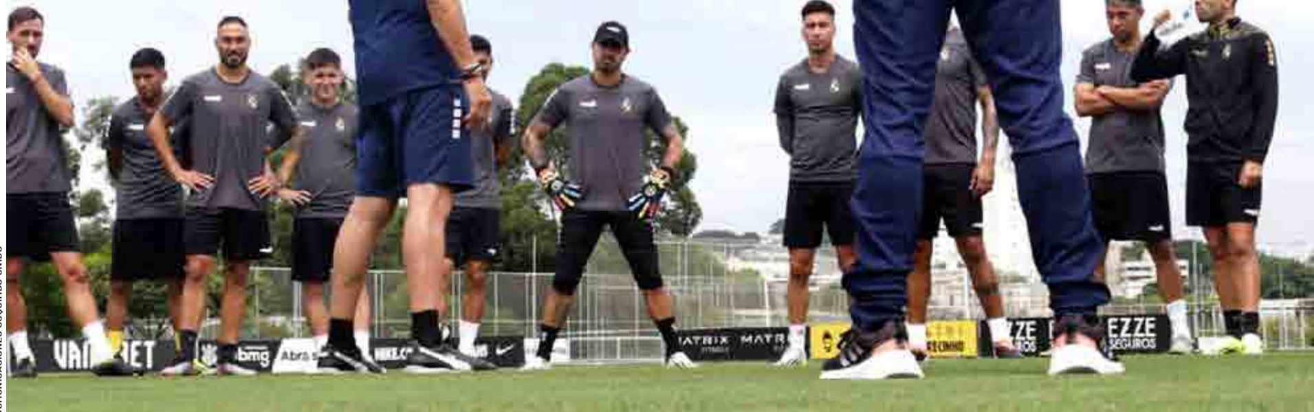
COMUNICACIONES COQUIMBO UNIDO