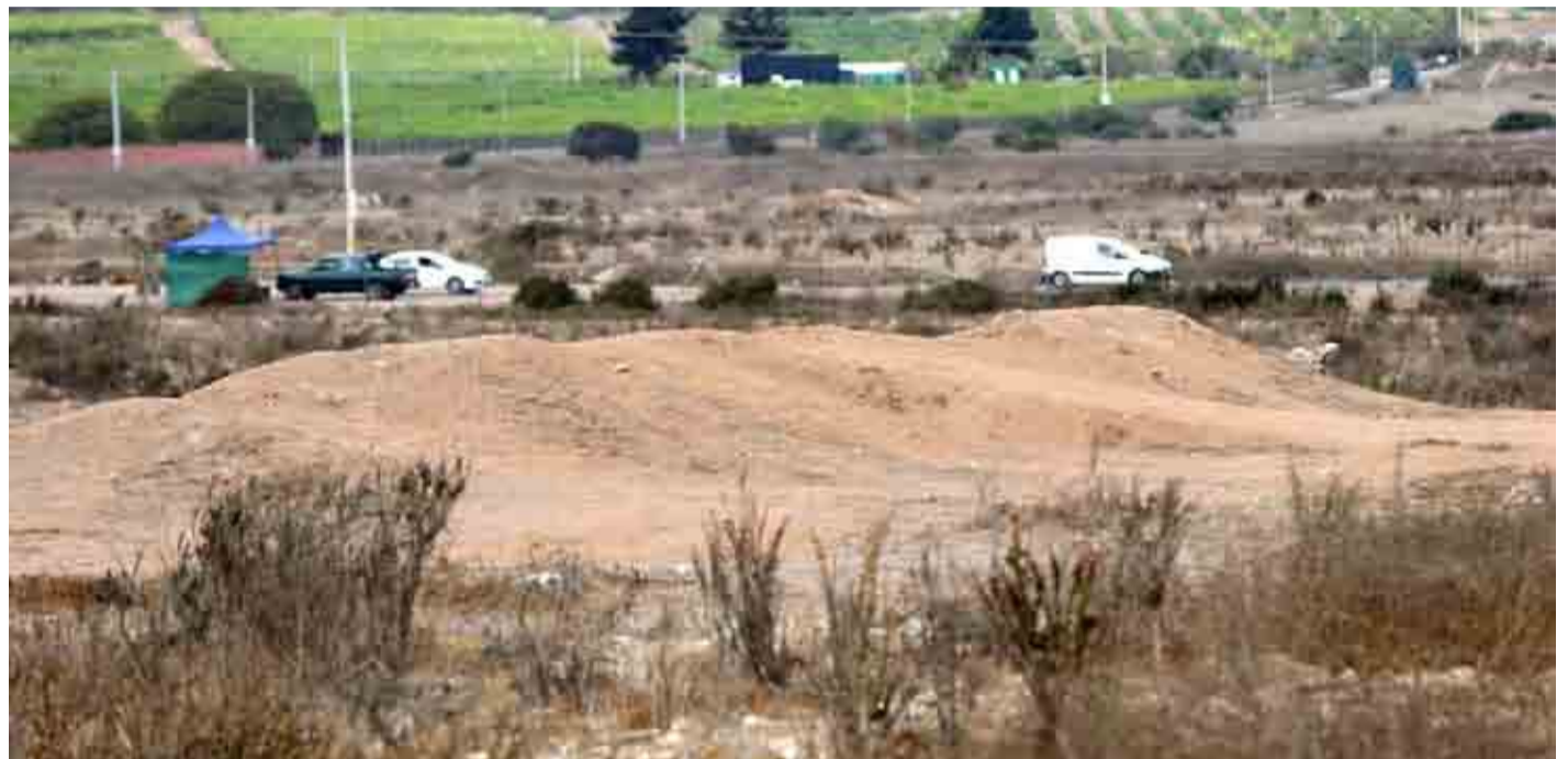
Sin formalizados a la fecha, se encuentra el denominado caso "Papaya Gate".

Desde el partido aludido en tanto, no se han referido con especial intensidad