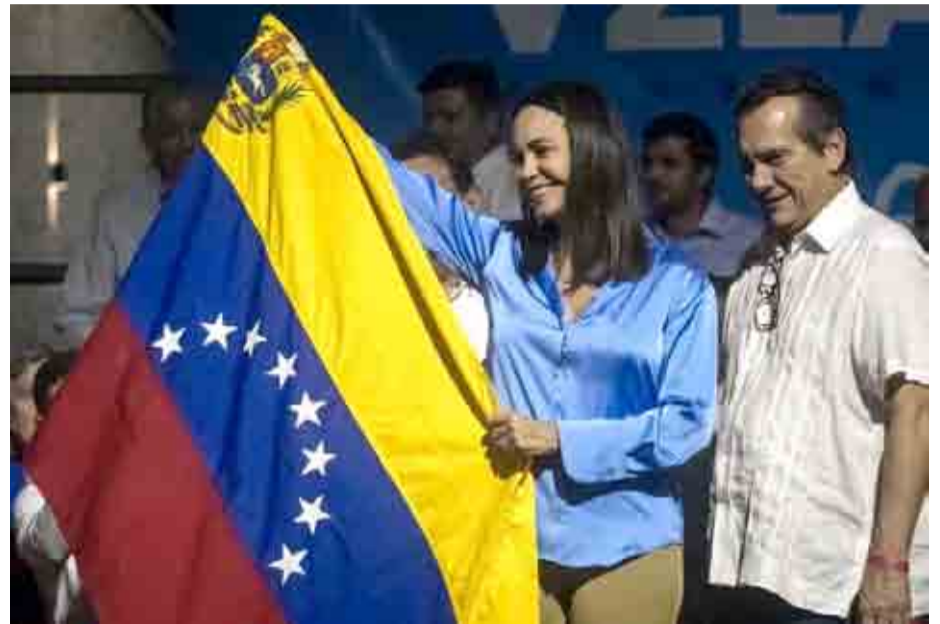
María Corina Machado sonríe mientras celebra junto a aliados y seguidores en las primeras horas de este lunes los resultados de las elecciones primarias en Venezuela.

Mientras tanto, la opositora insiste en mantener la organización para las votaciones, en esta ocasión dirigida a los venezolanos en el exterior, un grupo conformado por 7,7 millones de personas, según estimaciones de la Organización de Naciones Unidas (ONU), cifras que son rechazadas por el gobierno madurista que cifra en 2 millones el número de migrantes.