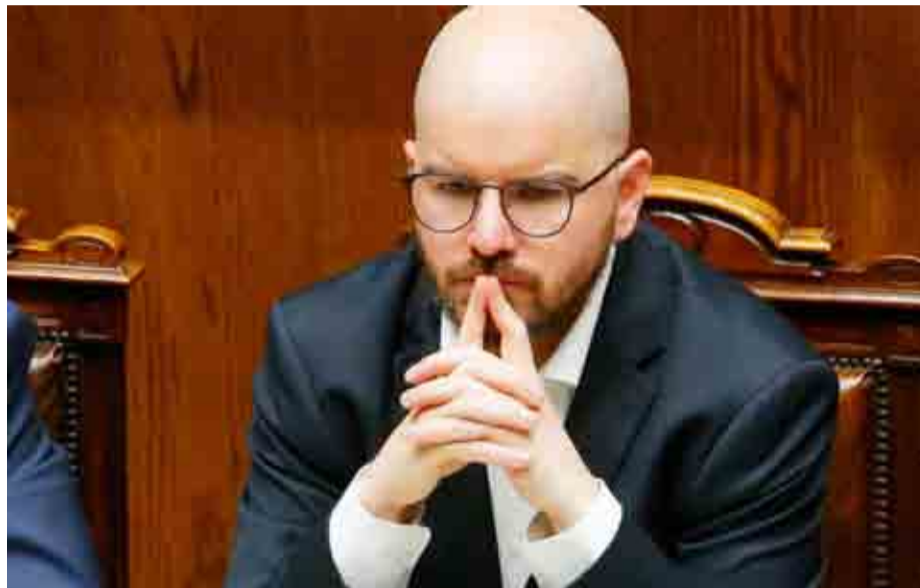
Meses después de la polémica, Giorgio Jackson, renunció al Ministerio de Desarrollo Social. Ahora, se encuentra viviendo en España.

El ex secretario de Estado acusa de que, junto a otros diputados de la UDI, lo habrían relacionado al "caso convenios" y al robo de computadores desde la cartera que dirigía. En esta línea, el ex titular del Ministerio de Desarrollo Social y Familia afirmó que, sin ningún antecedente meritorio ni comprobable, se cuestionó su honorabilidad, credibilidad y honestidad, entre otros aspectos.