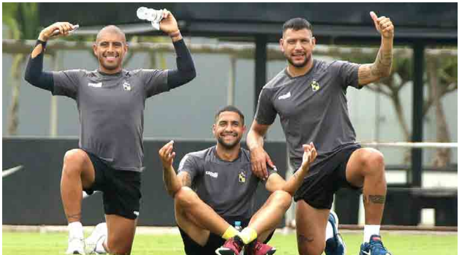
LOS PIRATAS INICIAN NUEVA TRAVESÍA EN LA SUDAMERICANA 21

IMACEC ANOTA SU MAYOR AUMENTO EN CASI 2 AÑOS 14