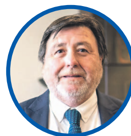
Ricardo Cifuentes DIPUTADO DC

“Este reajuste ayuda, sí, por supuesto, pero esperamos avanzar hacia un sueldo digno”