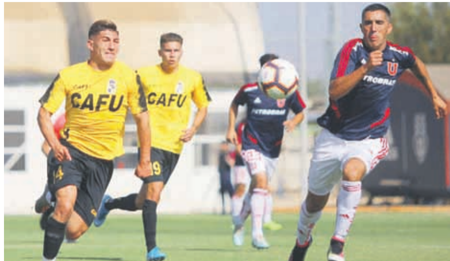
Las normas preventivas serán extremas cuando los jugadores retornen a las prácticas y luego a los partidos oficiales.