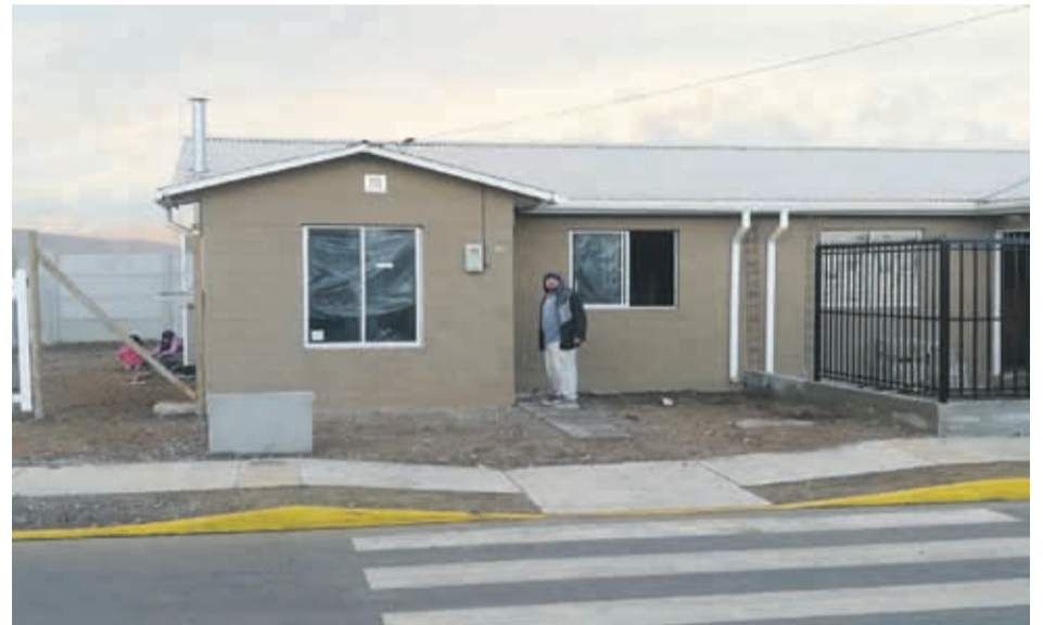
Las casas de la Villa El Mirador de Guanaqueros están siendo habitadas por sus propietarios y propietarias, quienes destacaron la calidad de la construcción.