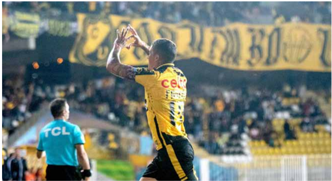
Las autoridades aceptarían solamente público de Coquimbo Unido para recibir a Colo Colo. EL DÍA

Si bien, las autoridades locales, permitirían esa cantidad de aficionados, no aceptarían seguidores del conjunto visitante. El encuentro en tanto, está programado para el próximo sábado 12 a partir de las 15:00 horas en el estadio Francisco Sánchez Rumoroso.