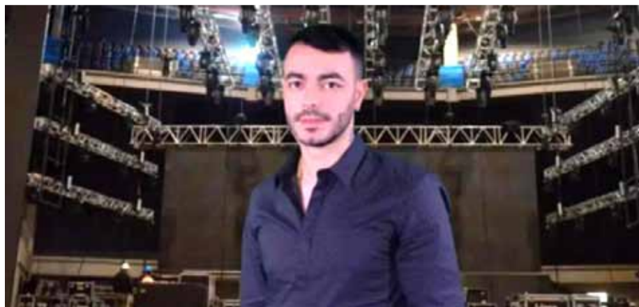
El narco uruguayo, Sebastián Maset, es intensamente buscado por la justicia de Uruguay, Brasil y Paraguay, además de la DEA de Estados Unidos, la Europol e Interpol.

"Gracias a la ayuda del director de la Felcn logré irme, porque él me avisó que el ministro ya había dado orden de aprehensión contra mí y bueno agarré una platita y me avisó que me fuera", afirmó el uruguayo sin dar nombres.