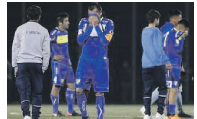
Cinco días tiene Barnechea para apelar por la decisión en busca de revertir la sanción.