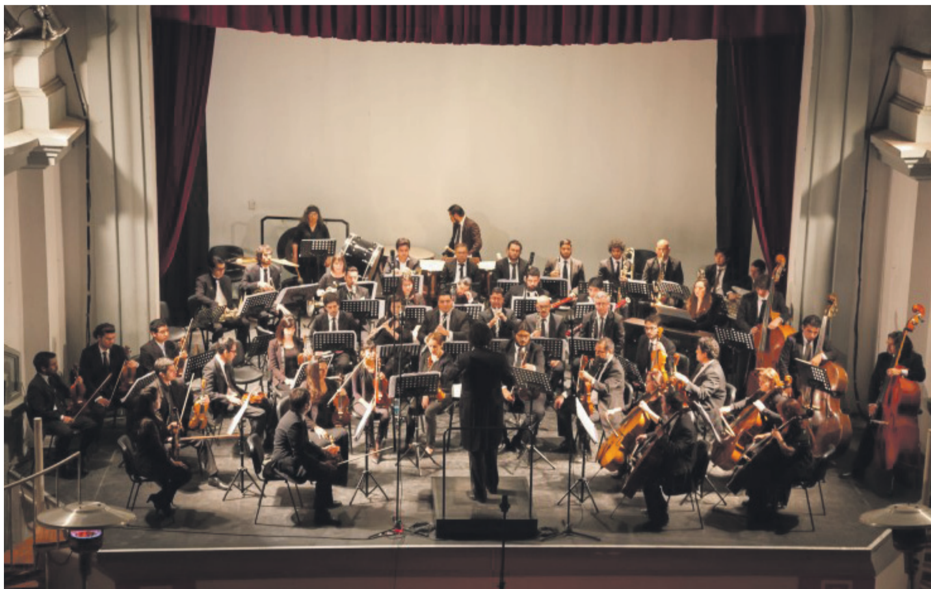
El lunes 14 es el concierto de la Orquesta Sinfónica Universidad de La Serena en el Teatro Municipal.