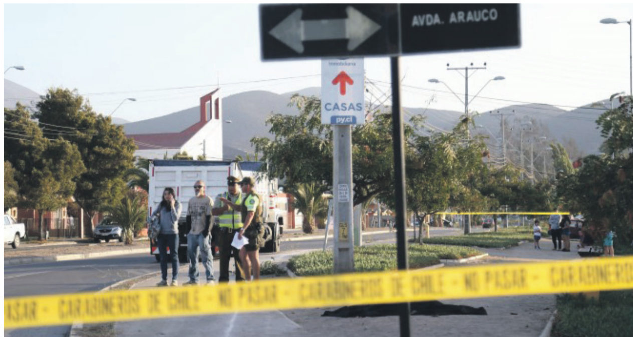
El cruce de Avenida Arauco con Avenida Las Parcelas se ha transformado en un lugar peligroso.