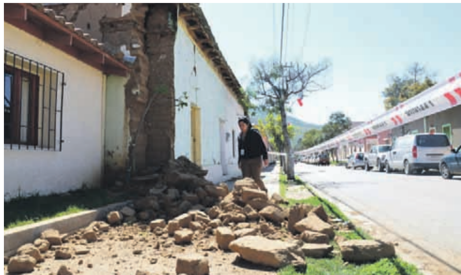
La Provincia de Choapa resultó con innumerables daños luego del terremoto que tuvo lugar el 16 de septiembre de 2015.