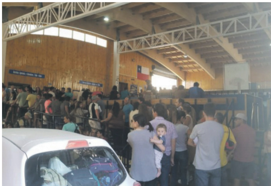
Los servicios controladores como SAG, PDI, ADUANAS, Carabineros han reforzado su personal y están a plena capacidad para agilizar las revisiones y proceso de ingreso a nuestro país.