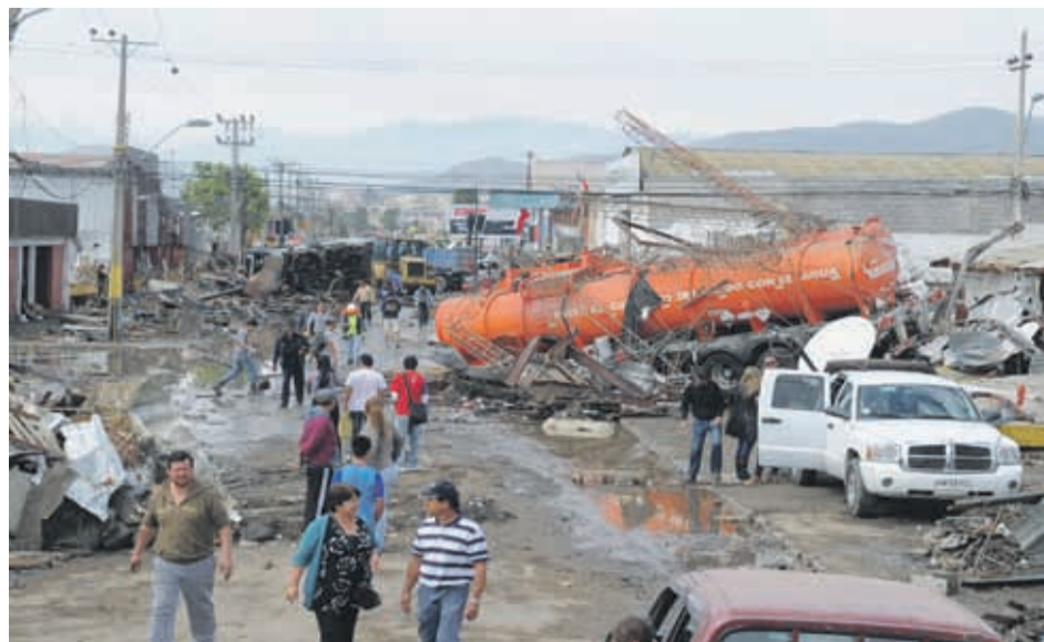
En la costa, como ocurrió en el barrio Baquedano en Coquimbo, se produjeron graves daños tras el 16-S. Por eso, la autoridad llama a actuar con rapidez en estos casos.

SIN EMBARGO, ESTOS FENÓMENOS NO SON PREDECIBLES CON EXACTITUD