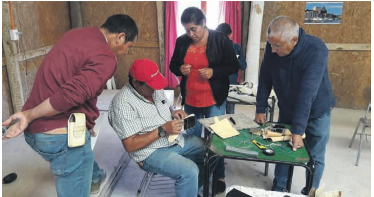
En Coquimbo se realizaron los talleres "Diseño y confección de artículos de cuero" y "Elaboración de queso de cabra y subproductos de la leche caprina".

CAPACITACIONES EN TALABARTERÍA, CRIANZA Y FERTILIZACIÓN DE ABEJAS