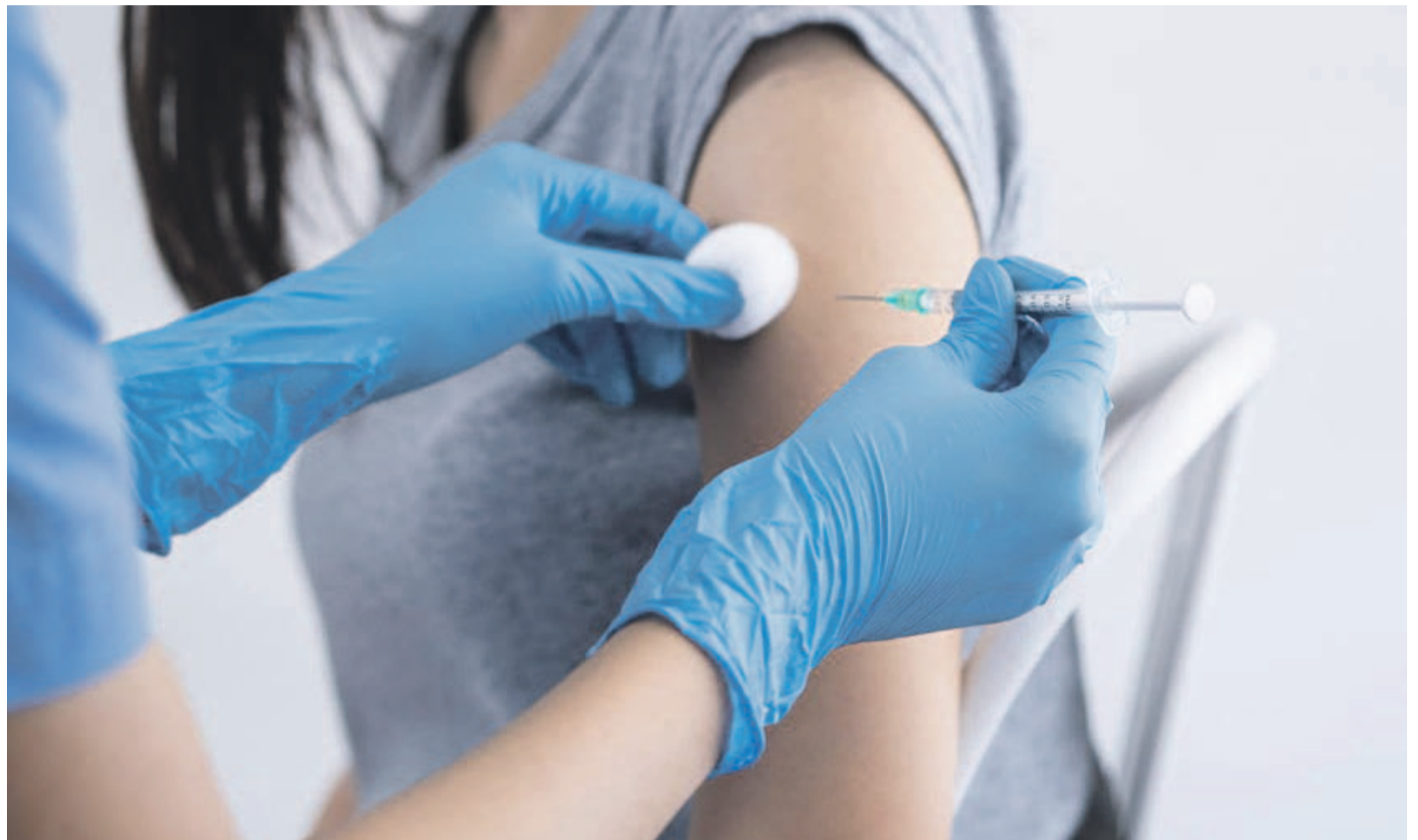
La vacunación contra el covid-19 podría integrarse como una medida permanente de salud pública en Chile durante este 2025.

Precisamente ante los buenos resultados obtenidos en los planes de vacunación, es que el Ministerio de Salud en la actualidad estudia el uso permanente de las vacunas contra el covid, algo similar a otras vacunas como la de la influenza o la del sarampión