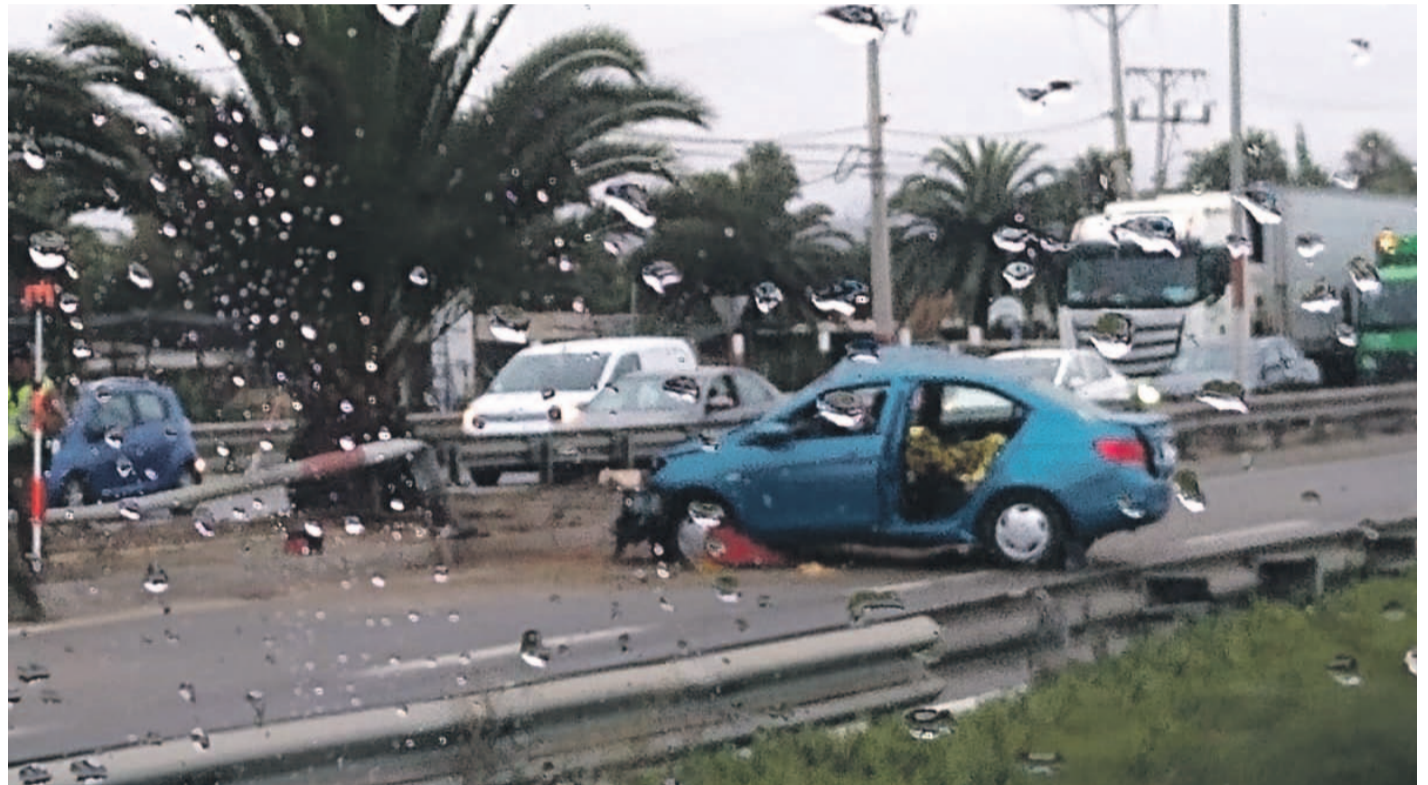
Una persona fallecida y otra herida fue el saldo que dejó el accidente ocurrido durante la mañana de este viernes en la ruta 5.