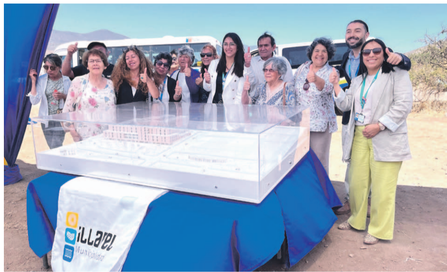
Con presencia de autoridades y vecinos, además del personal médico del recinto hospitalario, se llevó a cabo la entrega del terreno en donde se emplazará el futuro hospital de la comuna.

El nuevo recinto de salud contará con 135 camas de hospitalización, 6 pabellones de cirugía mayor, 68 box de atención y además nuevas unidades de hospitalización, salud mental, diálisis ambulatoria y medicina alternativa.