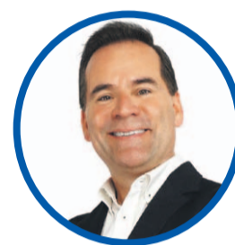
Francisco Corral CORE ELECTO

"El gobernador enfrentará desafíos importantes, entre ellos la sequía, que ya afecta severamente a la región y requiere políticas inmediatas de gestión hídrica"