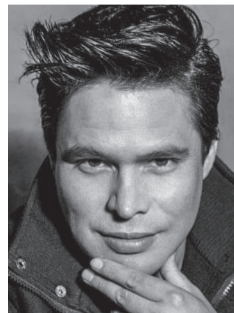
El oriundo de Andacollo ha cantado en los mejores escenarios de México y Chile.

El andacollino, cantante y compositor, tiene cuatro álbumes, donde el tema “Algún Día” es su regalón, pero “Hay otro en tu lugar”, que es un cover de Amanda Miguel y es parte del disco AM -Amor a la medida-, “es el que a la gente le encanta por mi interpretación. Nunca pensé que pegaría tan fuerte. Eso me agrada y me insta a seguir trabajando. Para eso le pido ayuda a La Chinita, que siempre me acompañe en este difícil camino”.