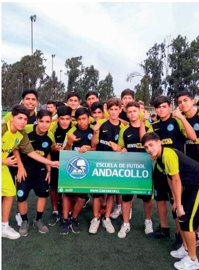
Los jugadores se sienten orgullosos de defender a la Academia Independiente.