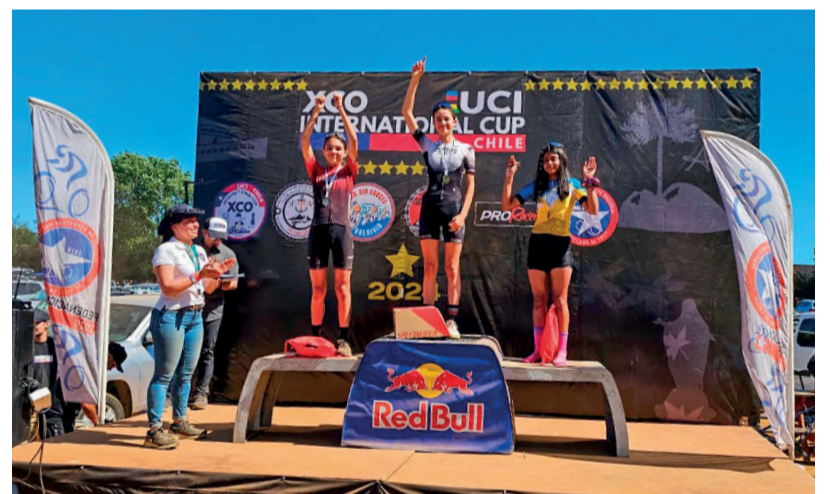
Cuatro podios obtuvieron los representantes de Andabike en el Internacional Cup de Valdivia.