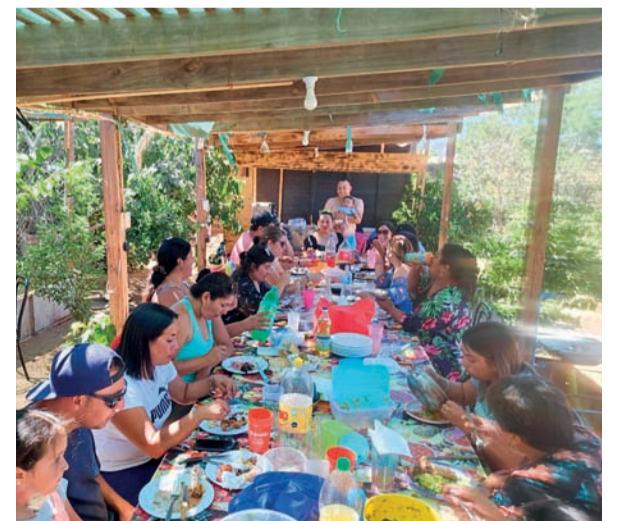
Los ciclistas celebraron su cumpleaños con una jornada recreativa.