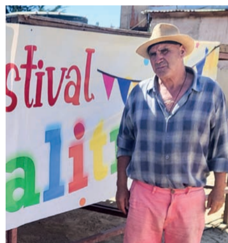
El coordinador se toma en serio su rol y participa en todas las actividades para dar vida al festival.