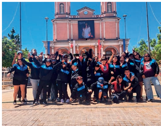
Antes de ir a competir a Valdivia, los niños pasaron por donde La Chinita para pedir que los acompañe siempre.