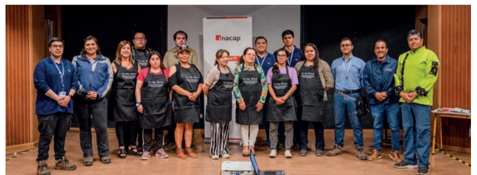
El programa contempla talleres teóricos y prácticos que le permite a los participantes ampliar sus conocimientos.

Adicionalmente y por las características de los talleres, a cada participante se le entregó elementos de protección