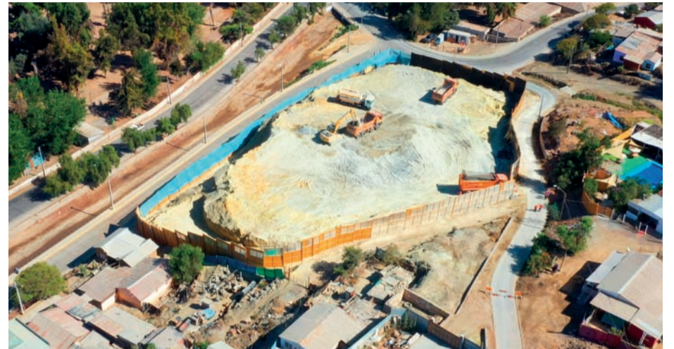
Los trabajos se realizan bajo estrictas medidas ambientales y de seguridad.

El retiro del relave urbano Whittle corresponde a un compromiso ambiental voluntario asumido por Teck Carmen de Andacollo en el marco de la aprobación de su Declaración de Impacto Ambiental (DIA) para la Continuidad Operacional del proyecto Hipógeno.