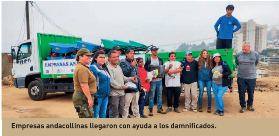
Empresas andacollinas llegaron con ayuda a los damnificados.

Voluntarios colaboraron también en la remoción de escombros y reconstrucción.