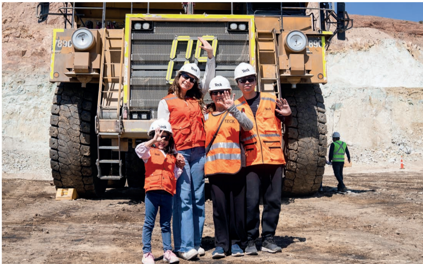
Como siempre, las fotografías junto a los camiones de extracción fueron el momento cúlmine de la jornada.