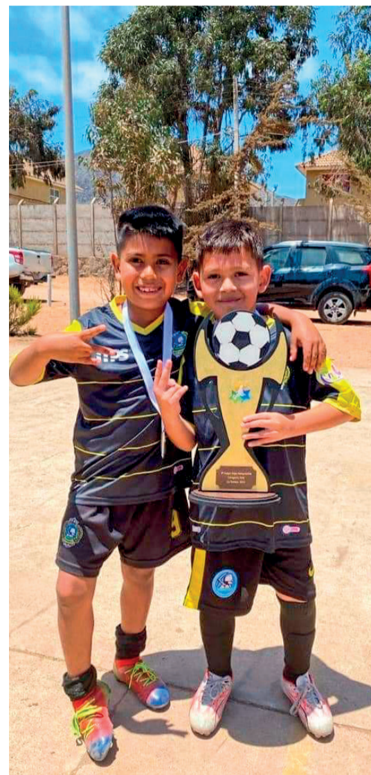
Los niños de la comuna tienen una vía de escape en el fútbol.

padres ausentes y son de escasos recursos. "Eso indica que la academia es una ruta de escape para muchos niños de la comuna".