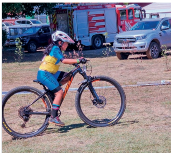
Hasta la más pequeña sabe que no deben dejar de luchar por sus objetivos.