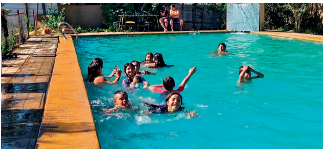
Con un día de piscina festejaron su cuarto año de existencia.