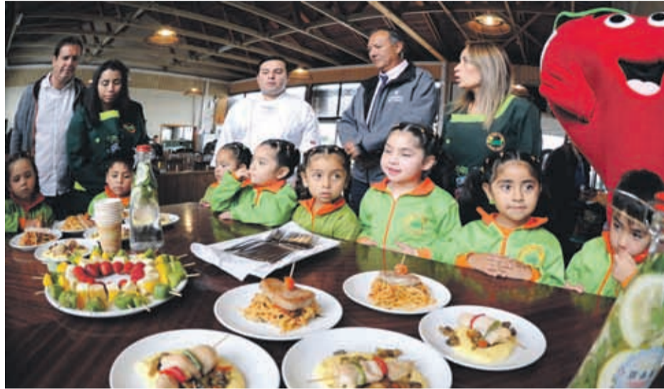
Los platos se elaboraron tras la asesoría de una nutricionista de la Seremía de Salud

Por esta razón, se abrió la convocatoria para que los restaurantes que quieran de manera voluntaria incorporar a su menú opciones más saludables, recibieran una capacitación gratuita el próximo 7 de mayo. Lo pueden hacer inscribiéndose en la página web del Ministerio de Salud, en el apartado dedicado a la nueva carta del menú infantil. “El curso va a contar con una nutricionista y chefs para demostrar cómo pueden hacer las presentaciones de los platos, qué alimentos pueden ir e incluso cuántas calorías se requieren