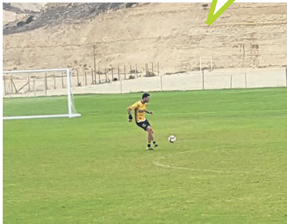
El ariete aurinegro trabajó ayer junto a sus compañeros, todo indica que estará en la citación de este sábado para medirse con Colo Colo.