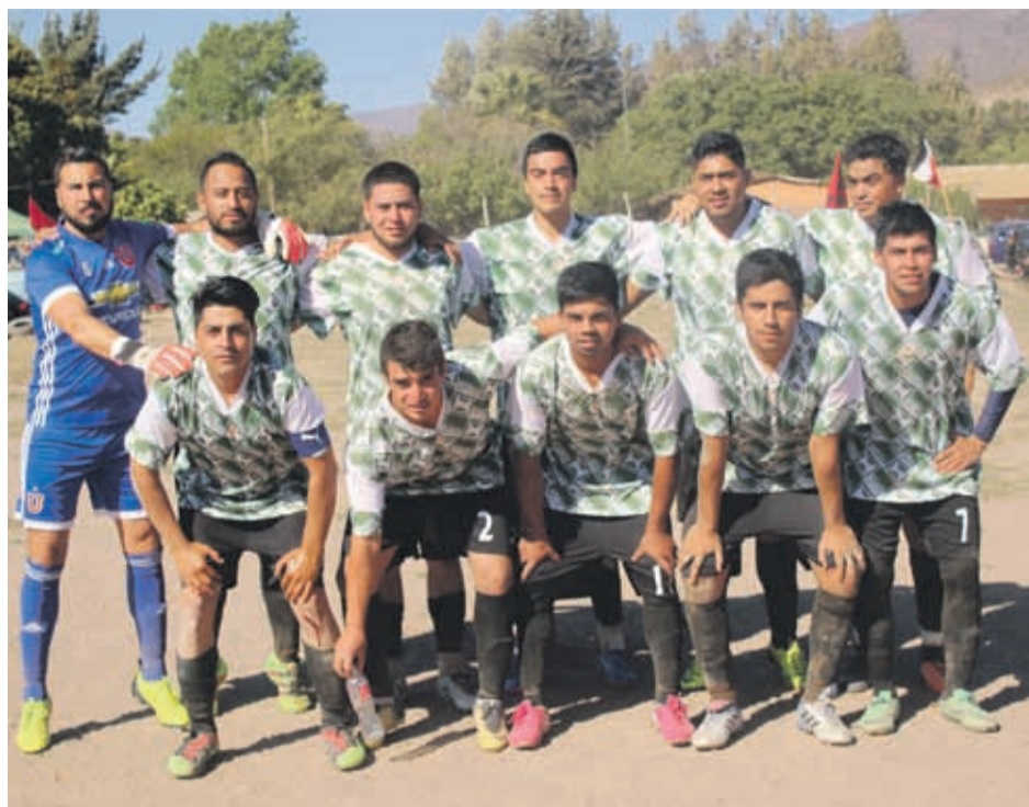
Juventud Unida buscará hacerse fuerte otra vez como local.

-Luego de ser campeones en 2018, ¿sienten la res-