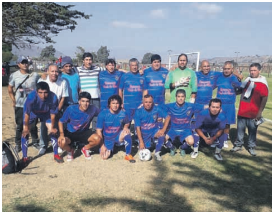
Sporting Bolívar comenzó de la mejor manera esta temporada en la Liga Santa Inés. Esperan que este pueda ser el año de levantar la copa.