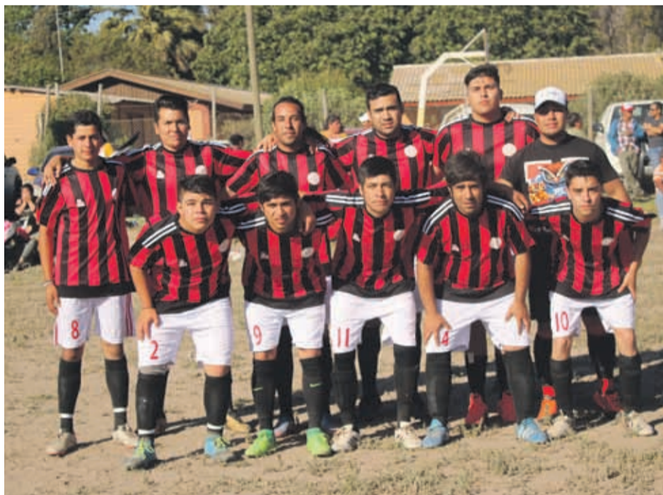
Los rojinegros aspiran a ser bicampeones de la Liga Rural.