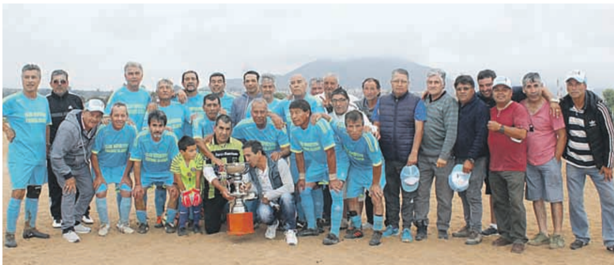
El campeón y la copa. Frenos Olguín terminó festejando la temporada 2018. Ahora, buscarán seguir con los abrazos.

Sobre la conformación del plantel para este año, Pizarro valoró la incorporación de algunas piezas que han po-