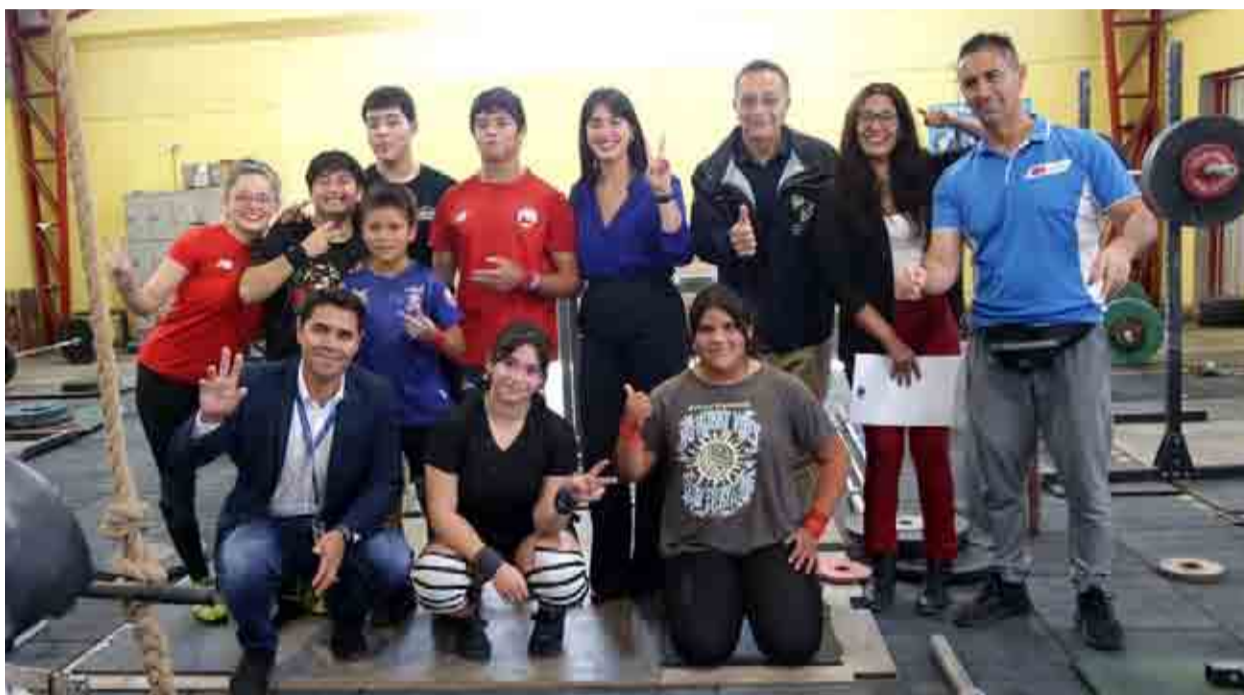
Autoridades y deportistas llamaron a todos los habitantes de la región a participar en las actividades del Día Nacional del Deporte.

Una corrida familiar, exhibición de artes marciales, partidos de básquetbol, balonmano y apertura de parques destacan en la parrilla de actividades disponibles en www.diadeldeporte.cl .