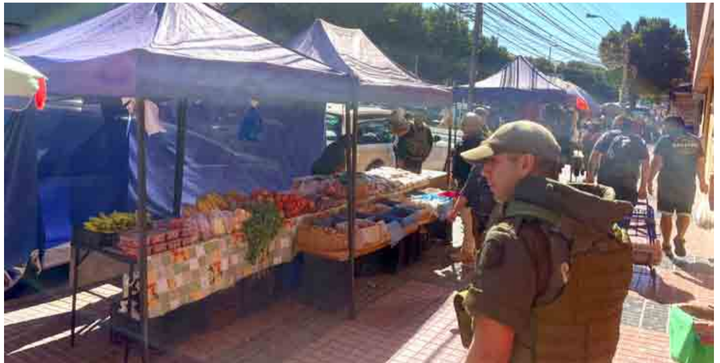
Los alimentos que son decomisados a los comerciantes ambulantes han sido destinados a hogares y centros de ayuda.

A través de fiscalizaciones en los sectores céntricos de la ciudad, personal policial, junto al apoyo de equipos municipales, ha cursado 65 multas a vendedores ambulantes. Además, los alimentos que son decomisados en las calles son destinados a centros de ayuda social de la comuna.