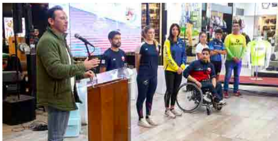
El alcalde de Coquimbo aseguró que uno de los ejes de su administración es la promoción de la actividad física.