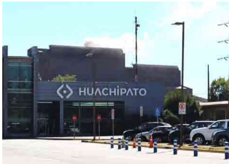
La siderúrgica solicitará mayores salvaguardas para poder mantener activa su producción de acero y así, evitar el cierre de su operación.