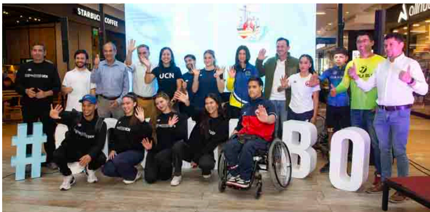
Deportistas de la comuna y simples amantes de la actividad física valoraron la iniciativa organizada por el municipio.

Pero ello no es todo, dado que se organizará una "Corrida Familiar Inclusiva", programada para el mismo 7 de abril a las 10:00 horas, siendo su partida y meta el Edificio Consistorial, ubicado en