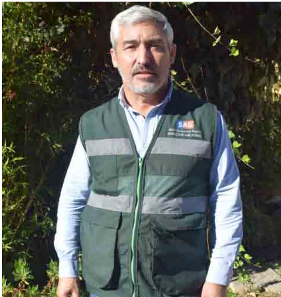
LUCIANO ALDAY VILLALOBOS

La autoridad del Servicio Agrícola Ganadero visitó Ovalle y se refirió a diversas problemáticas de la provincia, como la sequía y la aparición de la mosca de la fruta. Por otro lado, hizo un llamado a proteger las abejas y la fauna nativa, pues cada especie cumple un rol fundamental en el ecosistema.