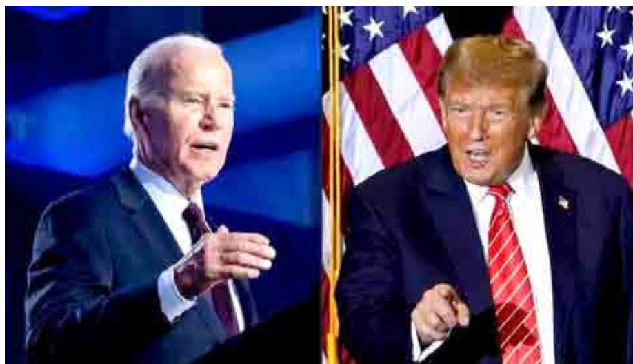
Nunca antes - al menos desde que se mide en encuestas - ambos candidatos a la presidencia de los Estados Unidos, habían generado tanto rechazo entre el electorado.

Según una encuesta publicada este miércoles por el diario The Wall Street Journal, una mayoría de electores considera que ni Joe Biden ni Donald Trump tienen la capacidad mental y de forma para ser presidente.