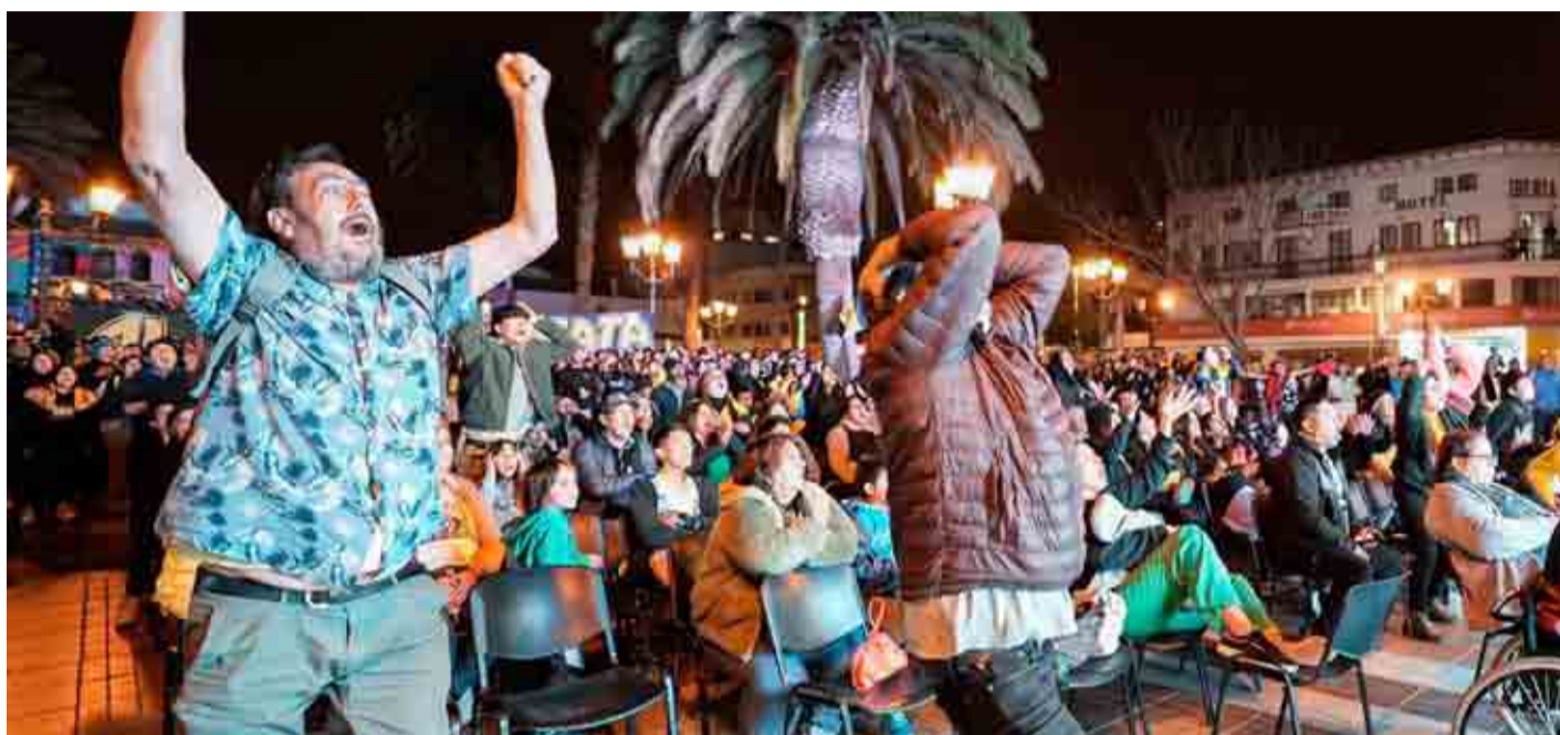
Pese a la caída de Coquimbo en Brasil, los hinchas del aurinegro nunca dejaron de apoyar al equipo.

Con pantalla gigante, los fanáticos del barbón que no pudieron viajar a Brasil, llegaron en masa al centro de la ciudad que se remeció con el latido del bombo y los cánticos de grandes y chicos. La actividad fue organizada por la municipalidad local para alentar a Coquimbo Unido en su participación en copas internacionales.