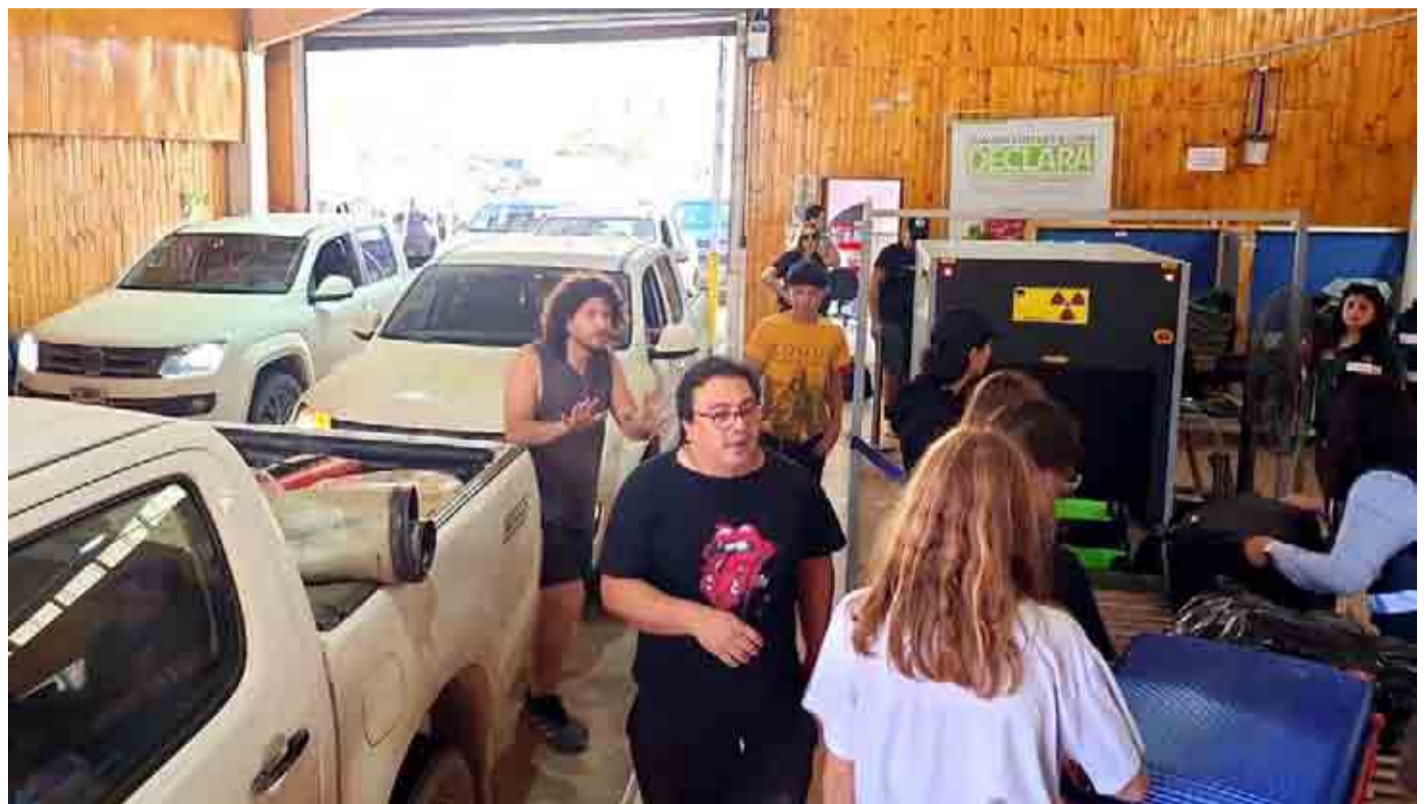
Durante este fin de semana largo, el paso de Agua Negra registró números históricos en cuanto a flujo vehicular.

Es así como durante el mismo domingo, lunes e incluso martes - ya que ese día es feriado en el país trasandino- cientos de vehículos salieron por la carretera internacional, tránsito que obligó a las autoridades a implementar diferentes medidas para hacer más expedita y ordenada la situación.