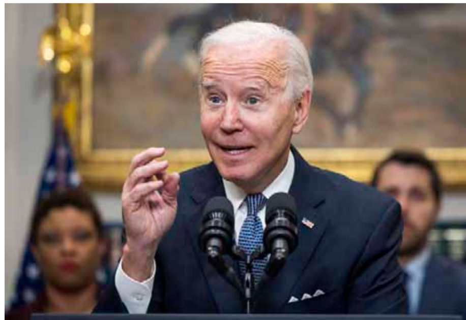
El presidente de Estados Unidos, Joe Biden, aseguró que, de no haber alcanzado acuerdo, el país podría haber entrado a una crisis económica.

Con la ratificación de Biden, el país evitará la suspensión de pagos que se hubiera producido tan pronto como el lunes de no haber alcanzado el Congreso un acuerdo