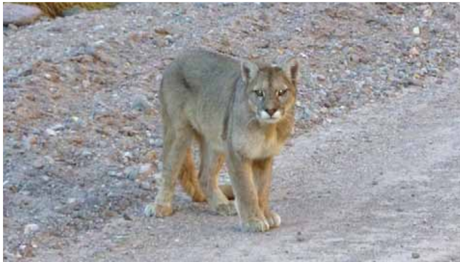
Los pumas se encuentran presentes a lo largo de todo el territorio nacional.

Después de que en los últimos días, se denunciara la presencia y hasta presuntos ataques del felino, desconocidos le dieron muerte, situación que derivó en una denuncia ante Fiscalía por parte del SAG, además del repudio de varias personas.