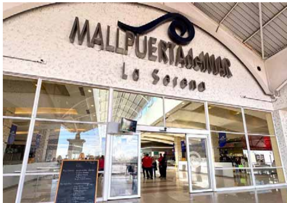
La agresión al vendedor ocurrió cerca de las 20 horas de este viernes.

“No sé si es que quisieron asaltarlo en el baño o fue una especie de riña, pero ahí empezó el problema con estos niños que, a pesar de que tenían entre 12 y 14 años, andaban con un arma blanca”, señaló otro dependiente, quien explicó que su compañero herido debió ser atendido por lo propios vendedores