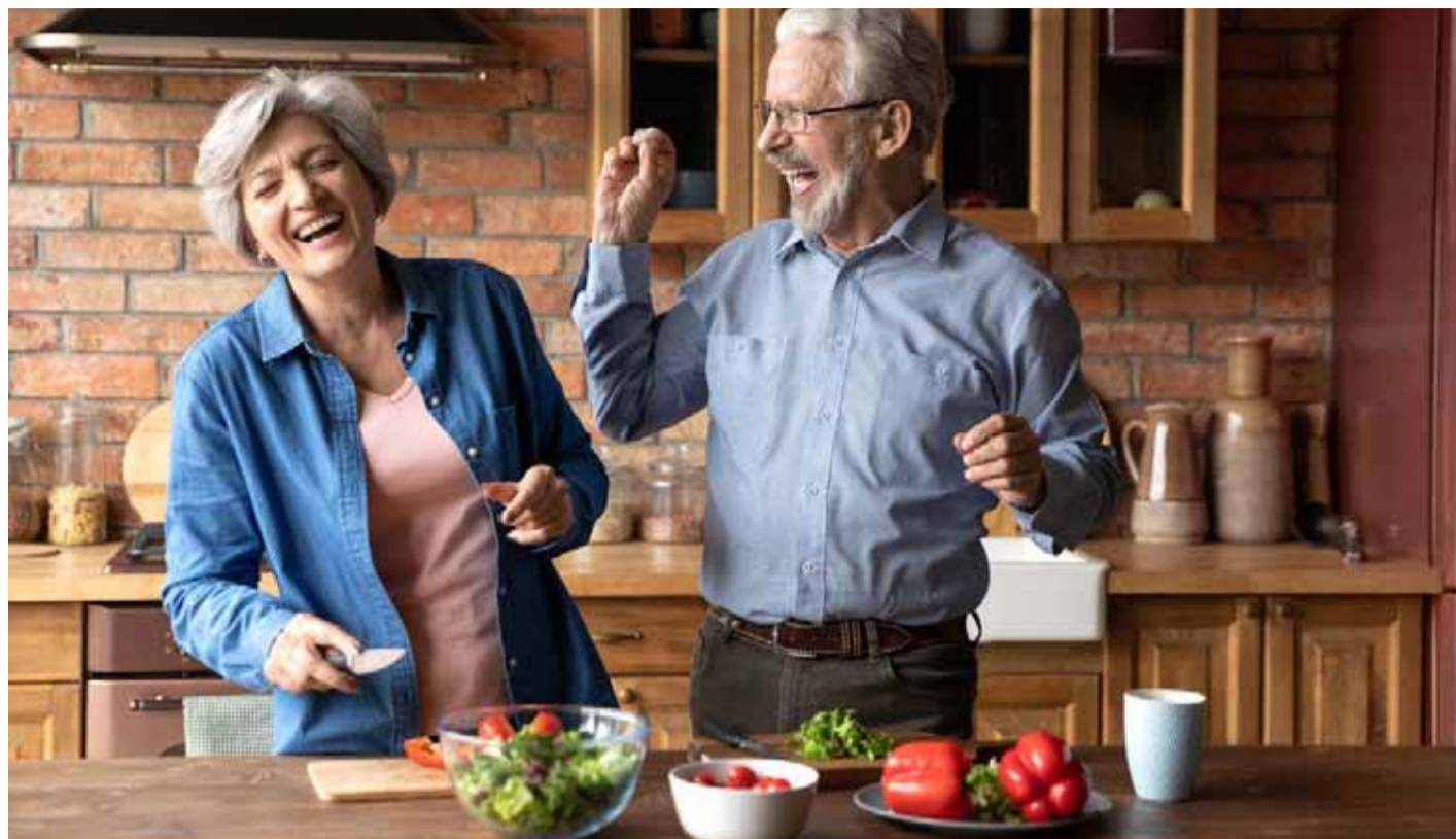
Comer de forma saludable y compartir los momentos de alegría, son otras de las prácticas que recomiendan los expertos.