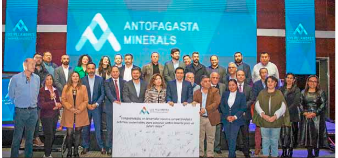
Gremios de la región, los proveedores y la Universidad Católica del Norte junto ejecutivos de Antofagasta Minerals y Minera Los Pelambres trabajarán conjuntamente para mejorar sus competencias.