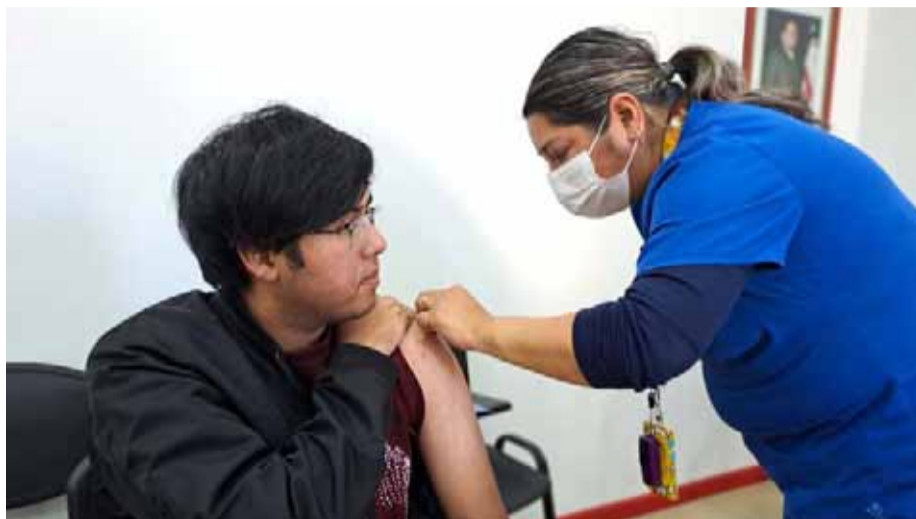
Positiva fue la respuesta de los vecinos del sector para ir a vacunarse.

En ese contexto, que más de 170 personas, entre voluntarios y la comunidad, llegaron hasta la Sexta Compañía de Bomberos de Coquimbo, ubicada en el sector de La Cantera,