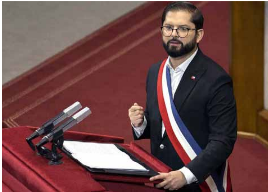
Los futuros centros anunciados por el Presidente Gabriel Boric, se financiarán con fondos del Ministerio de la Mujer y se implementarán en infraestructura ya existente.