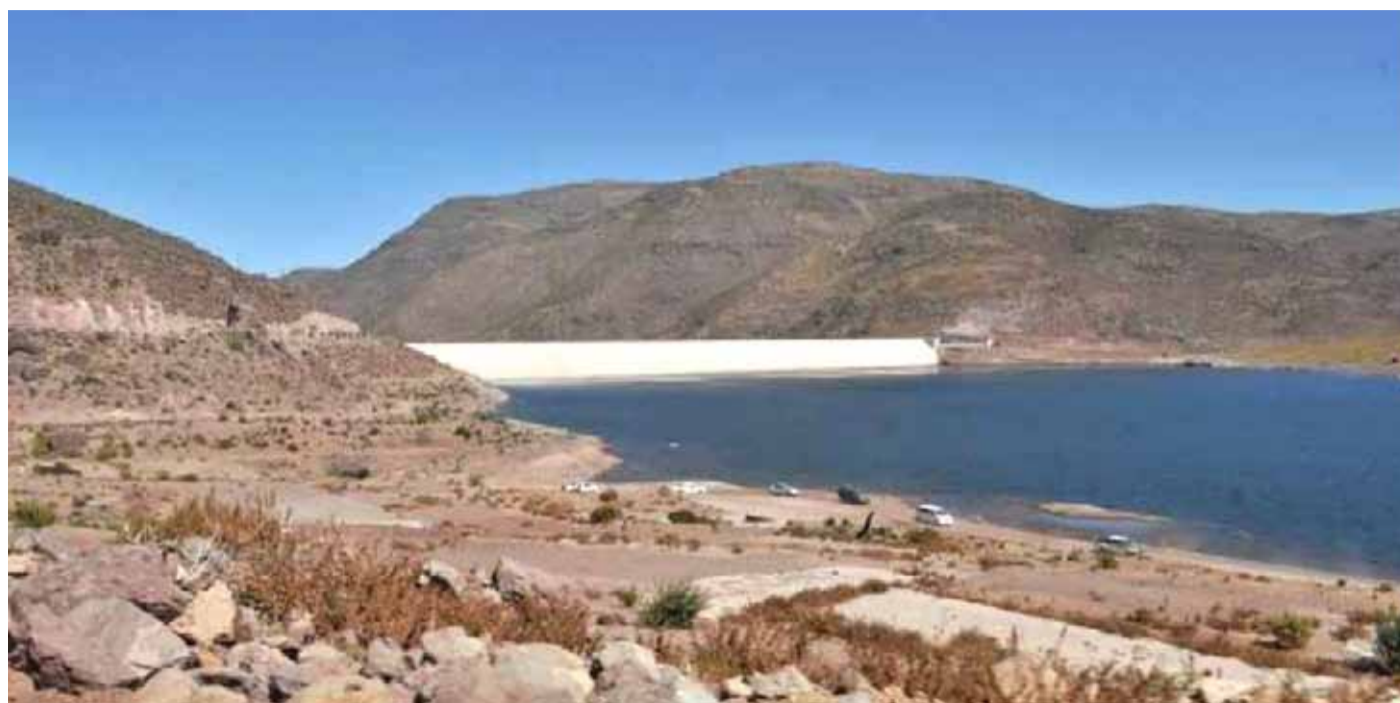
A menos de la mitad de su capacidad, se encuentra por estos días, el embalse El Bato.