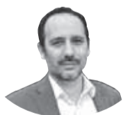
DANIEL NÚÑEZ SENADOR

En la Región de Coquimbo hay 12.563 personas que se encuentran en lista de espera para una intervención quirúrgica, un número que se incrementó con la gran cantidad de reprogramaciones que se debieron realizar durante la pandemia.