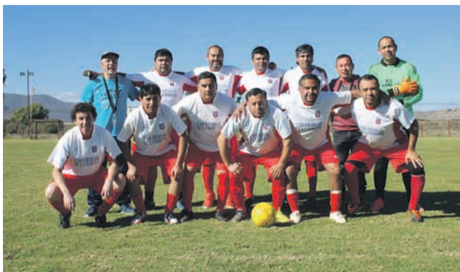
ULS ES LÍDER EN SUB 35 y uno de los animadores de la Liga Santa Inés.