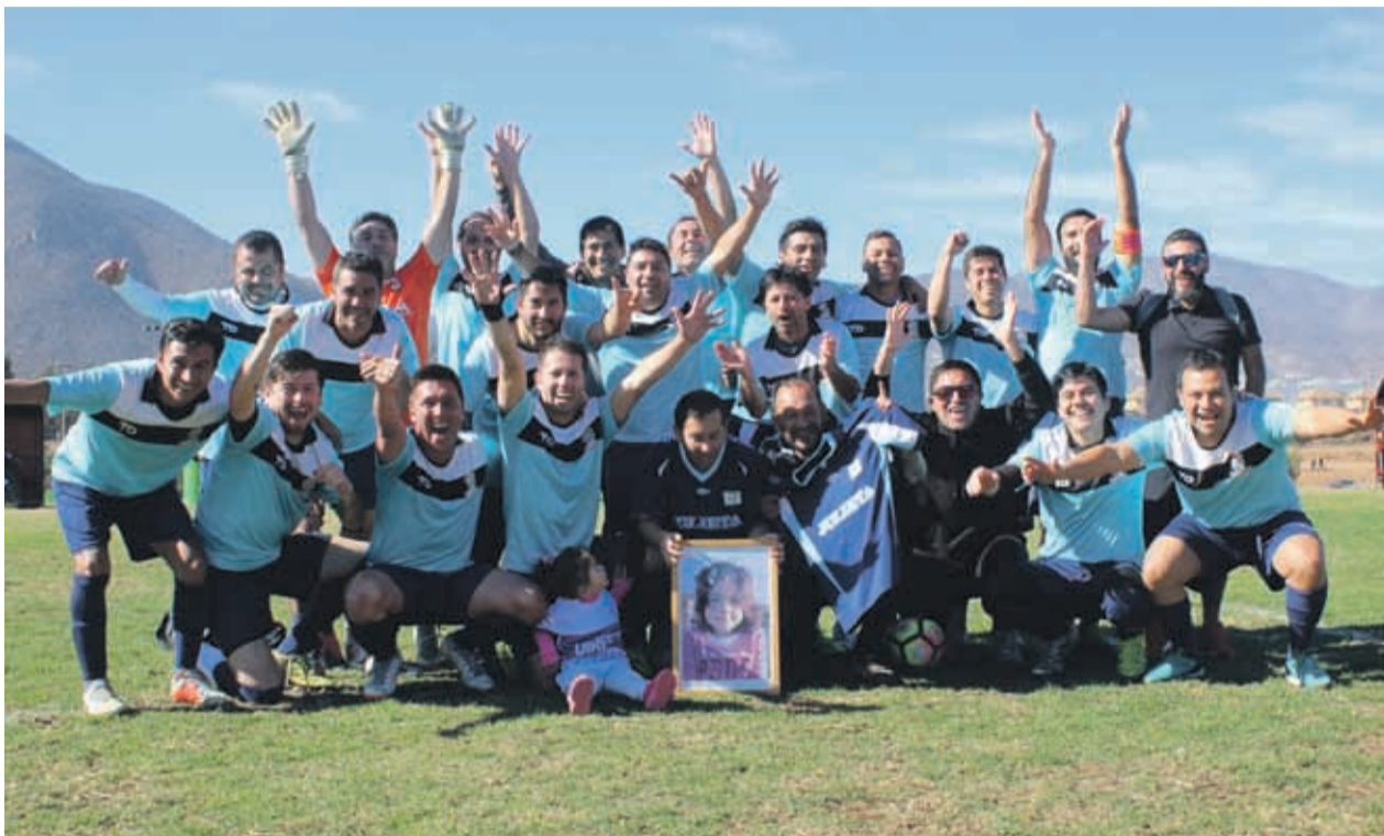
FESTEJAN LOS CAMPEONES. Julieta FC se coronó campeón en categoría Sénior de la Liga Cordep.