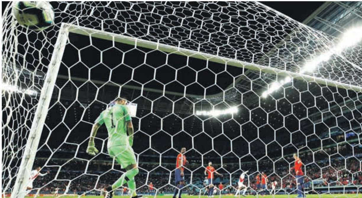
YOTÚN YA CONSUMÓ SU GOL tras el grueso error de Arias, que se lamenta. Fue el golpe de nocaut que recibió la Roja al caer la primera fracción.