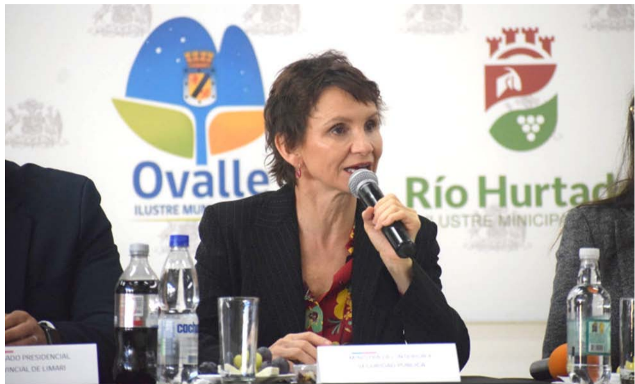
La ministra Carolina Tohá visitará la nueva sección del OS7 de Carabineros en la Prefectura Limarí-Choapa.

Es en ese sentido que la ministra del Interior y Seguridad Pública, Carolina