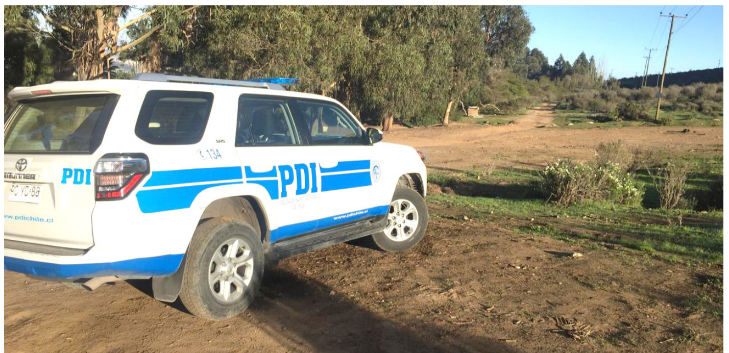
La PDI realiza intensas diligencias para aclarar dos asesinatos ocurridos la madrugada de ayer en La Serena. Hay dos detenidos de los cuales uno estaría confeso.