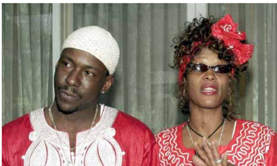
Whitney Houston mantuvo un matrimonio con Bobby Brown muy complicado.