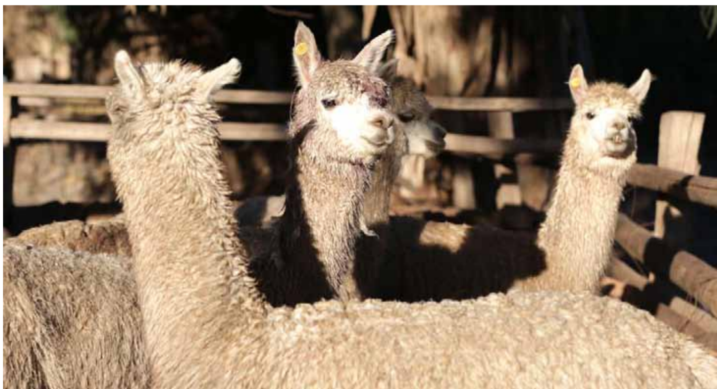
La jauría dio muerte a casi 40 animales propiedad del Fundo Criadero Diez Ríos de Altovalsol.

Empero, pasaron los 10 días que establece la ley al respecto, y, como ninguna persona llegó para acogerlos, debieron ser devueltos a su lugar de origen.