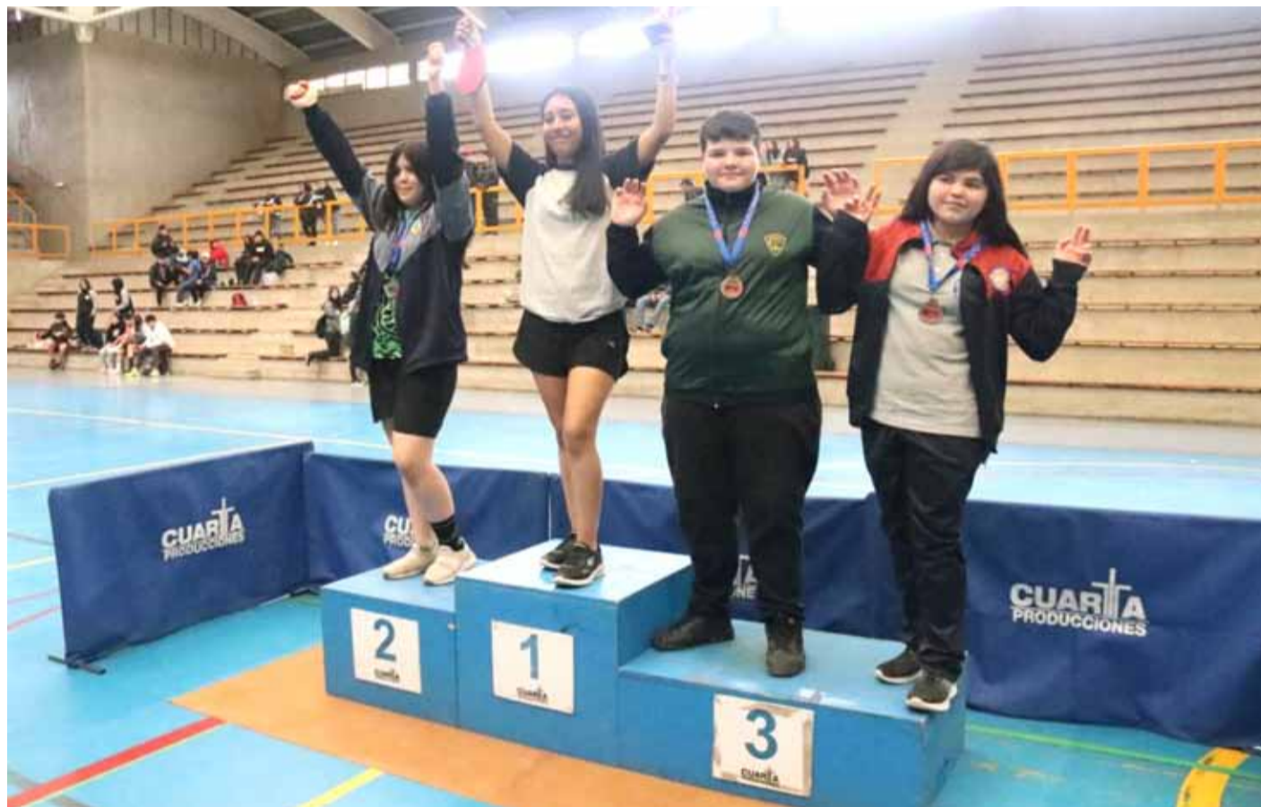
La provincia del Limarí se llevó todos los galardones en la final regional del tenis de mesa.

Desde el punto de vista técnico, el torneo llenó las expectativas de los organizadores, tanto por el número de