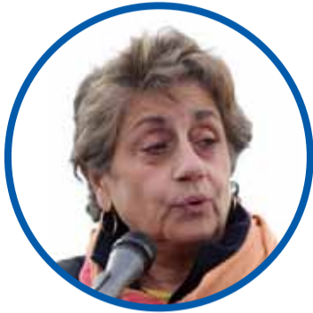
Jessica López MINISTRA DEL MOP

“Tenemos una historia donde la empresa sanitaria había contraído la obligación de construir una planta desaladora, pero eso no ha avanzado de la manera que nosotros hubiéramos querido”