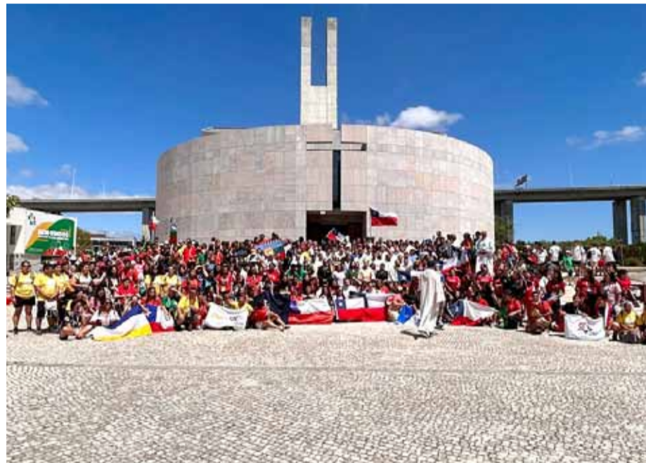
Más de 900 jóvenes católicos chilenos se encuentran en Lisboa, para participar en la Jornada Mundial de la Juventud 2023.

En el marco de una misa realizada por los peregrinos chilenos que acudieron a la Jornada Mundial de la Juventud 2023, celebrada en Lisboa, y que fue presidida por el obispo presidente del Área Agentes Evangelizadores de la CECh, Galo Fernández, se anunció que la capital regional acogerá, en dos años más, la Primera Jornada Nacional de Pastoral Juvenil en Chile.