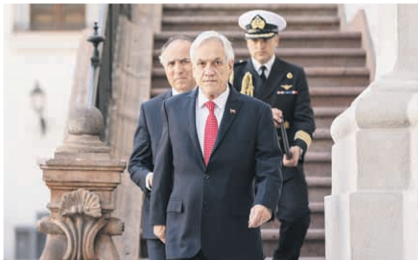
Sebastián Piñera emitió una breve declaración durante la tarde de ayer miércoles en La Moneda.

El documento será ingresado oficialmente este jueves al Congreso y podría, eventualmente, traducirse en que Cubillos deje de ser la ministra de Educación.