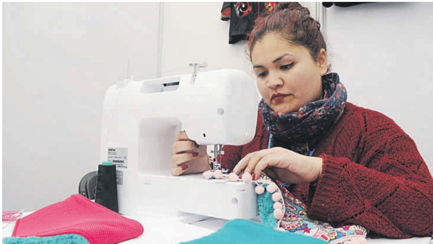
Diversas variantes surgen a raíz del proyecto de ley que busca reducir de 45 a 40 horas semanales.

horas de trabajo, mejor rendimiento se puede llegar a lograr. “Se puede trabajar menos y rendir mejor incluso, no igual. Ya que según estudios, está comprobado que a menores horas de trabajo, mayor es la producción de las