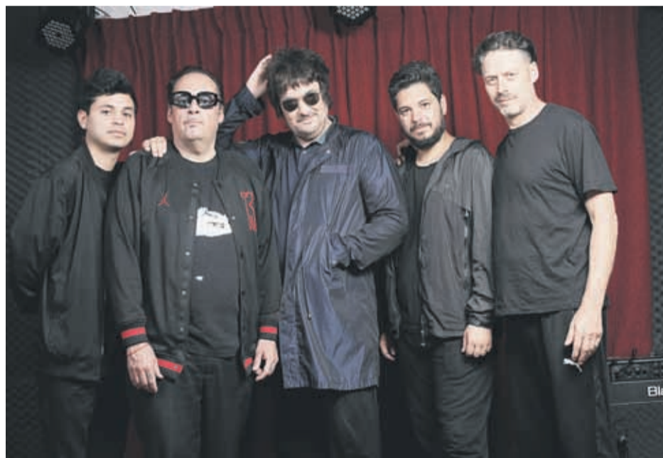
En un show de una hora y media, los músicos tocarán la totalidad del álbum que fue catalogado por la revista Rolling Stone como uno de los mejores discos chilenos de todos los tiempos.

En el marco del tour en homenaje al disco "Fome", la legendaria banda chilena se presentará el viernes en la comuna puerto. En conversación con El Día, el músico adelantó detalles del show y se refirió al momento actual del grupo, a más de un año de la operación del vocalista Álvaro Henríquez.