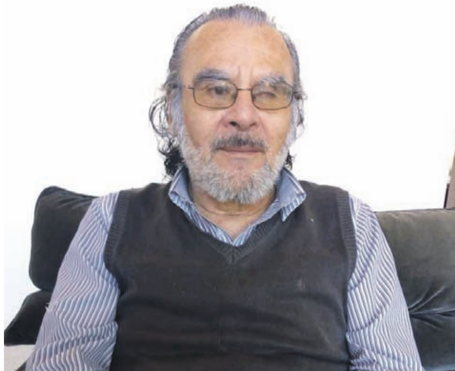
El hombre plantea que alrededor de 17 personas se encuentran en la misma situación que él.

“Recibí la información que la ayuda técnica que yo había solicitado había sido aceptada y tenía que esperar porque estaba en una etapa de iniciación y compra de lo que yo pedía, que era un notebook más un programa especial