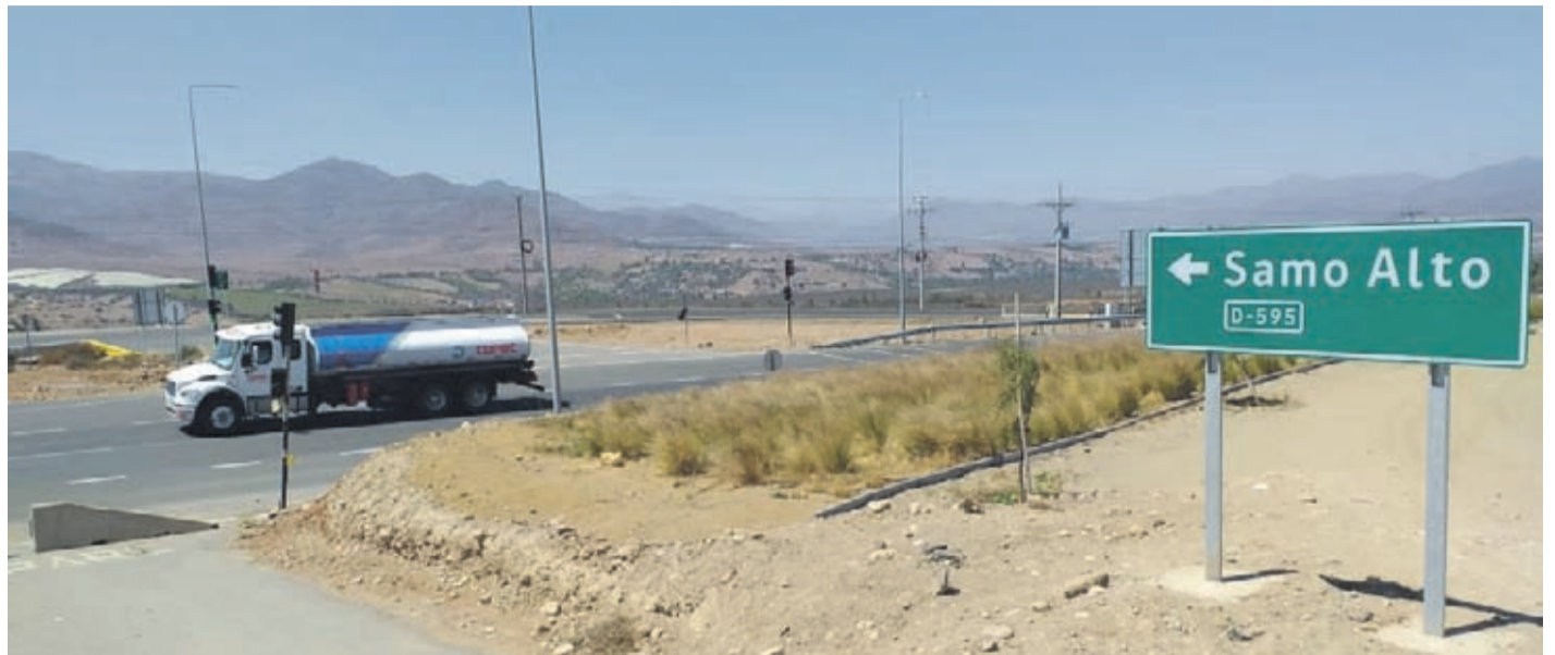
Un proyecto a largo plazo, que incluiría un paso sobre nivel en el cruce ingreso a la comuna de Río Hurtado, tendría un valor actual cercano a los $3 mil millones.