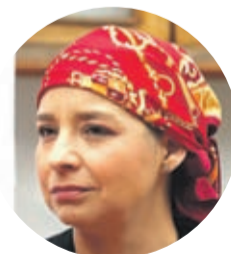
LUCÍA PINTO INTENDENTA REGIONAL

“Es una medida que no podemos descartar. Desde el punto de vista epidemiológico podría hacerse si están dadas las condiciones. Pero hay que analizar y planificar como se concretaría”.