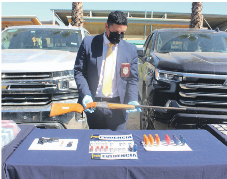
Este lunes, las autoridades dieron a conocer detalles de la operación "Diamante Verde", con la cual, se detuvo a 23 personas por delitos vinculados al tráfico de drogas.

La Corte de Apelaciones de La Serena acogió este martes 3 de septiembre, la solicitud formulada por el Ministerio Público, en cuanto a la orden de no innovar, e instruyó al Juzgado de Garantía de Ovalle despachar las órdenes de detención en contra de los 23 sujetos imputados como autores de los delitos de asociación ilícita para el tráfico de drogas, tráfico ilícito de drogas y lavado de activos.