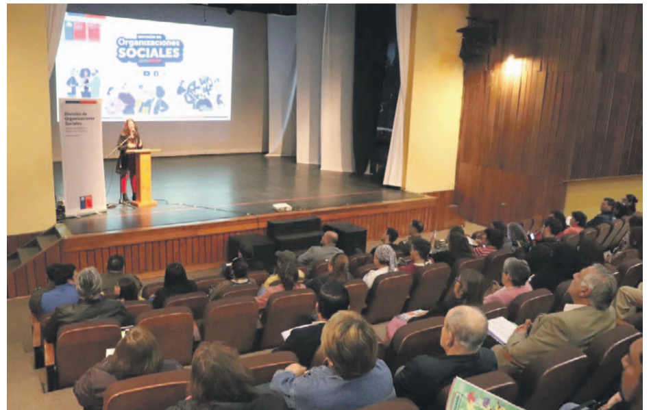
150 dirigentes de toda la comuna de Coquimbo participaron en la actividad.

“Tenemos que recuperar las comunidades y para eso el factor de las dirigencias sociales y comunitarias es fundamental. Por eso, estamos impulsando una serie de escuelas de formación social orientadas, precisamente, a poder entregar herramientas para poder abordar de manera preventiva las materias de seguridad”, afirmó Paulina Mora, seremi de Gobierno.