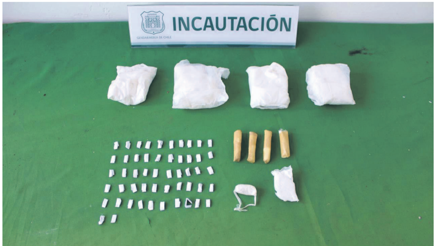
Drogas, aparatos celulares, chip y armas hechas fueron algunas de las especies incautadas durante los allanamientos.

Dicha medida se suma a los allanamientos simultáneos realizados por la institución durante la semana pasada en distintas unidades penales a nivel nacional. En estos operativos, se logró la incautación de 249 armas blancas, 171 teléfonos celulares, 85 litros de licor artesanal y 796 gramos de sustancias ilícitas.