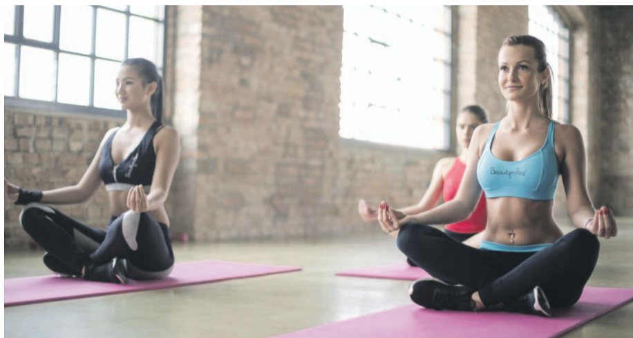
El hot yoga se realiza en instalaciones de más de 30 grados.

Estas disciplinas se posicionan como entrenamientos completos, funcionales y que además de cuidar la musculatura y la postura corporal, incorporan un enfoque de bienestar al deporte.