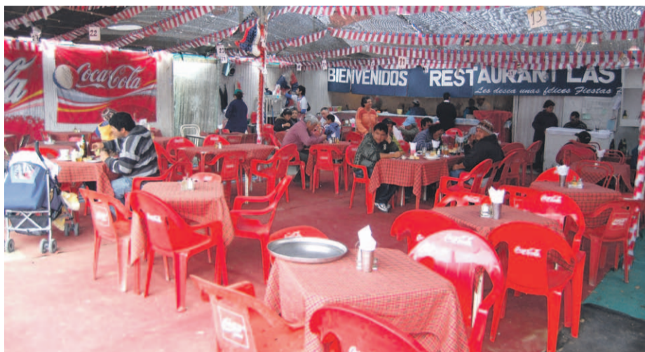
Durante años los grandes espacios de baile fueron uno de los mayores atractivos de La Pampilla.

En ese contexto, para esta edición de La Pampilla se presentaron dos