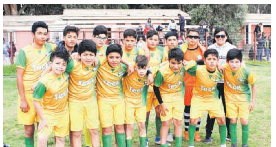
Selección Infantil SUB-13 de la Asofútbol de ANDACOLLO, compiten en las Eliminatorias Regionales