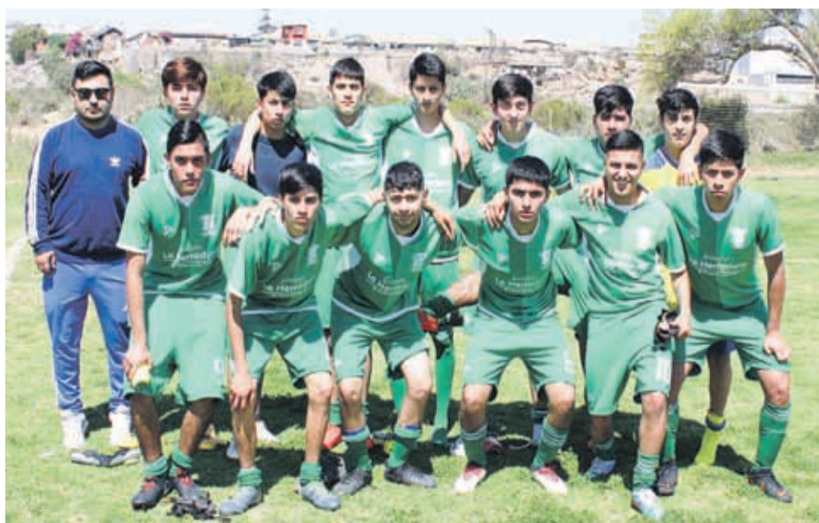
Deportivo LOS COPIHUES, Categoría Juvenil, Asofútbol La Serena, torneo de Clausura