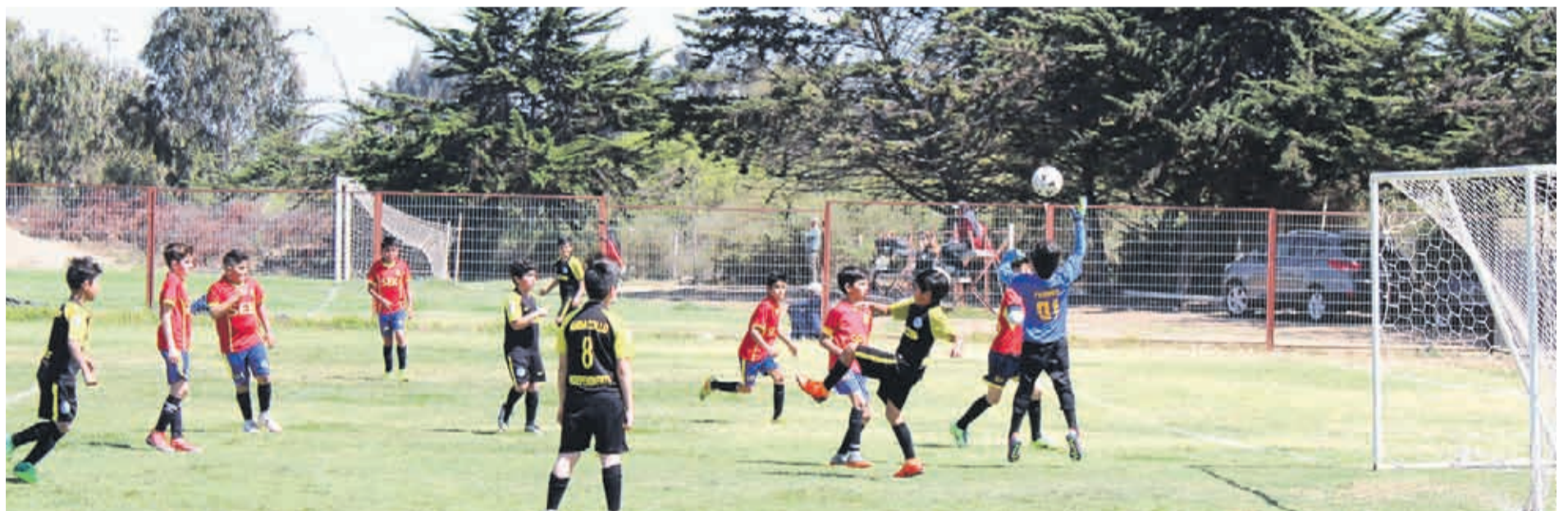
Presión ofensiva de los jugadores de Unión Española, es lo que desarrollan en sus compromisos