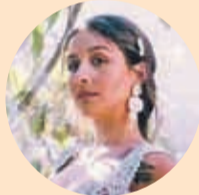
Denise Rosenthal (14:45 horas)

Tras su reciente participación en La Pampilla de Coquimbo, la cantante nacional regresa a la región para cantar sus hits radiales “Encadená”, “Agua Segura” e “Isidora”. La joven de 28 años cuenta con dos álbumes de estudio y una promisoriosa carrera.