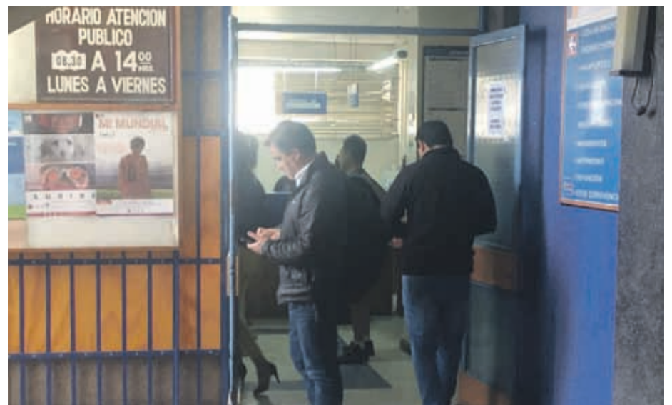
Las oficinas muchas veces colapsan ante la demanda de la comunidad.

Esta distinción es otorgada por primera vez a una autoridad comunal de Coquimbo, y lleva el nombre del ex Gobernador de la provincia de Entre Ríos entre los años 1973-