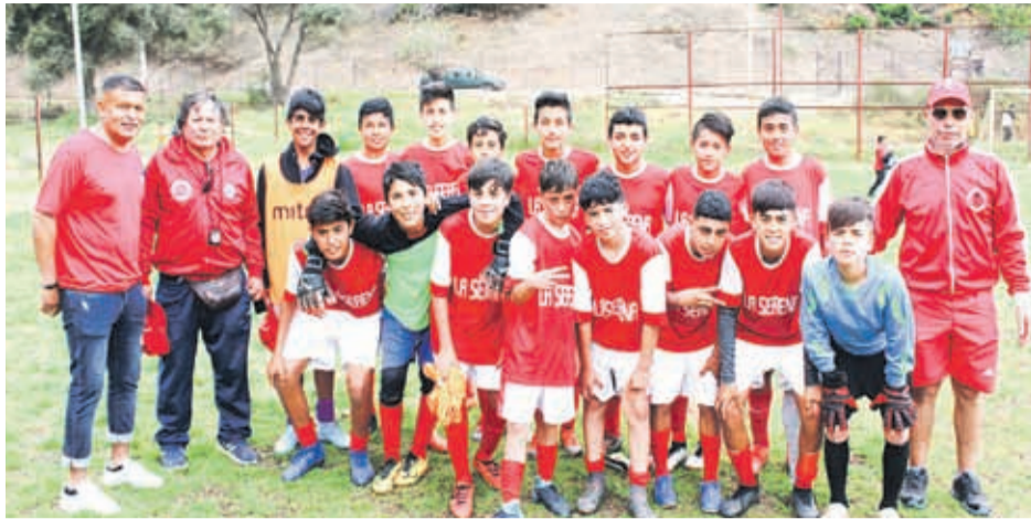
Selección Infantil SUB-13 de Asofútbol La Serena, Eliminatorias Regionales, avanza a la II Fase