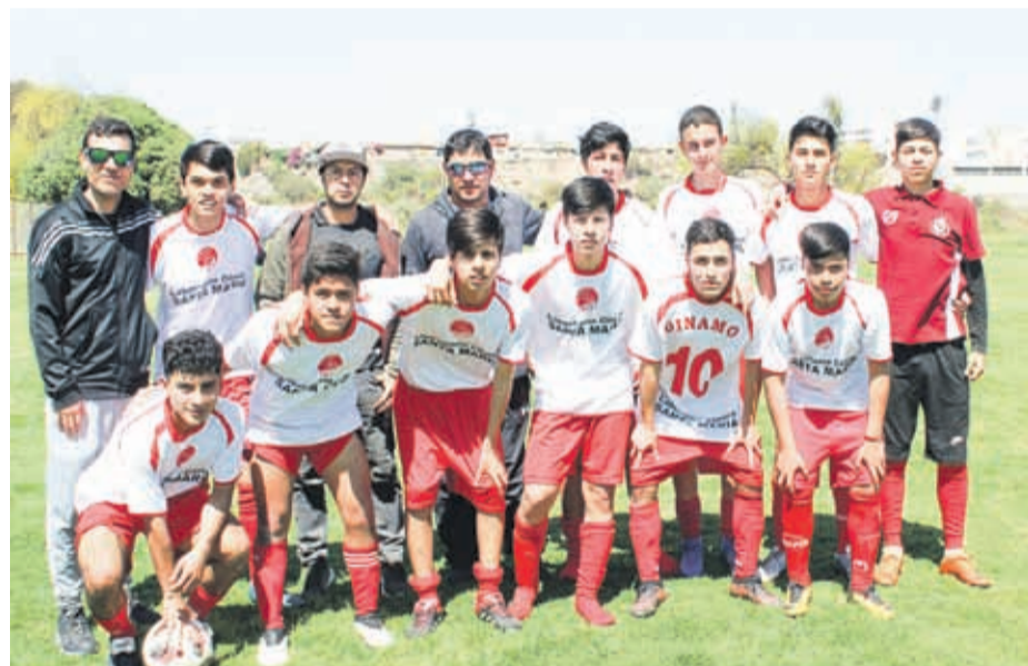
Deportivo DÍNAMO-- Juvenil -- Asofútbol La Serena, torneo de Clausura