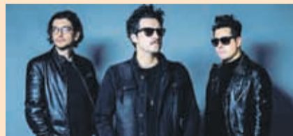
De Saloon (19:45 horas)

Es una de las bandas más importantes en la historia del rock chileno (35 años de trayectoria). Y es que sus dos primeros discos marcaron una época a fines de los ochenta, con clásicos como “Yo la quería” y “El frío misterio”.