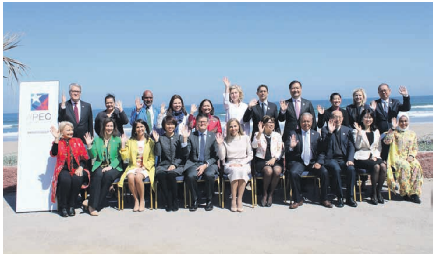
Los representantes de las 21 economías ligados a temas de Mujer y Equidad de Género de APEC posan para la prensa.

Desde la plana mayor del propio Foro de Asia Pacífico, su directora ejecutiva,