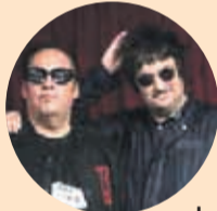
Los Tres (18:00 horas)

Tras su reciente participación en La Pampilla de Coquimbo, la cantante nacional regresa a la región para cantar sus hits radiales “Encadená”, “Agua Segura” e “Isidora”. La joven de 28 años cuenta con dos álbumes de estudio y una promisoriosa carrera.