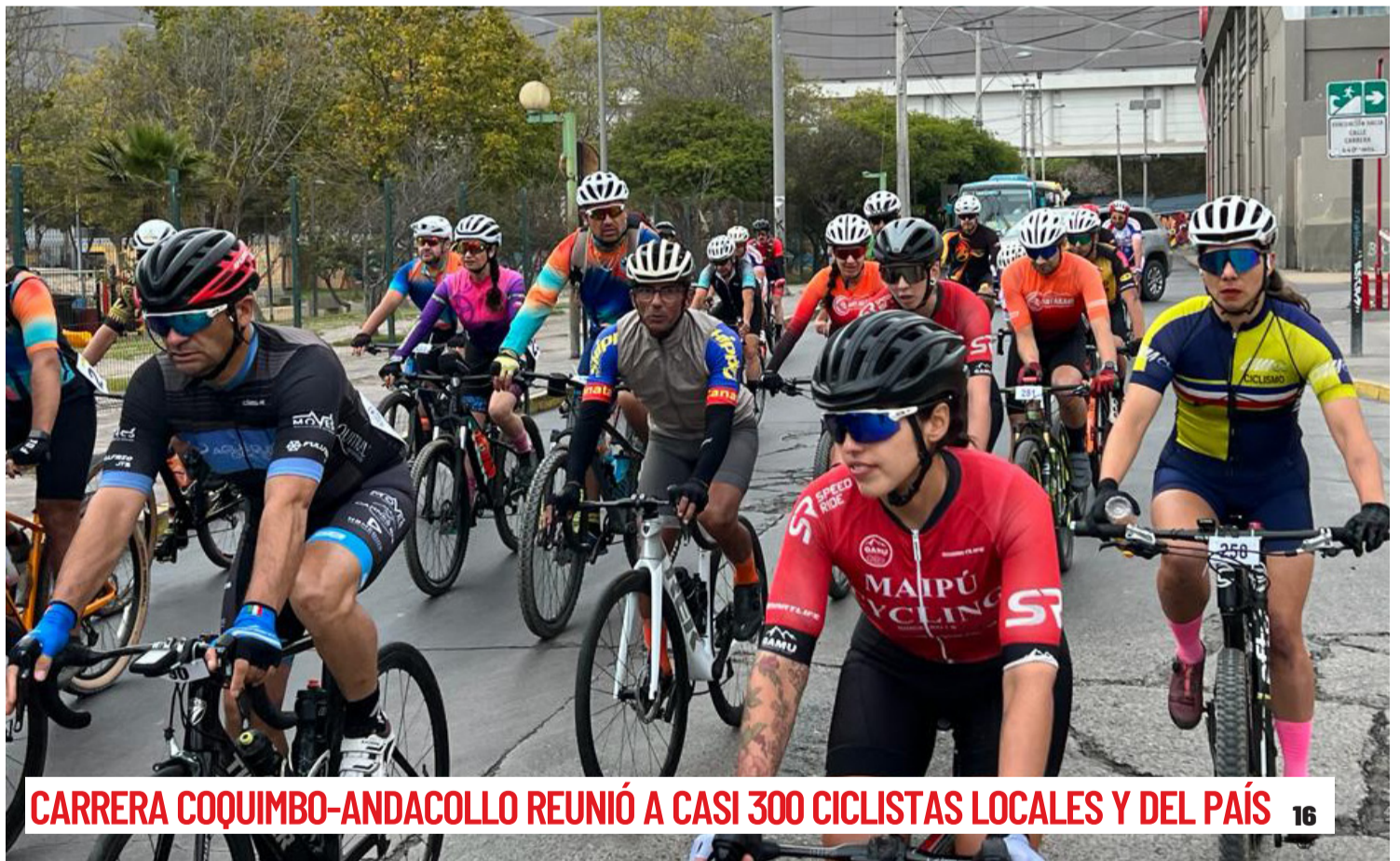
CARRERA COQUIMBO-ANDACOLLO REUNIÓ A CASI 300 CICLISTAS LOCALES Y DEL PAÍS 16

SALUD REPORTA DOS BROTES MÁS DE ESCABIOSIS EN LA REGIÓN 6