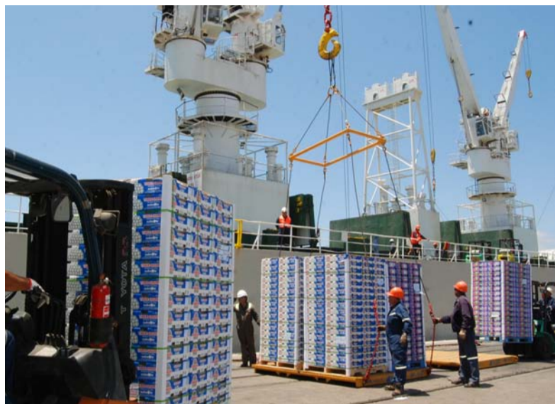
Los gremios del agro consideran que esta temporada será una de las complicadas de los últimos años.

Hace algunas semanas las cerezas y arándanos partieron con destino a los mercados del norte, iniciando así la temporada de exportación de la fruta en Chile. Sin embargo, el cambio climático y la falta de agua son factores que podrían incidir negativamente en las exportaciones.