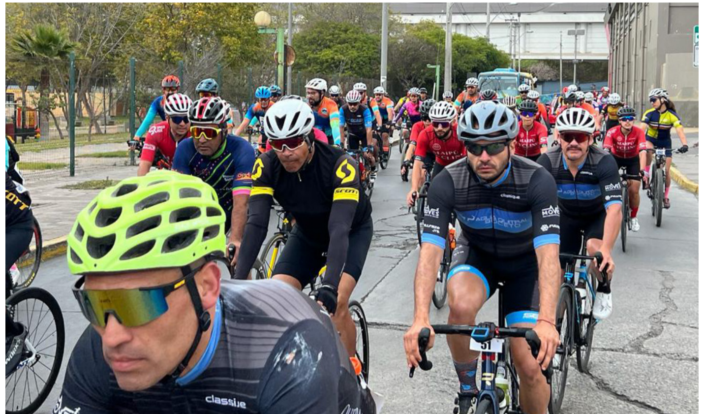
En el tramo inicial de la carrera, los competidores se desplazaron por el área urbana de Coquimbo.