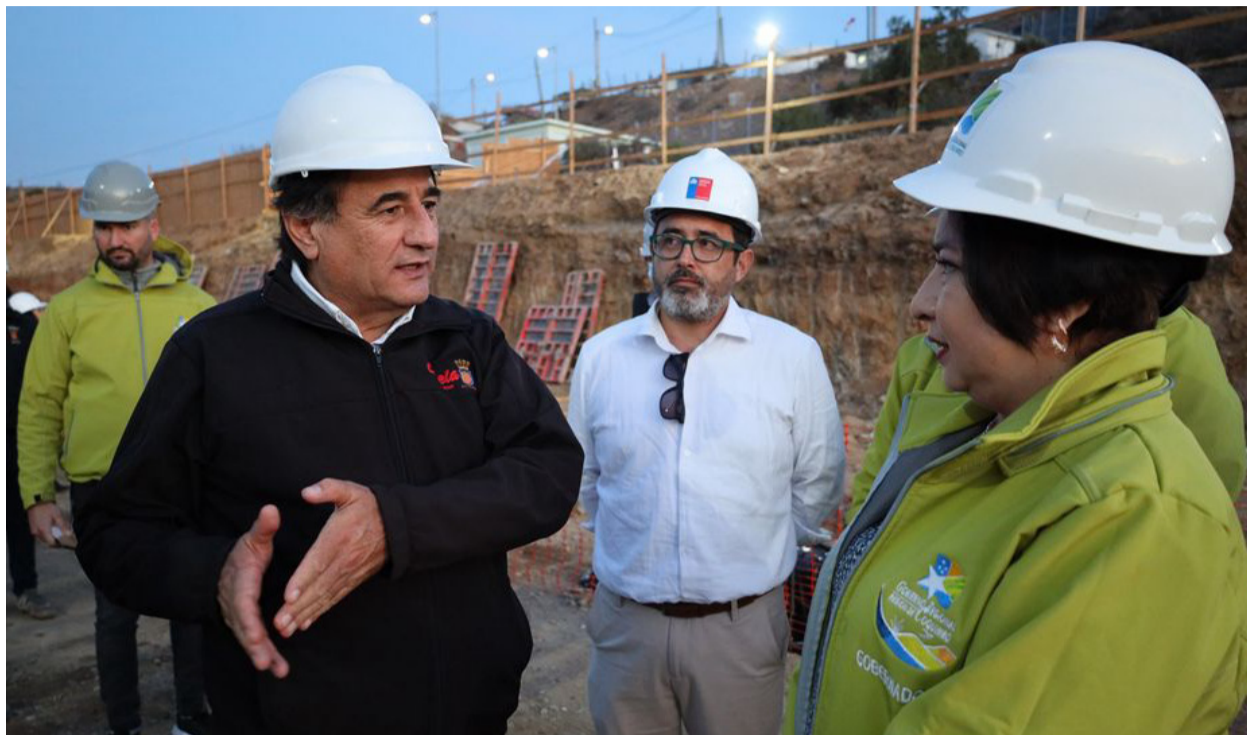
La gobernadora Krist Narango y el alcalde de Canela, Bernardo Leyton, recorrieron algunas de las obras que se desarrollan en la comuna.

Por su parte, el Índice General de Precios de Acciones (IGPA) presentó una variación de +1,23% y cerró en 29.703,02 puntos.