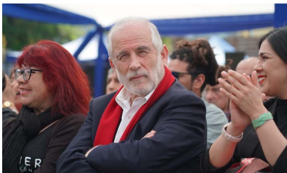
Desde que se destapara el “caso convenios”, la figura del ministro de Vivienda, Carlos Montes ha estado en el ojo del huracán.

Un grupo de parlamentarios evalúan presentar una Acusación Constitucional contra el ministro de Vivienda, por su responsabilidad política en el “caso convenios”.