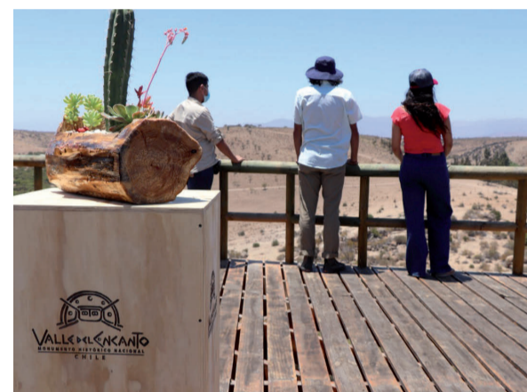
El Valle del Encanto está abierto de lunes a domingo.