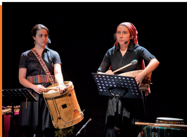
Cápac Ñan, Camino del Inca es una obra de radioteatro escénico.