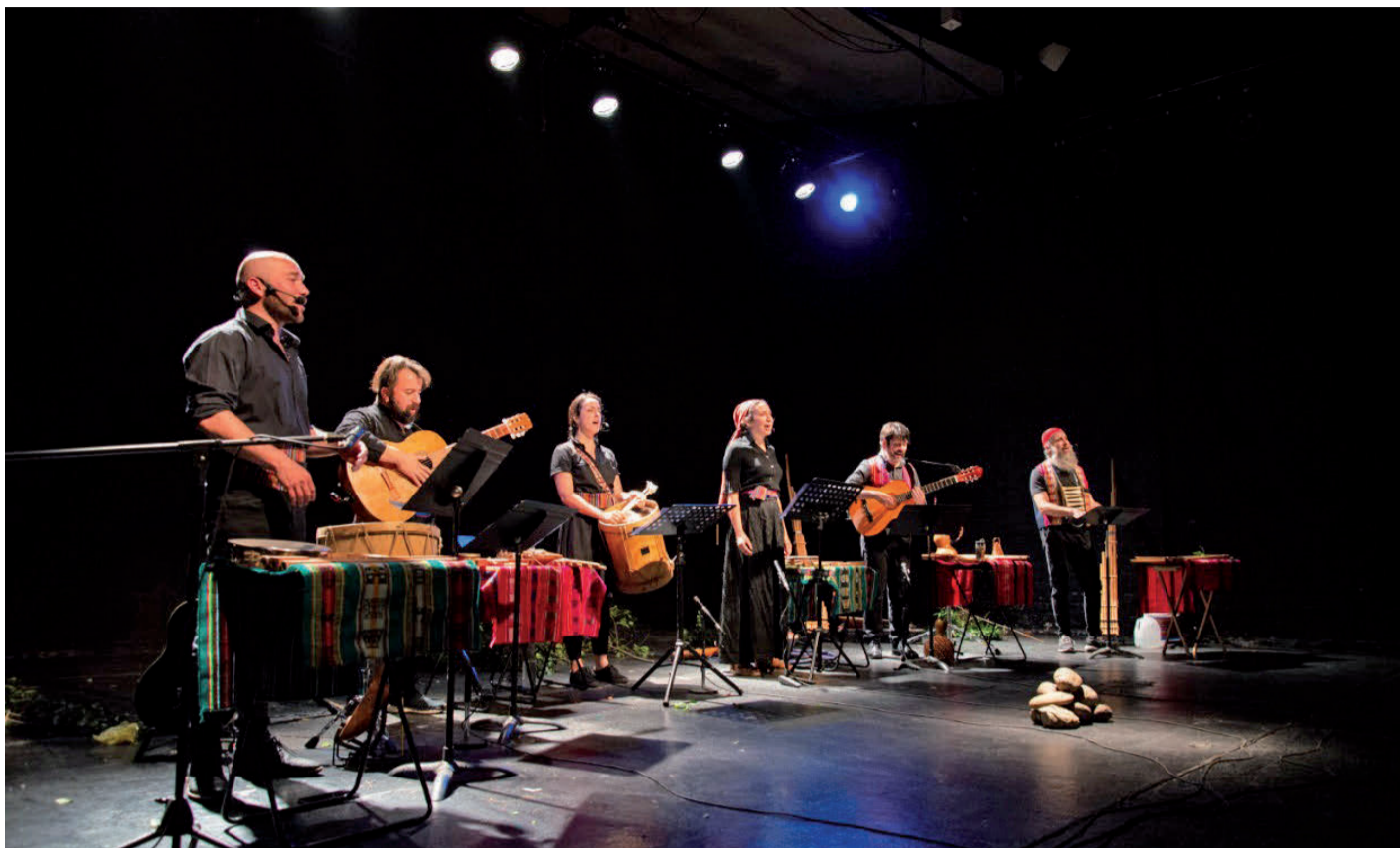
Seis actores - músicos cuentan la historia

Mañana el Teatro Municipal de Ovalle reabre sus puertas para presentar la obra de teatro escénico Cápac Ñan, Camino del Inca de la compañía Tryo Teatro Banda, de Santiago a Mil, en dos funciones, a las 16:30 horas y a las 19:30 horas.