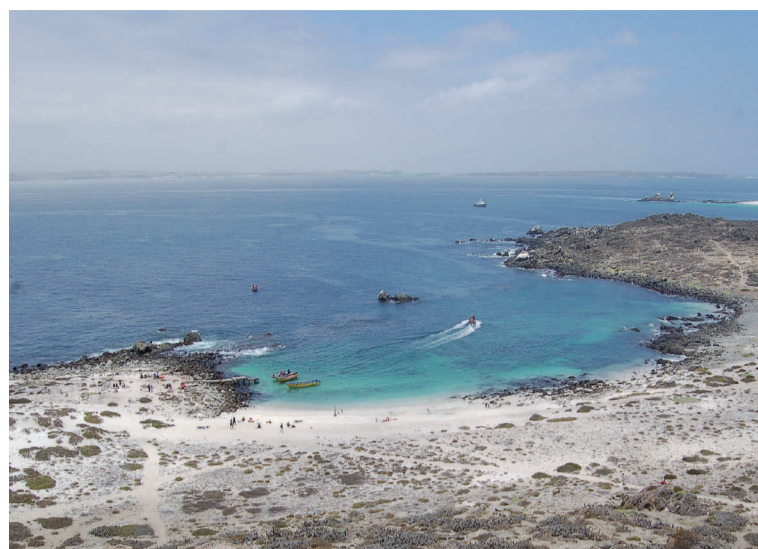
Se accede a la Reserva Nacional Pingüino de Humboldt por orden de llegada.

Gracias a la escasa intervención humana, esta zona fue reconocida el 2013 como el primer sitio "Starlight" de Sudamérica (certificación de cielos nocturnos libres de contaminación). Para acceder al lugar se ingresa hacia la costa desde la Ruta 5 con el kilómetro 358 (a la altura del ingreso a Peñablanca), y se recorre un camino de aproximadamente 18 kilómetros.