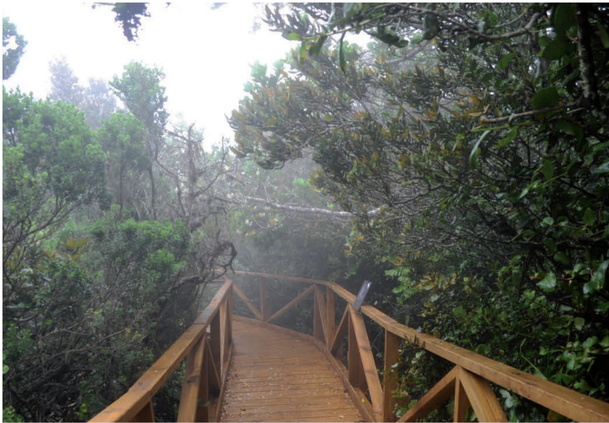
El Parque Nacional Bosque Fray Jorge está abierto de martes a viernes.

El ingreso es desde las 8:30 a las 13:30 y el horario de salida a las 16:30 horas, reservando la visita a parque.frayjorge@conaf.cl