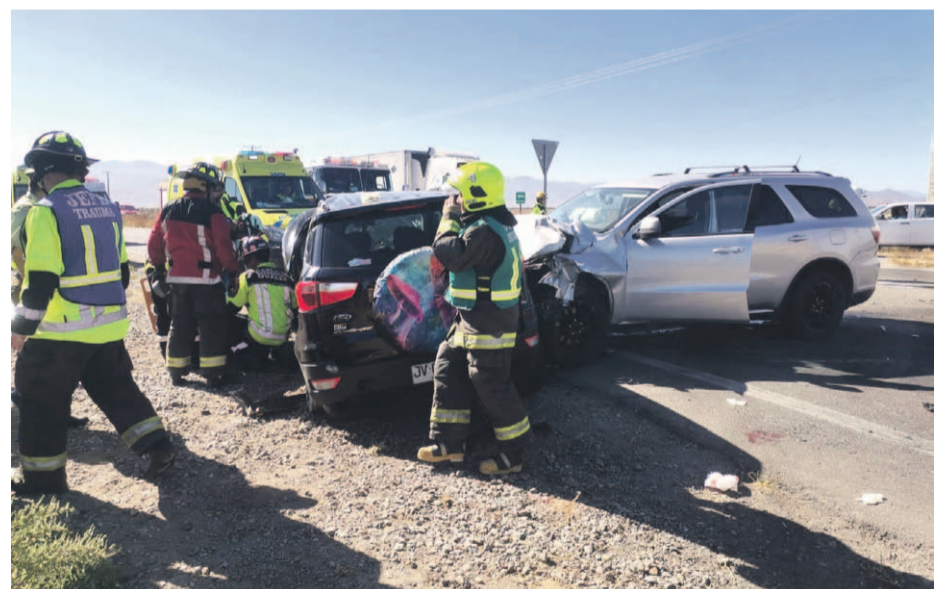
En el cruce de San Julián se produjo el segundo accidente, con dos mujeres fallecidas.

OFICIAL INVESTIGADOR DE LA SIAT DE CARABINEROS