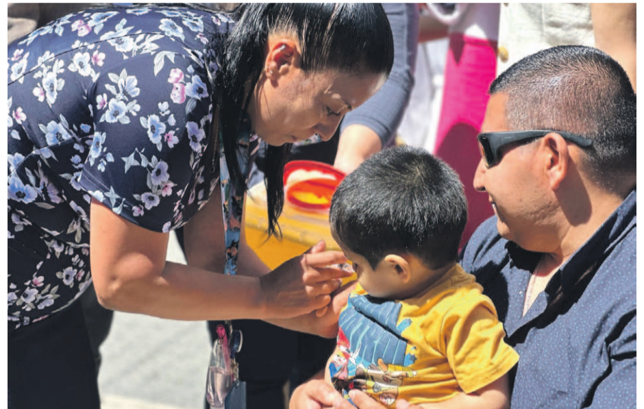
Las vacunas ya están disponibles en los distintos Cesfam y centros donde se inocula contra los virus respiratorios.

En este contexto, el delegado presidencia, Galo Luna, hizo un llamado a