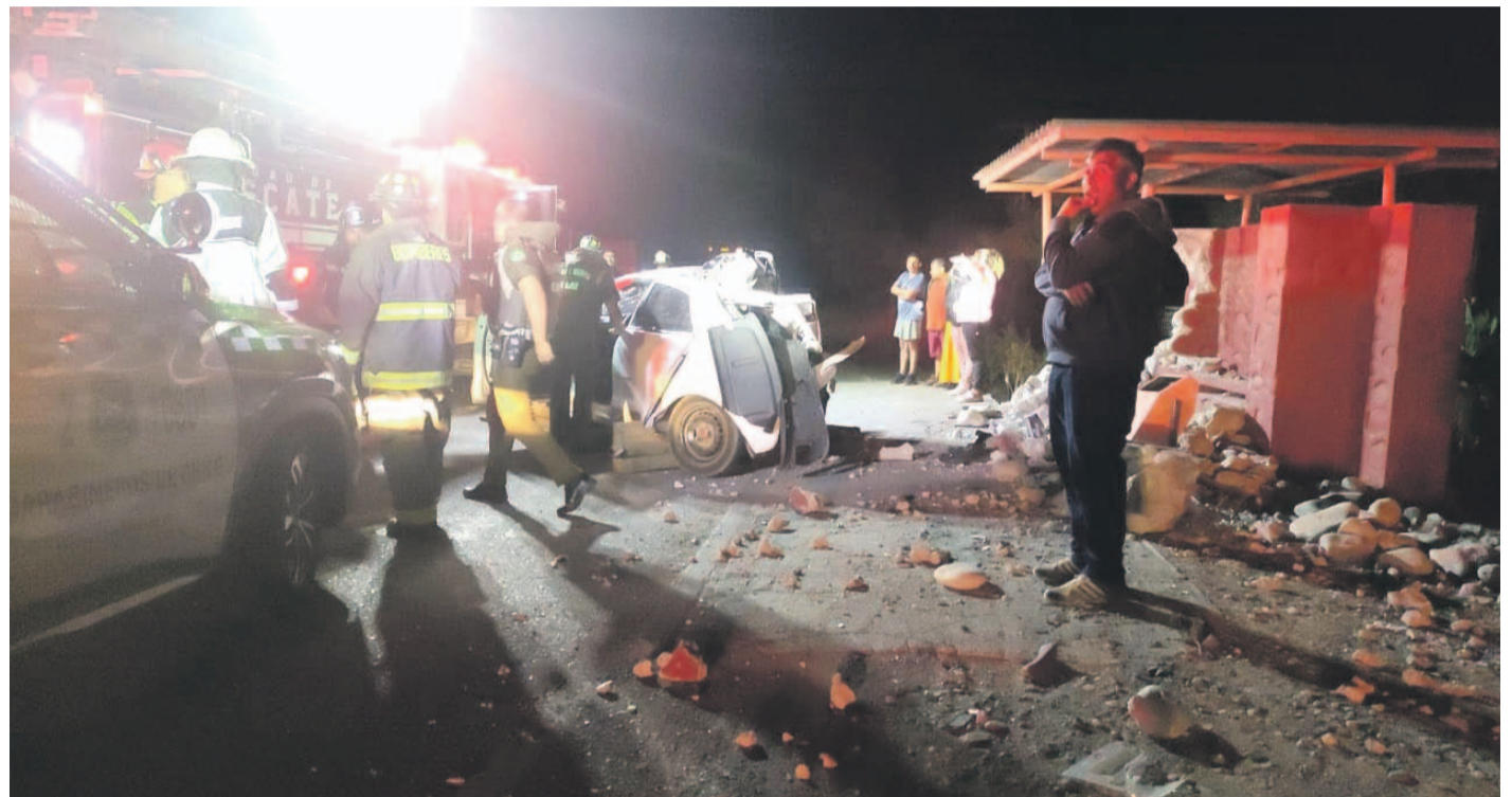
El primer accidente ocurrió en horas de la noche, dejando un hombre fallecido.