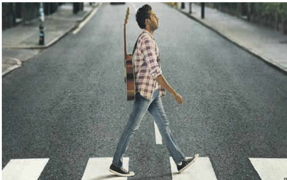
En "Yesterday", que ya lanzó su trailer, los Beatles nunca aparecen en escena. La original idea de los célebres directores de cine Danny Boyle y Richard Curtis fue recrear un mundo donde los cuatro fantásticos jamás existieron.

El estreno de la película de Danny Boyle, que imagina un mundo en el que nadie conoce al grupo de Liverpool, invita a reflexionar (una vez más) sobre la relevancia de un conjunto que todavía hoy aglutina millones de seguidores a lo largo del planeta.