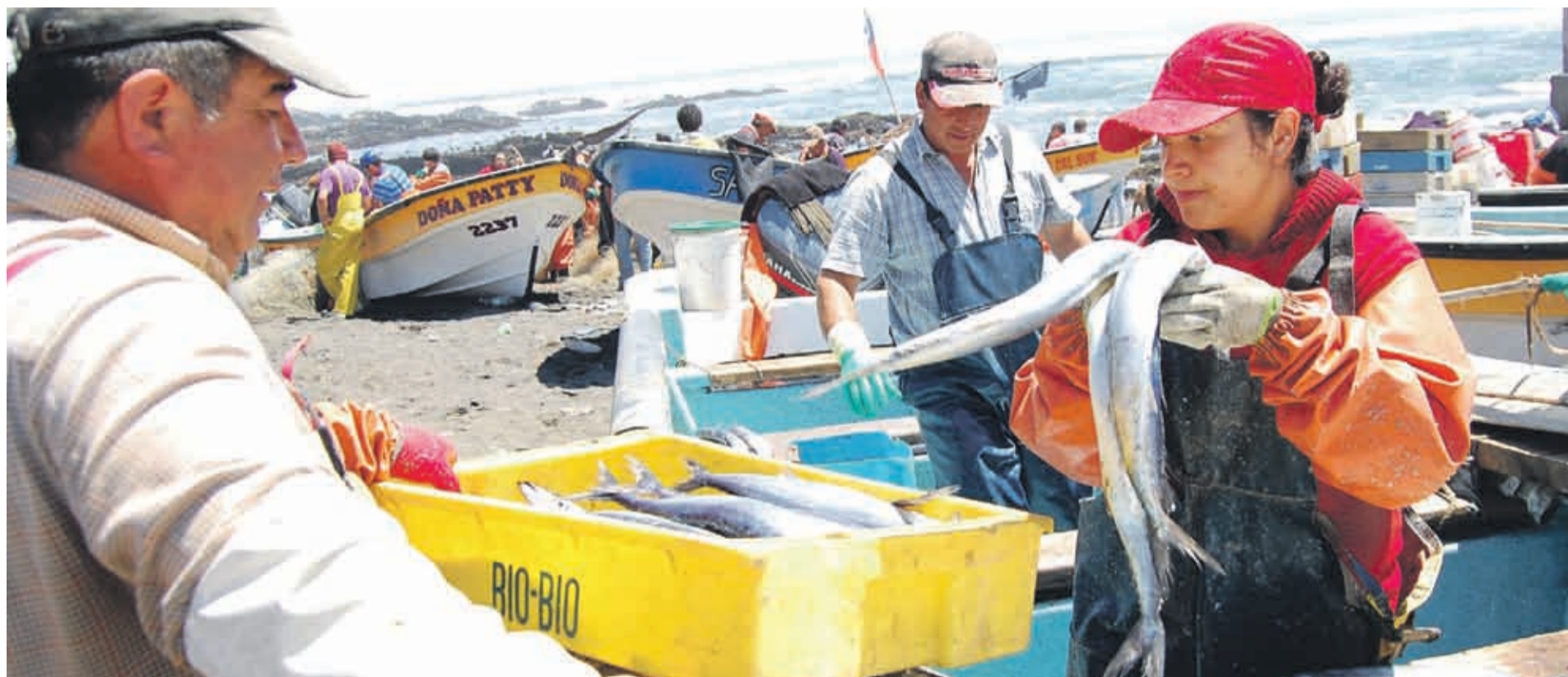
La ley es un instrumento clave para avanzar hacia el fortalecimiento de la productividad y diversificación de las actividades pesqueras artesanales.