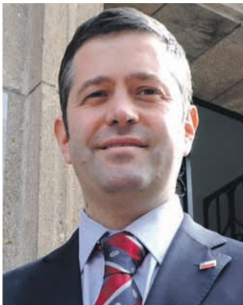
EL SEREMI de Economía, Gonzalo Chacón, muestra buena disposición ante los rumores.

Sin embargo, al ser consultado por esta materia, prefiere no entregar mayores declaraciones y así no involucrarse en la discusión.