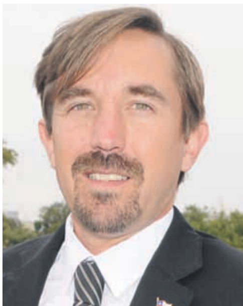
EL SEREMI del Trabajo, Matías Villalobos, habría descartado esta posibilidad.