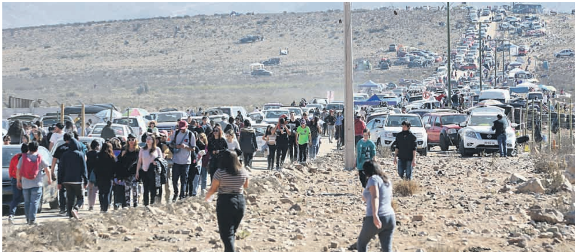
EL ALTO COBRO DE ESTACIONAMIENTO EN LA HIGUERA llevó a la mayoría de las personas a estacionar en el camino aledaño al principal punto de observación.

Este problema también afectó a algunos turistas nacionales, quienes debido al 100% de las reservas durante el eclipse en la zona, presentaron dificultades para conseguir alojamiento, teniendo incluso que pernoctar en los terminales de buses. S801