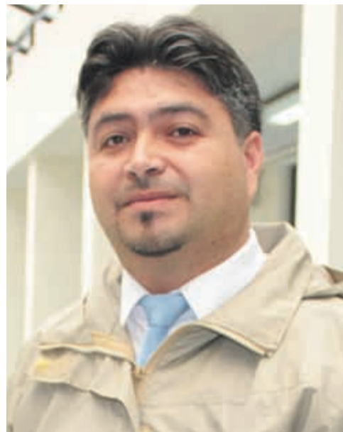
EL SEREMI de Agricultura, Rodrigo Órdenes, subraya que tiene disponibilidad.