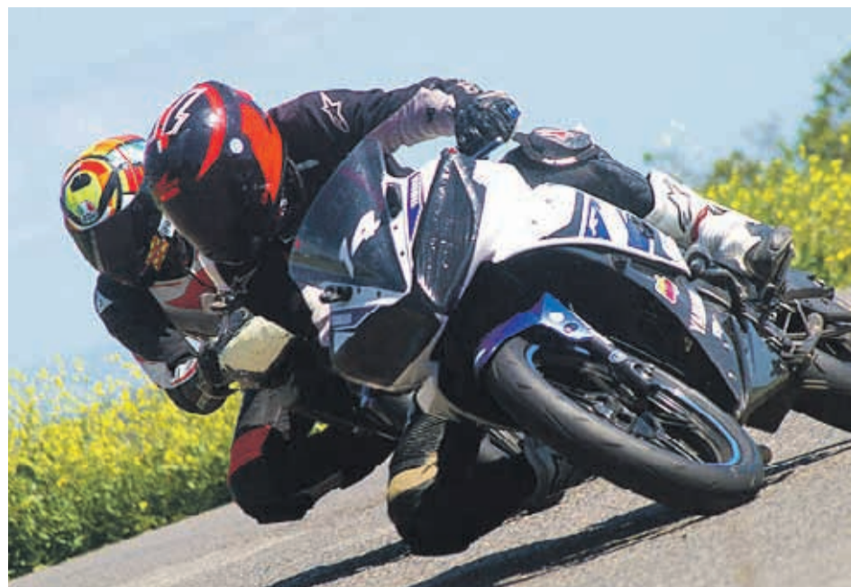
La velocidad se concentrará durante dos días en la pista serenseña.