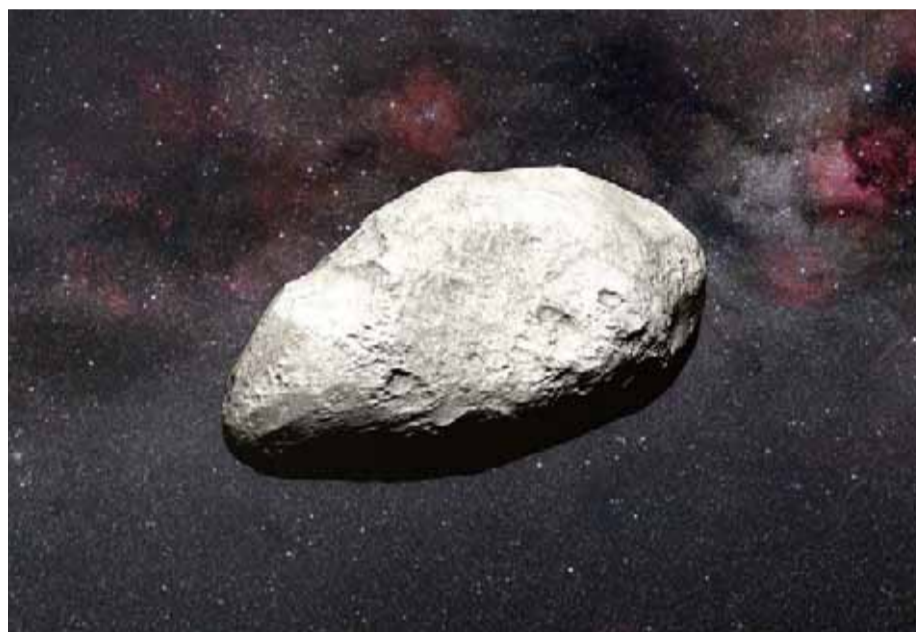
El Sistema Solar está repleto de asteroides y pequeños cuerpos rocosos.

El 30 de junio se celebró el Día Internacional de los Asteroides, una fecha que pretende concienciar sobre la importancia de estudiar y rastrear estos cuerpos celestes, fuente de una valiosa información científica, pero que también representan una amenaza para nuestro planeta.