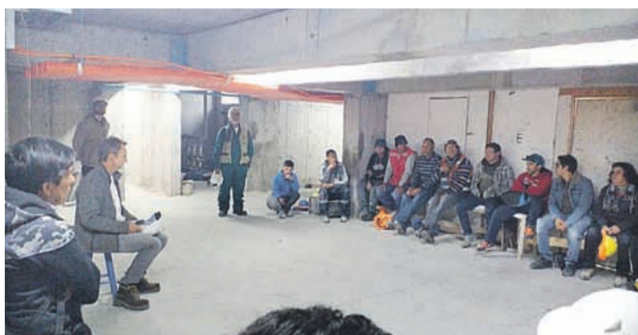
Otra de las inmobiliarias que se sumó es Ecovista, donde dieron espacio a la discusión de la seguridad laboral y a la contingencia.

De todas formas, aclaró que este encuentro originalmente fue organizado