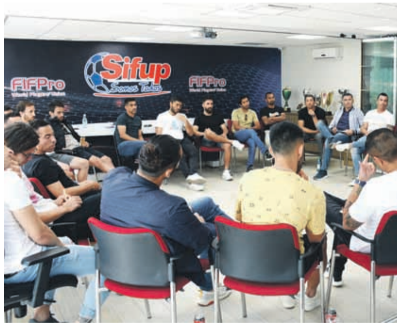
Los futbolistas se reunieron en la capital y consideraron que no era prudente que el fútbol se reanudara este fin de semana.

Sin embargo se mostró preocupado por lo extenso que se ha tornado esta situación, “la idea es que se tome una resolución en conjunta, no se puede terminar el campeonato, porque hay muchas cosas en juego, hay liguillas, ascensos y descensos, no se puede terminar el torneo, aunque en Primera División se puedan mostrar interesados en que se acabe todo el año”, indicó.