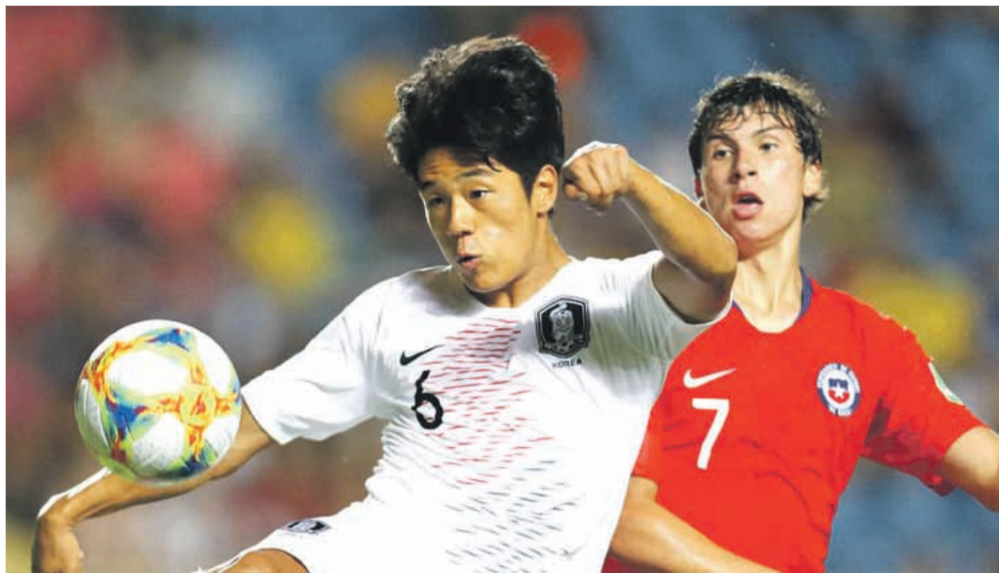
El equipo nacional tiene la gran opción de enfrentar a Brasil, claro favorito del Mundial Sub 17.