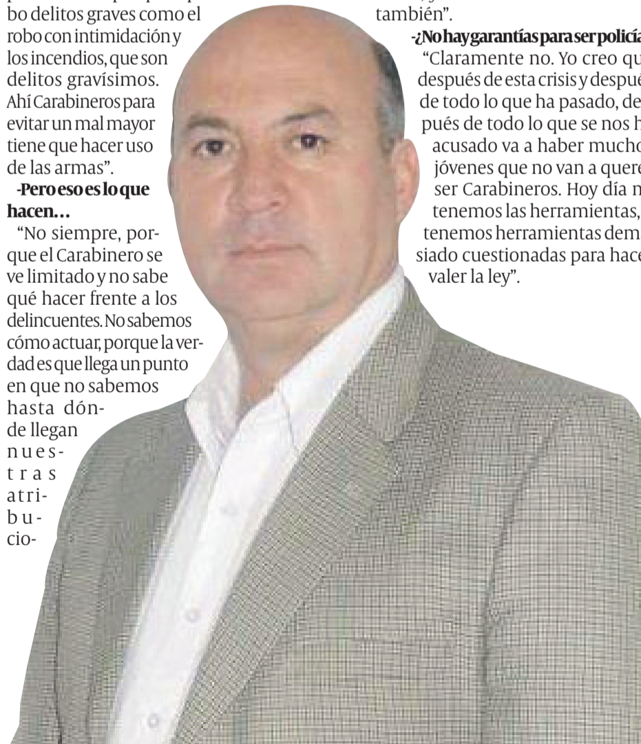
“La gente reclama cuando Carabineros actúa, y cuando carabineros no actúa”, señala Infante.

“Claramente no. Yo creo que después de esta crisis y después de todo lo que ha pasado, después de todo lo que se nos ha acusado va a haber muchos jóvenes que no van a querer ser Carabineros. Hoy día no tenemos las herramientas, o tenemos herramientas demasiado cuestionadas para hacer valer la ley”.