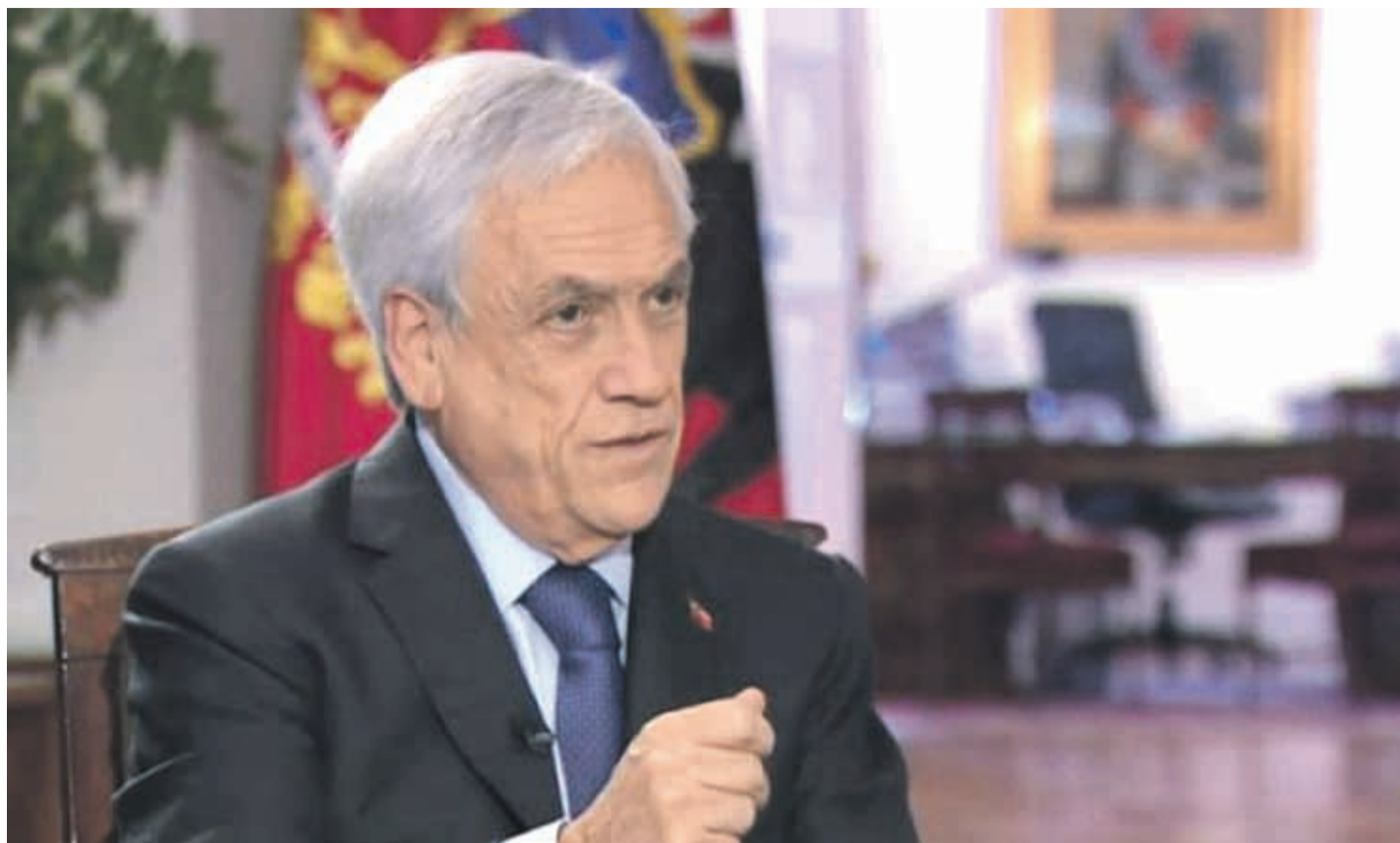
El Presidente Sebastián Piñera habló sobre la crisis social que enfrenta Chile, en entrevista con la BBC.

Asimismo, sostuvo que las medidas adoptadas por su Gobierno para hacer frente a las demandas de los manifestantes, entre las que figuran cambios en el Ejecutivo, no son simplemente retoques estéticos. “Siempre habrá gente que dirá que lo que hemos hecho no es suficiente y que todo es cosmético. Cómo puede ser cosmético cuando estamos haciendo cosas