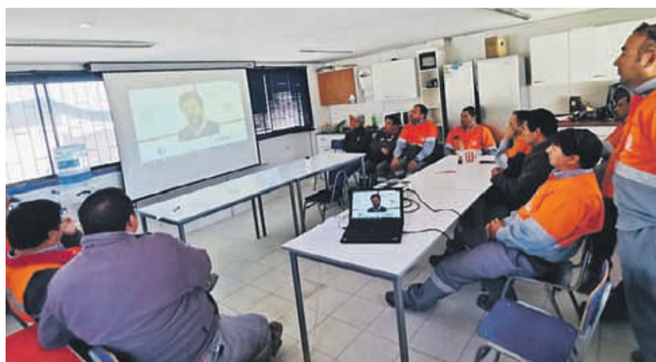
La empresa Cemento Polpaico es otra de las compañías que se inscribió y participó en diálogo con los trabajadores, una experiencia útil.