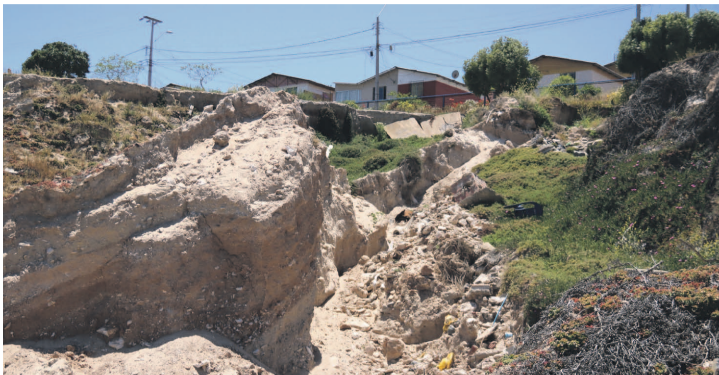
Los vecinos de Villa Talinay han visto como, lo que era una hermosa plaza, se fue cayendo poco a poco, transformándose en un verdadero peligro.