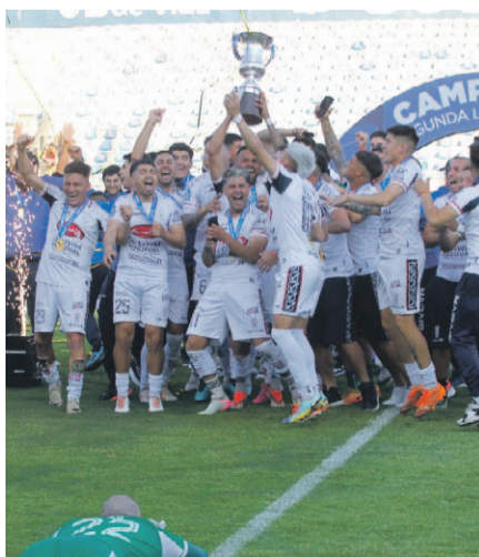
Melipilla es el último ascendido de Segunda División a la Primera B.

Se cansaron. Las instituciones de la tercera categoría aspiran a tener voz y voto en las decisiones del Consejo de Presidentes.