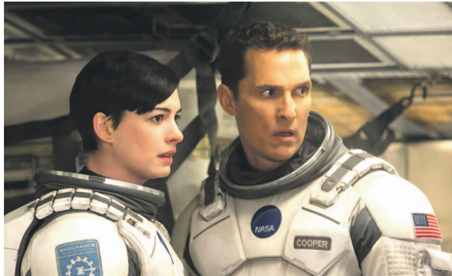
Matthew McConaughey y Anne Hathaway encarnan a los astronautas Cooper y Brand, quienes se embarcan en una misión épica para salvar a la humanidad.

Allí, el Dr. Brand (Michael Caine) y su hija Amelia (Anne Hathaway) lideran un proyecto desesperado que busca nuevos mundos habitables a través de viajes interestelares. Al percibir el po-