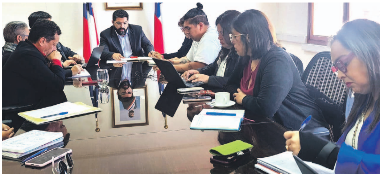
Imagen de una de las marchas que llevaron a cabo los docentes por el centro de la capital regional.

Desde la Corporación GGV se comprometieron a realizar un pago de 1.900 millones de pesos hasta el primer semestre de 2025. En detalle, fueron 19 establecimientos municipales los que respaldaron la propuesta.