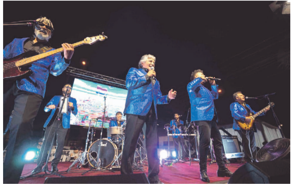
Los Viking's 5 cantaron sus más grandes éxitos en el evento de aniversario.