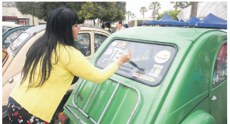
Más de 150 automóviles de exhibición, vehículos drift, 4x4, motos choperas, shows musicales y patio de comidas serán parte del evento.