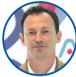
Ali Manouchehri ALCALDE DE COQUIMBO

“Una de las cosas más interesantes fue lo que se está planificando con el Programa de Empleabilidad, que mejoraría sus condiciones tanto para el apoyo municipal como para los beneficiarios”