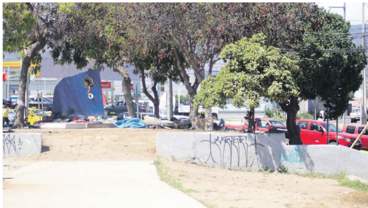
Cerca de la Alameda se instalan perros que en ocasiones atacan a los transeúntes.