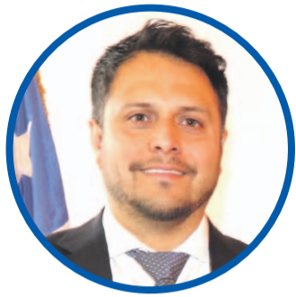
Darwin Ibacache GOBERNADOR REGIONAL

“Mostramos la cartera, el avance de cada iniciativa y los nudos críticos en inversión para transparentar y facilitar la planificación. Esperamos que la Dipres destrabe pronto proyectos clave”