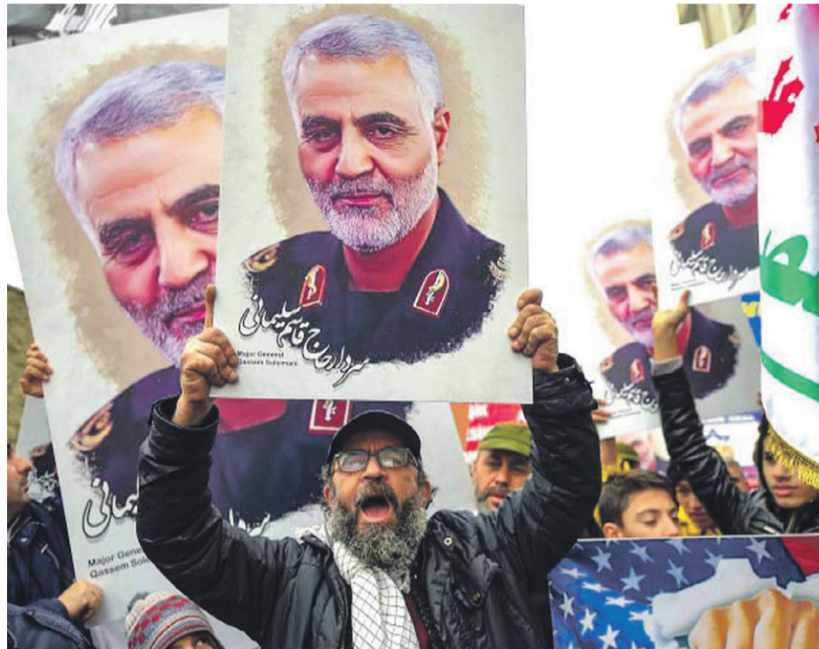
Fuerte conflicto en las calles contra el gobierno norteamericano

El primer ministro renunciante iraquí, Adel Abdel Mahdi, denunció “un asesinato político” de Soleimani y de Muhandis, que sólo deja dos opciones: “llamar a las tropas extranjeras a que se vayan inmediatamente o revisar su mandato mediante un proceso parlamentario”.