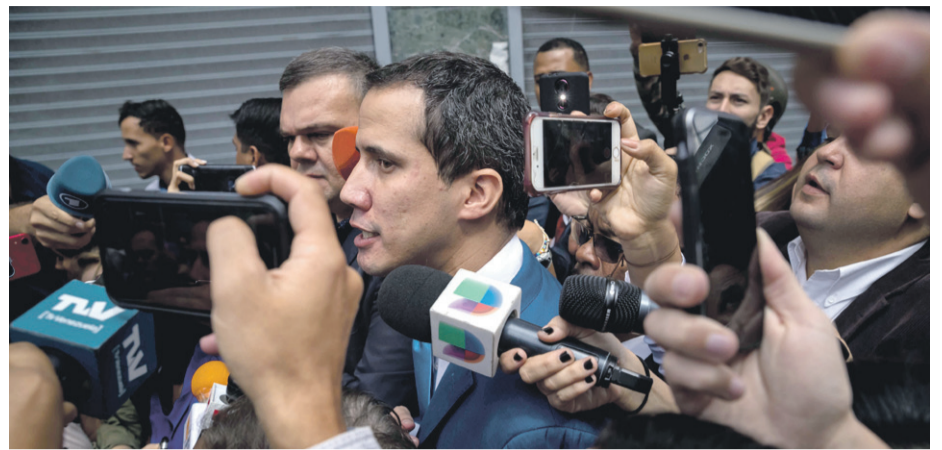
Juan Guaidó tras ser bajado de intentar subir la verja para entrar a la Asamblea Nacional