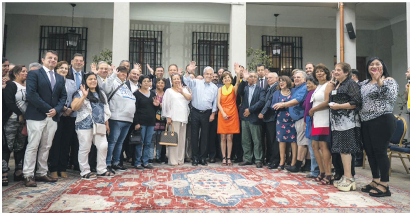
Sebastián Piñera articuló el proyecto para la campaña “Mejor Fonasa”.

Bajo la campaña Mejor Fonasa del Gobierno, lo que se busca es beneficiar a 14,5 millones de afiliados al seguro público de salud, mejorando sus prestaciones y el servicio.