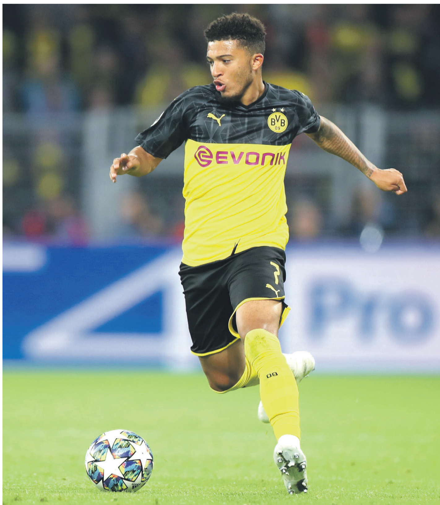
Jadon Sancho, del Borussia Dortmund, uno de los futbolistas más cotizados de la generación de los nacidos en 2000.

El ejemplo más significativo lo protagoniza el delantero inglés Jadon Sancho (el 25 de marzo cumplirá 20 años), del Borussia Dortmund, emergente estrella desde que en 2017 recalara en el equipo