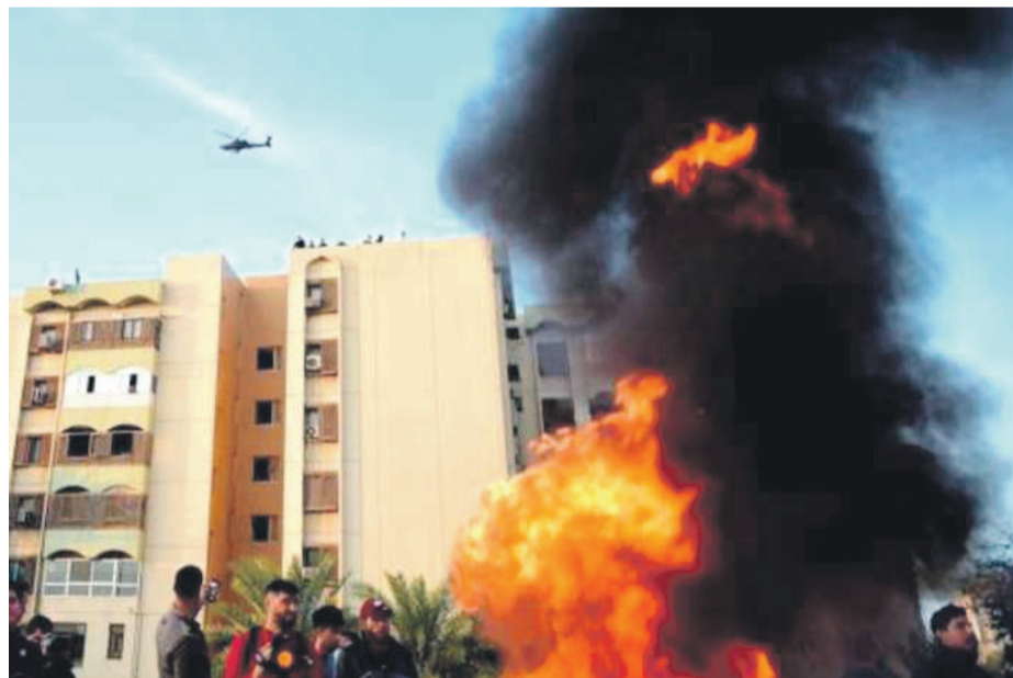
Ayer lanzaron dos proyectiles cerca de la embajada de los Estados Unidos. El acto no dejó lesionados.