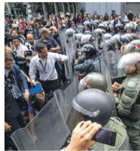
Guardia Nacional Bolivariana impidiendo la entrada de diputados

Por todo ello, advirtió que en este momento "Venezuela no tiene Parlamento instalado" puesto que "no hubo votación nominal, secuestraron a los parlamentarios en el hemiciclo", así como a los diplomáticos que acudieron al Palacio Legislativo, puesto que ninguno de ellos pudo salir mientras duró la refriega.