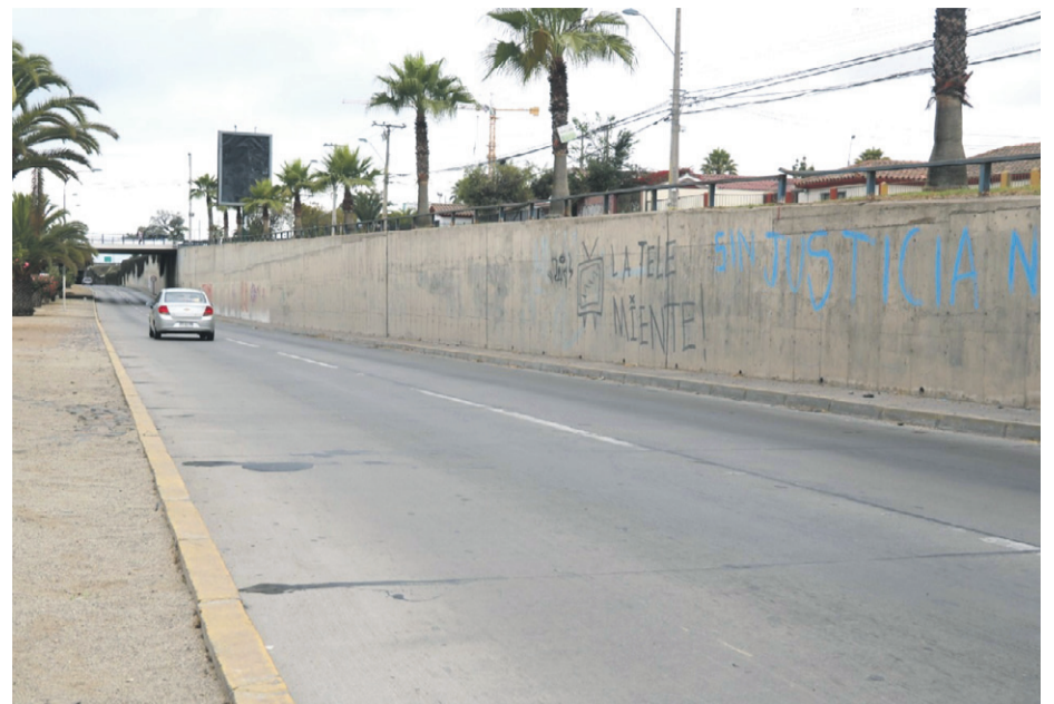
Imagen de Ruta 5 norte kilómetro 461, lugar del atropello en la comuna puerto.

Cabe precisar que el sujeto identificado con las iniciales M.C.C de 39 años conducía en estado de ebriedad, arrojando 1,56 G/L de alcohol en la sangre, por lo que fue detenido, a la espera de la citación.