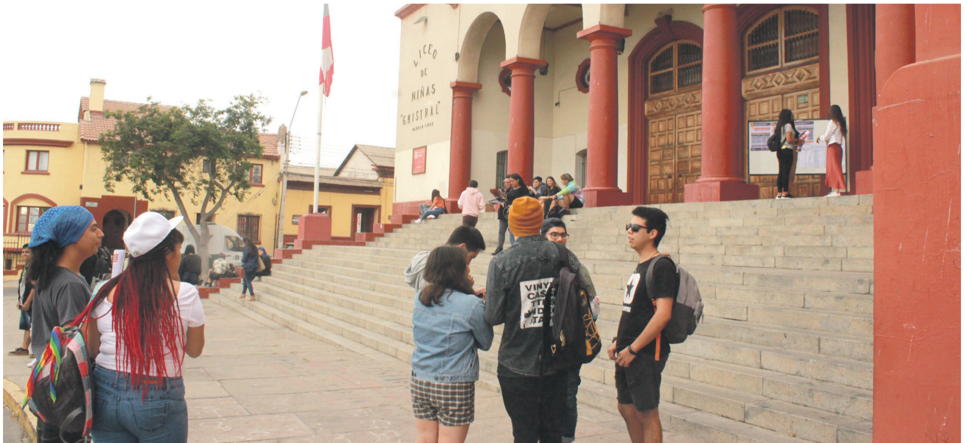
El proceso de reconocimiento de salas se realizó con normalidad, entre las 17:00 y 19:00 horas, en el Liceo Gabriela Mistral.

Pese a las amenazas de la Asamblea Coordinadora de Estudiantes Secundarios (ACES) de boicotear la rendición de la Prueba de Selección Universitaria, el Consejo de Rectores optó por continuar con el proceso. En conversación con El Día, estudiantes de la zona coinciden en que existe incertidumbre y temor.