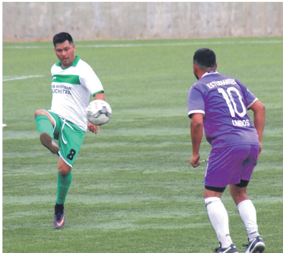
Unión Tangué (serie 35) ganó por 3 a 0 a Estudiantes