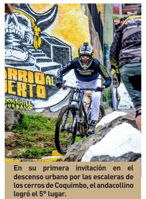
En su primera invitación en el descenso urbano por las escaleras de los cerros de Coquimbo, el andacollino logró el 5º lugar.