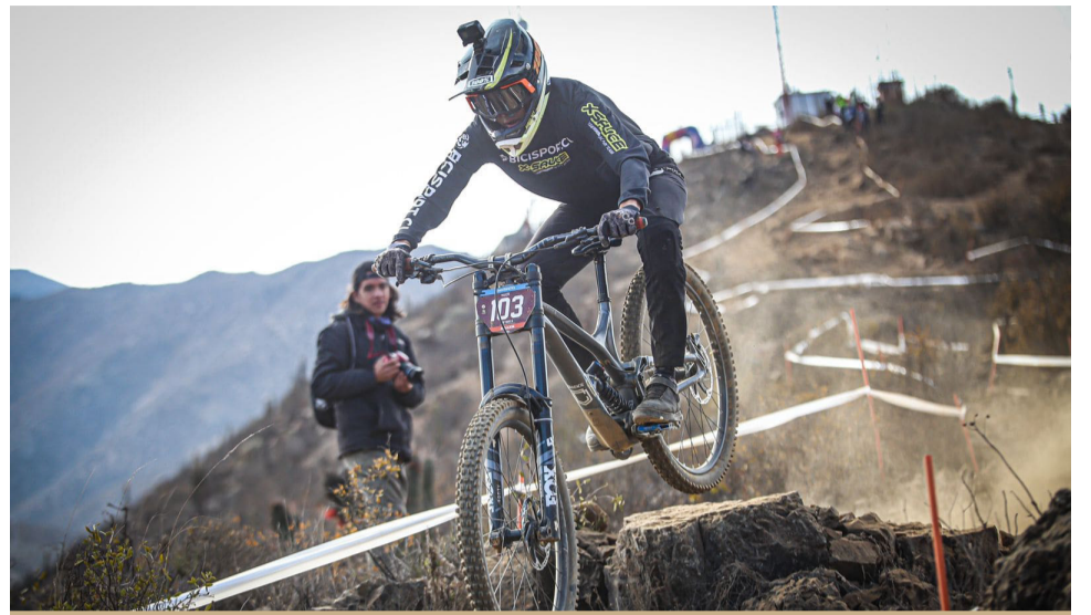
En la categoría experto, es el mejor en la DH Serie.