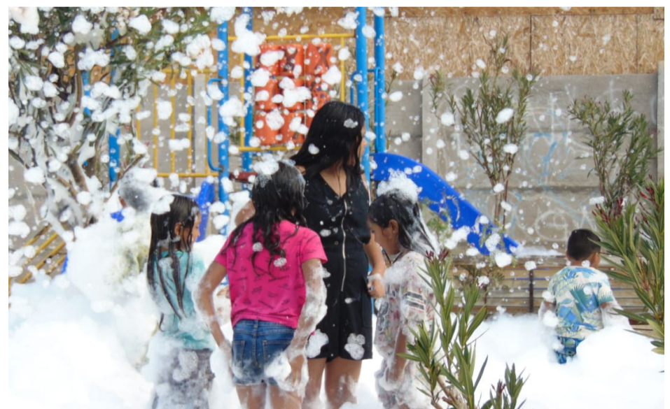
Los niños y niñas de la comuna fueron los que más disfrutaron de esta actividad.

Si bien las fiestas se realizaron pensando en los más pequeños y jóvenes de los hogares, la diversión alcanzó para todos, puesto que se vio a muchas mamitas juntos a sus retoños disfrutando de esta fiesta veraniega.