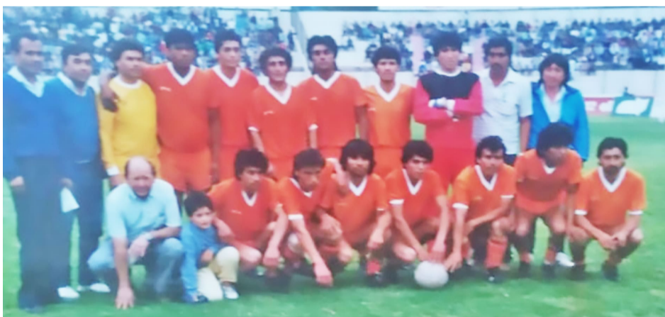
El equipo que llegó a la final del campeonato Regional de Campeones el 1988.