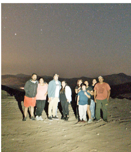
Una salida a terreno para la observación de las estrellas.