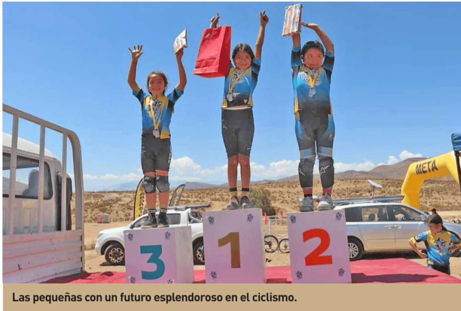
Las pequeñas con un futuro esplendoroso en el ciclismo.

La institución crece y sueña en competencias a nivel nacional.