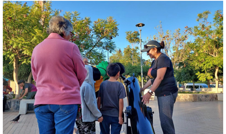
A plena luz del día los niños disfrutaron observando a Júpiter.

El Astroclub, es una iniciativa que busca fomentar el conocimiento mediante entretenidas actividades, siendo el primer club infantil de Andacollo que se relaciona con la astronomía y nace con el fin de potenciar los conocimientos de los niños y niñas sobre el cielo observable del hemisferio sur. En los talleres realizados, les enseñaron sobre los cometas, asteroides, además de una exposición sobre la vida y extinción de los dinosaurios. Como última actividad, fue la salida a terreno para observar la ocultación de Júpiter.