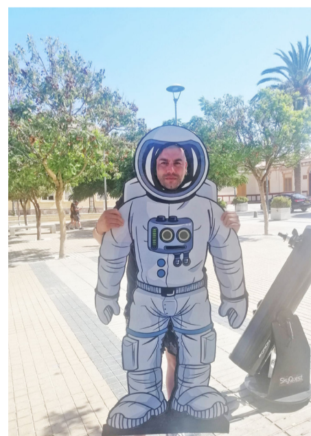
Los papás también imaginaron ser un astronauta.