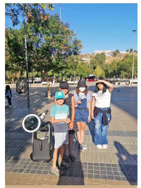
La Plaza Videla fue el centro del universo para los niños que participaron de los talleres.