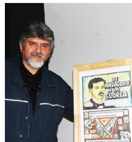
El argentino radicado en Andacollo hace más de 20 años, se ilusiona con la estatua del médico andacollino.

Pues bien, así los fines de semana, cuando la ciudad se llena de turistas, a los niños se les eduque y entretenga con las marionetas, títeres y también con los telescopios, dice el directivo de La Veta, quien enfatiza que todo eso es en beneficios para la comuna. “Si Andacollo es un lienzo en blanco. Solo hay que escribir su historia y mostrarla al mundo”.