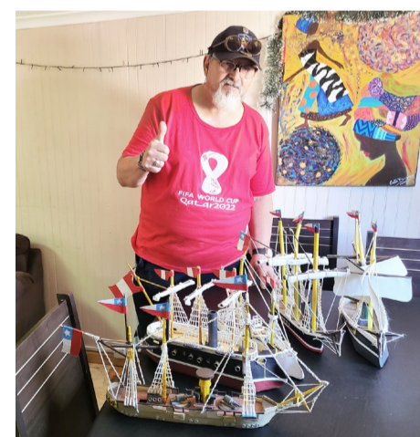
La agrupación espera concretar muchas ideas en beneficio de la comunidad.

INFÓRMATE DE LOS PROCESOS DE TRONADURA WWW.TECK.COM , MUNICIPALIDAD DE ANDACOLLO Y MEDIOS DE COMUNICACIÓN DE LA COMUNA.