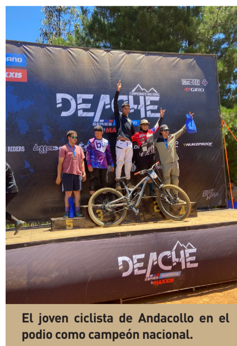
El joven ciclista de Andacollo en el podio como campeón nacional.

Ahora que demostró ser capaz y tener pasta de campeón, el joven ciclista se dio un plazo para definir su futuro. ¿Será el ciclismo su profesión? o ¿vivirá de la ingeniería mecánica automotriz donde cursa actualmente el cuarto año?. Esa es su gran pregunta y la respuesta es que “en eso estamos dando el cien por ciento para poder lograr mi sueño de poder vivir de la bicicleta, de llegar a ser uno de los grandes del ciclismo nacional y poder correr un Valparaíso cerro a bajo. Ah, por invitación corrí en Coquimbo y terminé en quinto lugar. Pues bien, ahora me propuse un plazo de dos a tres años para conseguir el sueño de vivir del ciclismo de descenso. Y si por esas cosas de la vida no puedo lograr esos objetivos, le bajaría un cambio al deporte y seguiría con la profesión que estoy estudiando”.