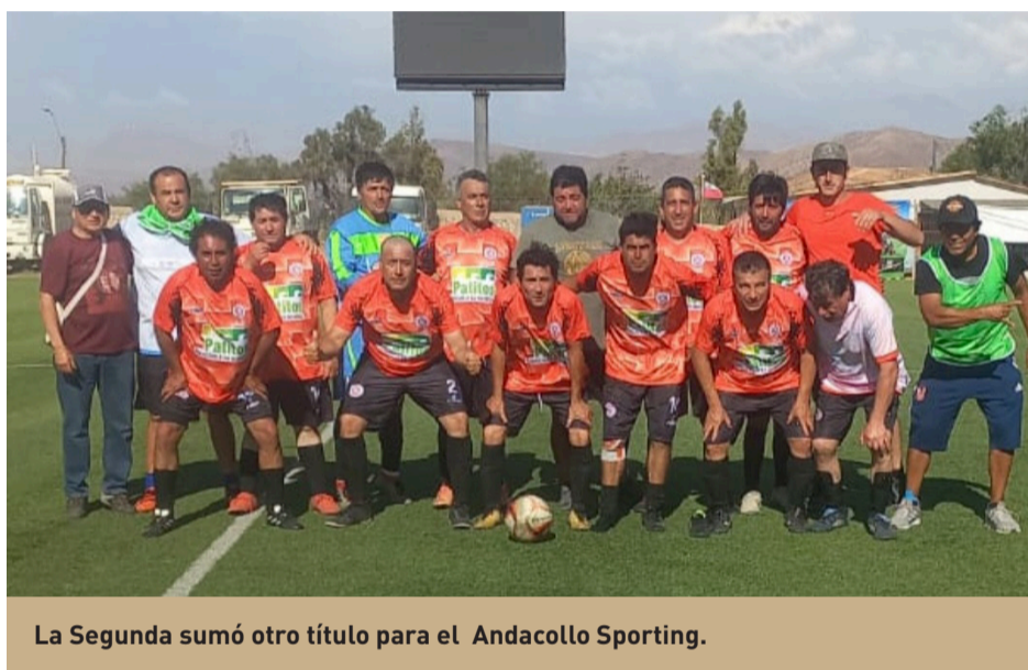
La Segunda sumó otro título para el Andacollo Sporting.

En lo relacionado a los lamentos, eso tiene que ver con el alto costo que significa jugar. Se debe pagar la cancha, árbitros, lavado de camisetas, luz, agua. "Sale carísimo", dicen. Sólo