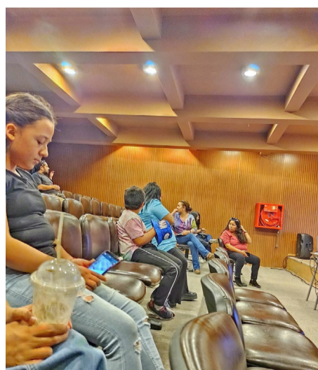
No solo peques llegaron a los talleres de astronomía básica.