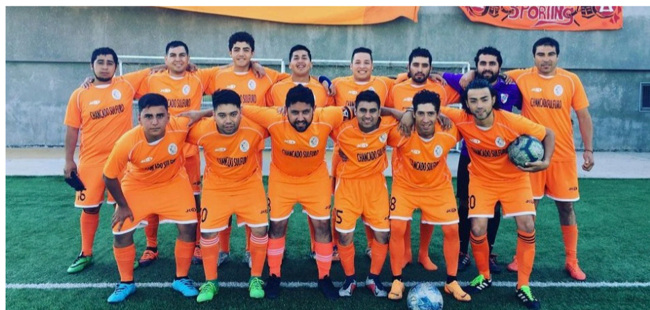
Nadie es mejor que todos juntos. Es el lema que destaca al Andacollo Sporting.