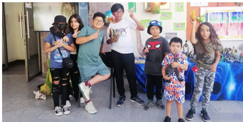
Los niños también participaron de una exposición sobre la extinción de los dinosaurios.