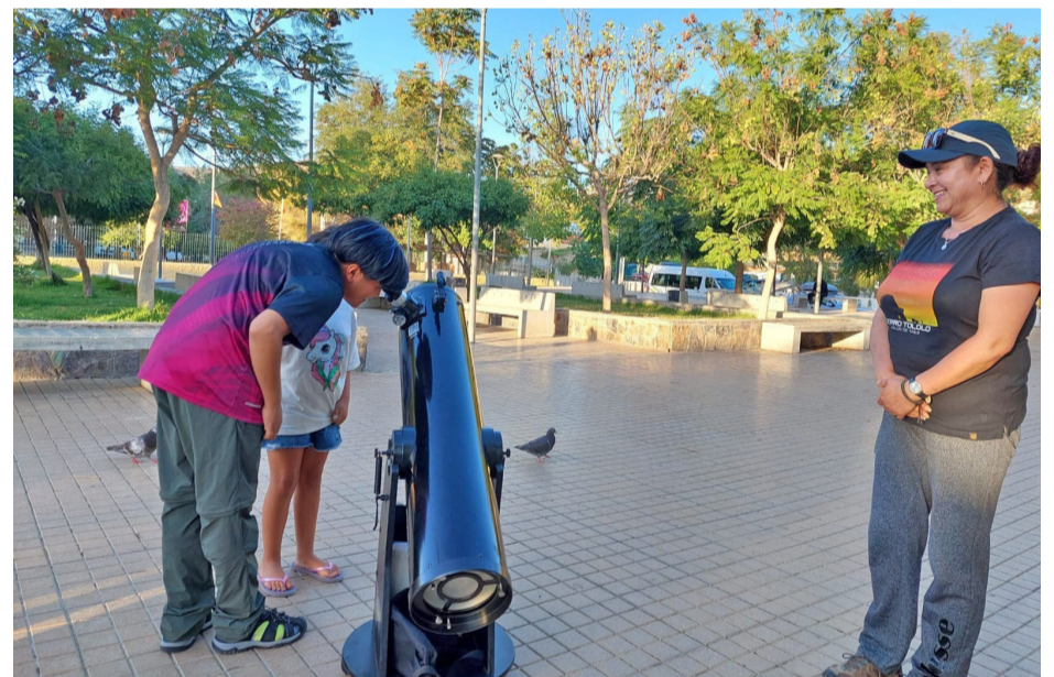
Si bien los talleres estaban dedicados a los niños y jóvenes, los adultos también aprovecharon de aprender algo del universo.