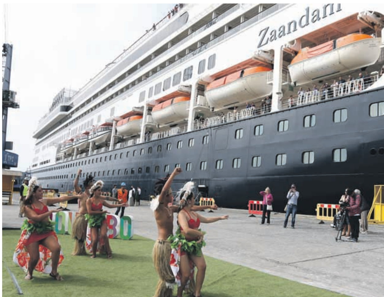
La última de estas naves fue el Zaandam, que zarpó la tarde de ayer con 1.400 pasajeros y 600 tripulantes.