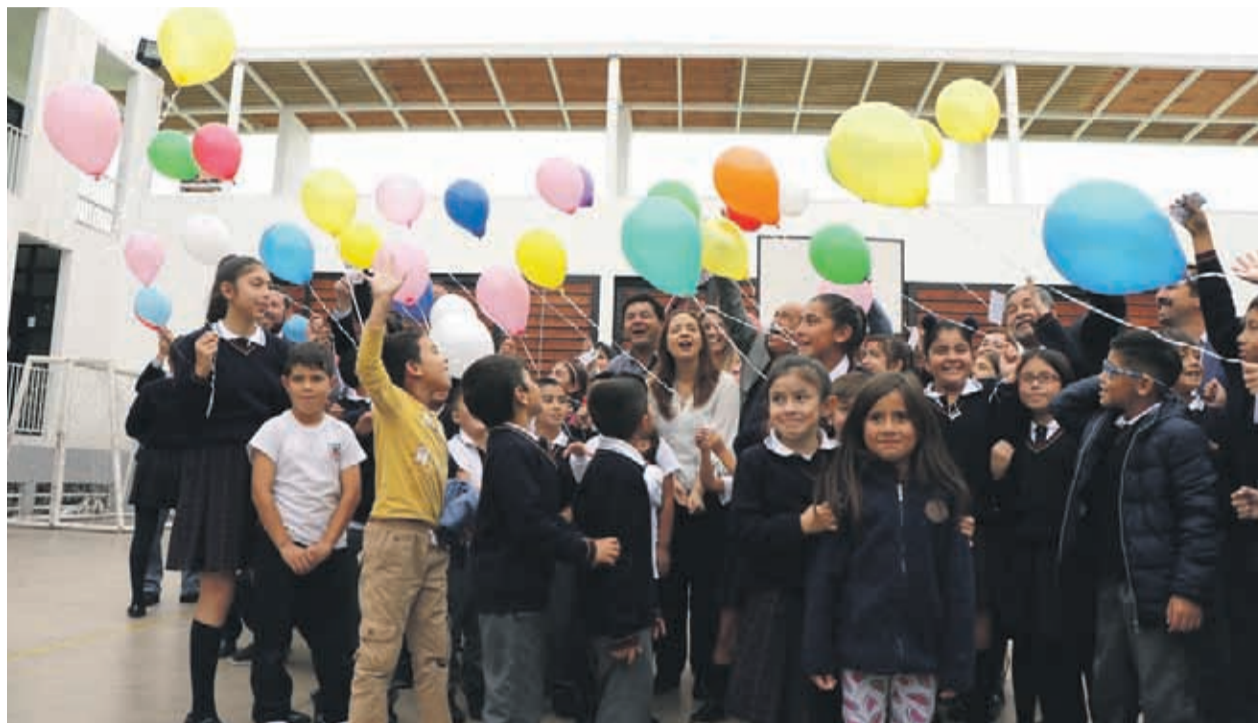
La nueva oficina se enfocará en la labor preventiva para evitar que se vulneren los derechos de los niños.

Según explicó Bown, el nuevo organismo viene a fortalecer el sistema y a com-