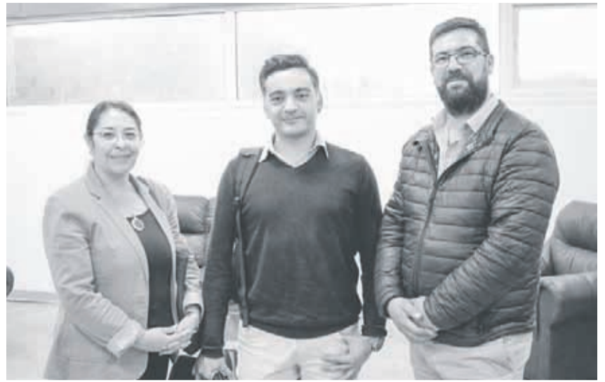
Asistentes a la jornada.

En la jornada se realizó la presentación de los programas de formación continua del magíster en Gestión de Negocios MBA y el magíster en Dirección y Gestión Pública. La actividad finalizó con un "cheese and wine" en donde los asistentes pudieron compartir sus inquietudes sobre ambos programas de postgrado que imparte la universidad.