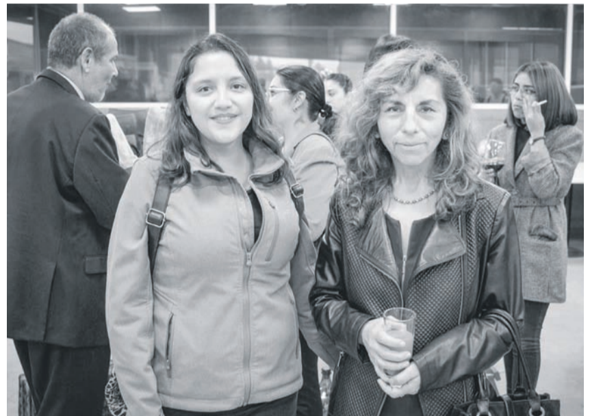
Asistentes a la jornada.