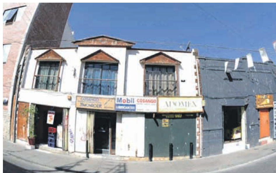
En el contexto de la huida habrían dejado un vehículo incendiado en la Parte Alta. ANDREA CANTILLANES

“Esos sujetos fueron formalizados en el día de hoy por haber participado en la interposición de una especie de barricada para que los sujetos que huían del local no fueran detenidos por Carabineros. Sin embargo, estamos viendo si tuvieron algún tipo de intervención antes de ese hecho. Son formalizados como autores de robo con intimidación, porque si bien no entraron al local propiamente