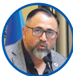
Víctor Pino DIPUTADO

En esa línea, aseguró que “tenemos que seguir trabajando por un control más adecuado de nuestras fronteras, sin duda, para evitar la migración ilegal. Hay diversos mecanismos, y hoy día se están implementando