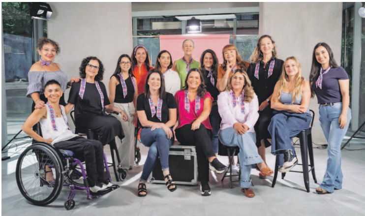
La Fundación Mujer Impacta, como dice su nombre, busca reconocer el liderazgo que las mujeres ejercen en su entorno.

Las postulaciones deben estar alineadas con alguna de las diez causas por las que trabaja Mujer Impacta que