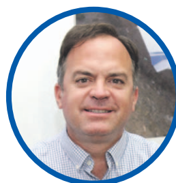
Matías Walker SENADOR

“Creemos que lo relevante es, de una vez por todas, realizar controles fronterizos eficientes; terminar con incentivos sociales a inmigrantes que ingresen al país y establecer convenios”