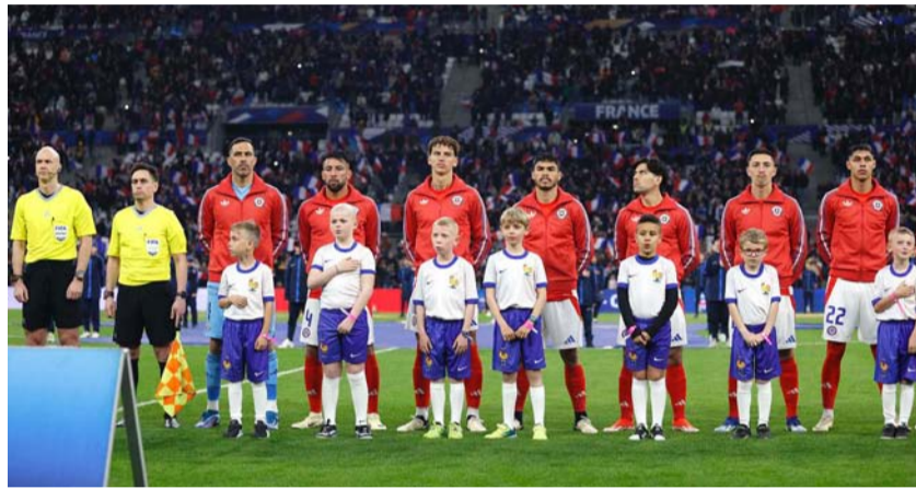
Chile viene del amistoso con Francia en lo que fue uno de los primeros encuentros de Gareca al mando de la Roja.

Si bien el delantero que viene de ganar el Scudetto con el Inter de Milán en el Calcio, recién se incorporará hoy al trabajo de Chile en Juan Pinto Durán, es uno de los emblemáticos del deté argentino para preparar el amistoso de la próxima semana.