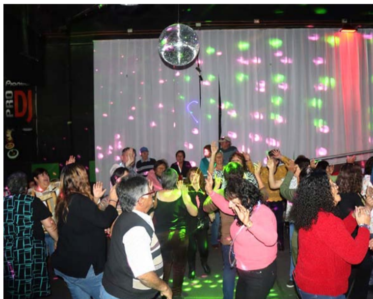
Los asistentes a la actividad pudieron pasar un rato agradable de baile y diversión.