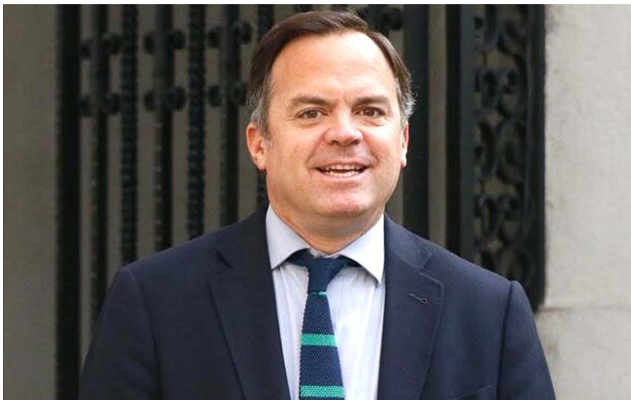
El senador Matías Walker se opuso a que se quitaran las publicaciones electorales de medios escritos con motivo de la celebración de elecciones.

Fue en el marco de la discusión del proyecto de ley para extender las próximas elecciones de alcaldes, concejales y gobernadores regionales a dos días, en la que los miembros de la comisión de Hacienda de la Cámara Alta desestimaron la propuesta que buscaba que los nóminas de vocales, candidatos y facsímiles, se publicaran sólo de manera digital, en la página web del SERVEL.