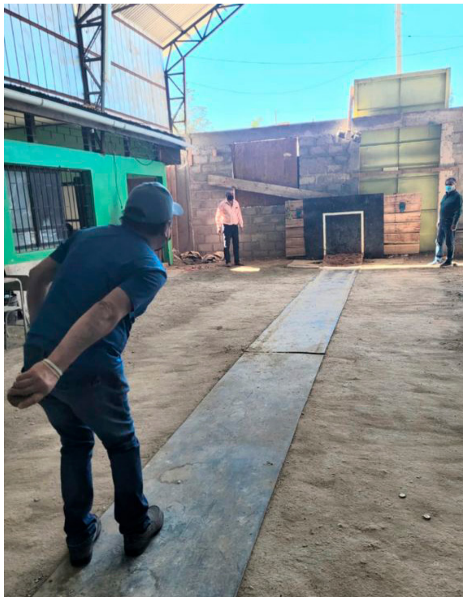
Desde 14 metros hay que apuntarle a una lienza que está en un cajón con greda de 80x80 cm.