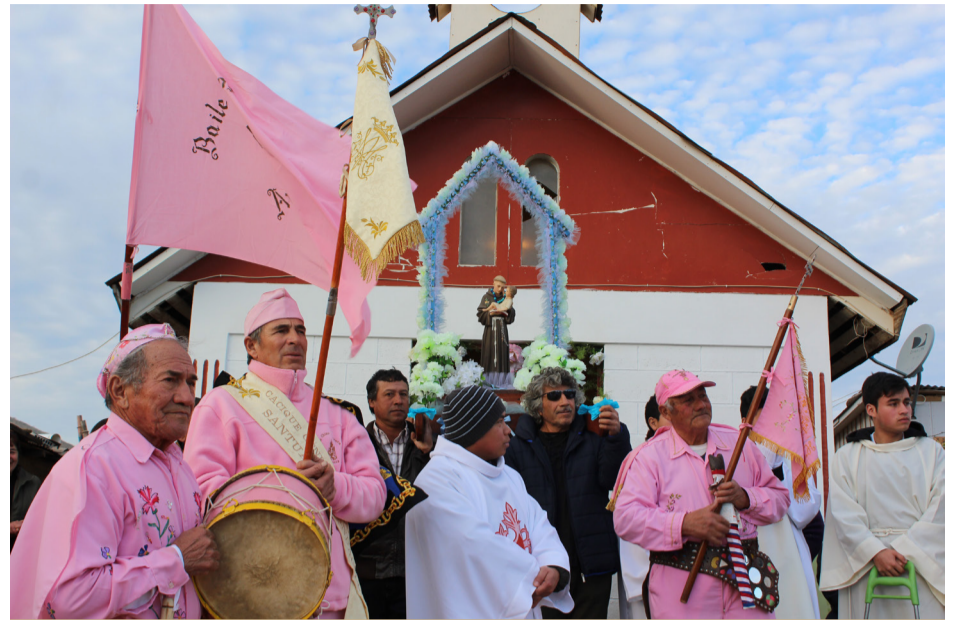
La fiesta patronal de San Antonio de Padua.