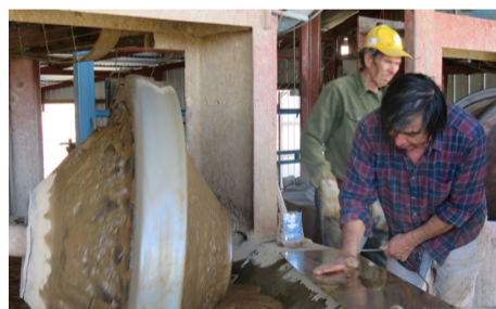
El Trapiche Los Caletones atrae a los turistas.

recicladas, aptas para el riego. Dice que han realizado un trabajo más eficiente, al manejar menos ganado, pero con mejor producción y eso se debe a que tenemos cabras y chivatos euronubia. Además, la crianza de llamas la utilizamos para la carne, porque acá la lana no se utiliza”.