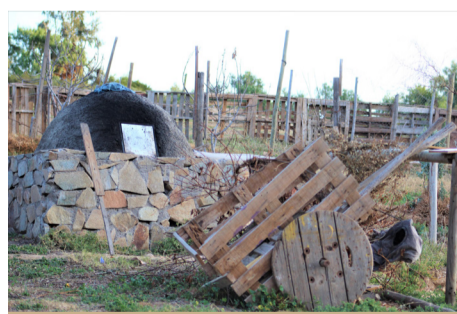
Lo rural se aprecia cada rincón del poblado.