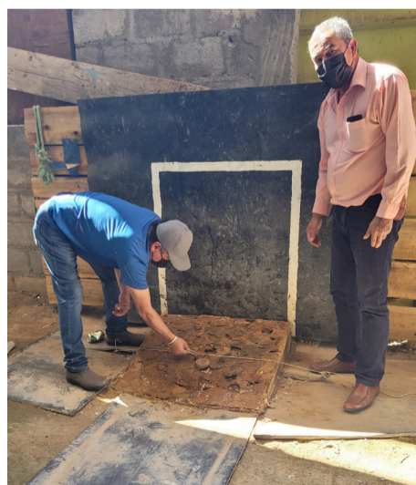
Los socios del Deportivo Barrio Martínez arreglando la cancha para cuando termine la pandemia.

Destaca la labor del "anotador", el hombre encargado del registro ya que el que suma 12 puntos gana; y es el "marcador", quien se lleva los peores epítetos, pues es quien dirime con una pinza que tejos cayeron más cerca de la lienza.