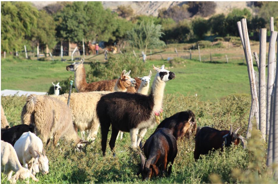
Se destaca la crianza de llamas en el sector.