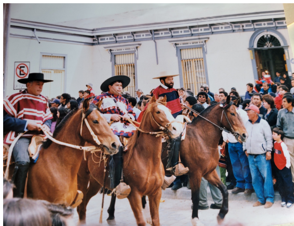
El desfile del Club de Huasos se mantendrá en el tiempo.

El Club de Huasos es una gran obra, enfatiza y destaca la media luna, la hera para la trilla, una explanada para bailar con un escenario para los grupos folclórico, además de la pista de carrera en sector de El Limar.