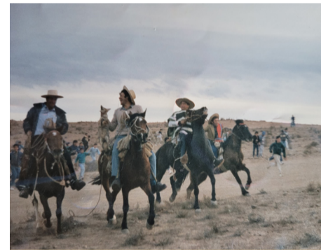
La persecución de los zorros es una tradición que se perdió.

Y la obra debe continuar con una entrada y baños con acceso universal para las personas en situación de discapacidad, y en el entorno del edificio hacer corredores, como las casas de campo. “Ese trabajo está pendiente”, señala. Y en tono de reflexión, dice: “Qué pasará cuando ya no estemos los viejos, porque no veo jóvenes que se entusiasmen con el edificio y las tradiciones”.