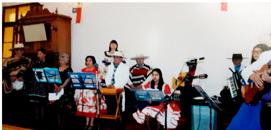
En uno de sus tantos eventos folclóricos.