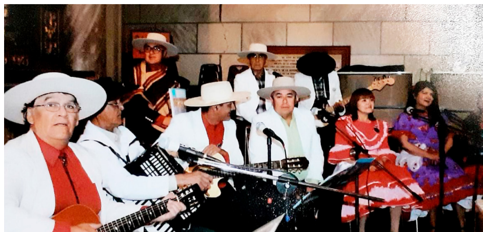
Once son los integrantes de la agrupación Huaso González.

Cuentan con 2 producciones y preparan un tercer CD con 30 temas inéditos