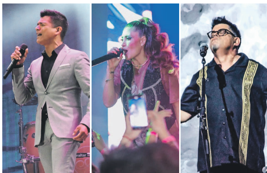
Ya se comienza a configurar la parrilla artística de la Pampilla de Coquimbo.

En tanto, la ex chica "Mekano" se adelantó al anuncio oficial y expresó su emoción en entrevista con FM2, señalando que "estoy muy feliz de estar ahí, yo lo pedí hace mucho tiempo al universo".