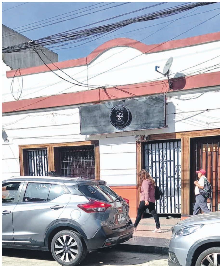
Desde el municipio aseguraron que, de no cumplir con la normativa correspondiente, varios locales podrían ser clausurados.

"No hay vuelta atrás. Se han dado todas las oportunidades, así que se está estudiando (la situación de esos locales) en Jurídico y Dirección de Obras", sostuvo el edil serenense. Y si bien lo más seguro es que los locales sancionados apelen al municipio según reconoce el edil, dicha apelación debe ser estudiada en el departamento jurídico para luego, estudiar si se revoca la medida o no. "No voy a decir los locales que están