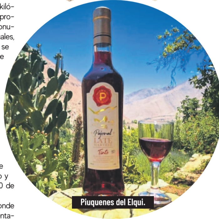
Piuquenes del Elqui.

ha impactado a la industria chilena y mundial, batiendo récords en su tercer año de vinificación y su primer Wines of Chile al obtener 4 medallas de oro por su Syrah, además de ganar en una cata a ciegas en Londres como el mejor Malbec del Nuevo Mundo y el año 2015 en el WOC, su Carmenere Pedriscal fue elegido como el mejor de Chile, venciendo al dueño de casa,