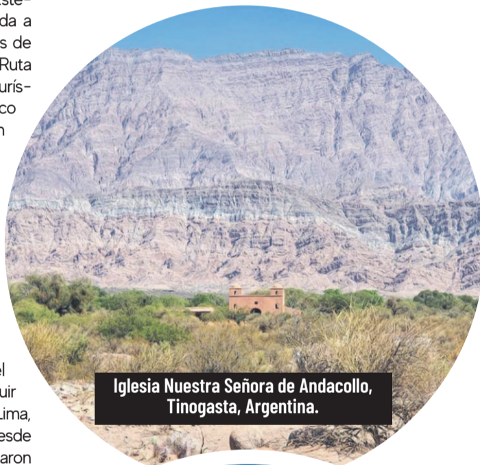
Iglesia Nuestra Señora de Andacollo, Tinogasta, Argentina.

El primer tramo La Serena - Valle del Elqui donde comienza la ruta lo componen tres sitios elementales para el patrimonio y la industria vitivinícola del país, empezando por Viña Falernia, creada por Aldo Olivier y Giorgio Flesatti, la cual se inspira en la fama alcanzada por los más apetecidos vinos de la antigua Roma, el primer grand cru del mundo, los vinos de Falerno, cuyo renombre fue difundido por emperadores, generales, poetas, escritores e historiadores, entre ellos Plinio el Viejo. Es así como Viña Falernia desde sus orígenes