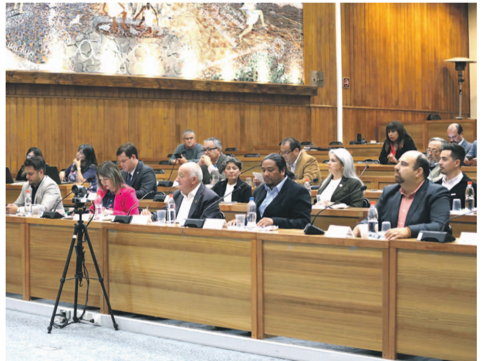
El próximo gobernador saldrá de entre los 16 consejeros regionales y hasta el momento, no se han dado conversaciones para ir definiendo quién podría ser la nueva autoridad.