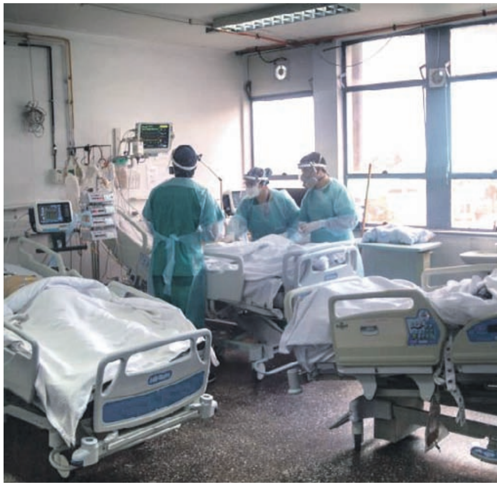
El 30 de octubre sería la fecha de cierre del Hospital de Contingencia de Ovalle.