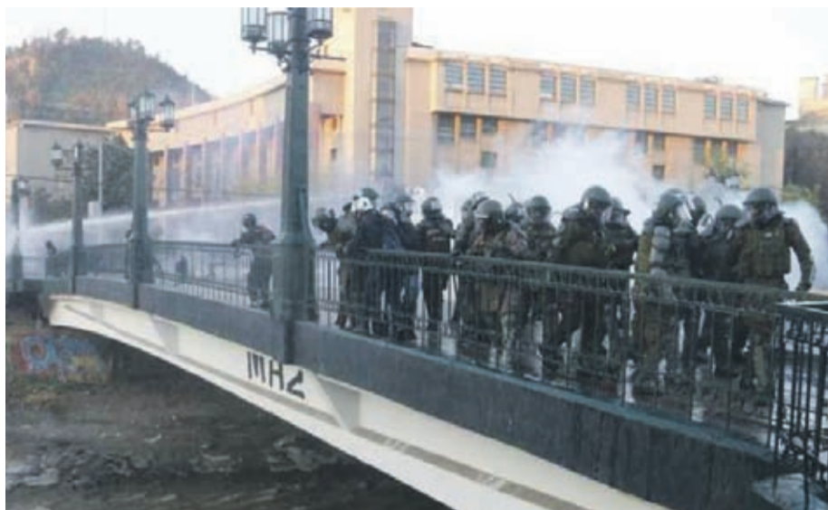
Un funcionario de Carabineros es acusado de provocar la caída de un adolescente al río Mapocho desde el puente Pío Nono, tras manifestación en la capital.

El organismo indicó que es “preocupante” la omisión de asistencia por parte del funcionario a la víctima. Además recalca que “no es un hecho excepcional”, recordando los otros casos de violaciones a los derechos humanos por parte de las fuerzas de orden en el marco de las protestas.