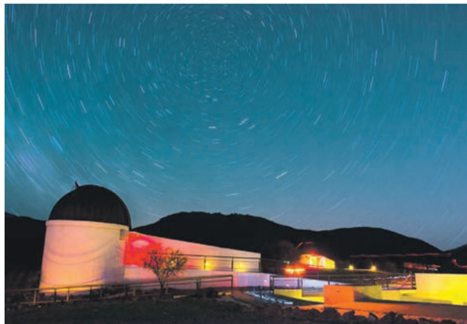
El observatorio Cruz del Sur, en Combarbalá, es uno de los centros que pertenece a la red astroturística regional.