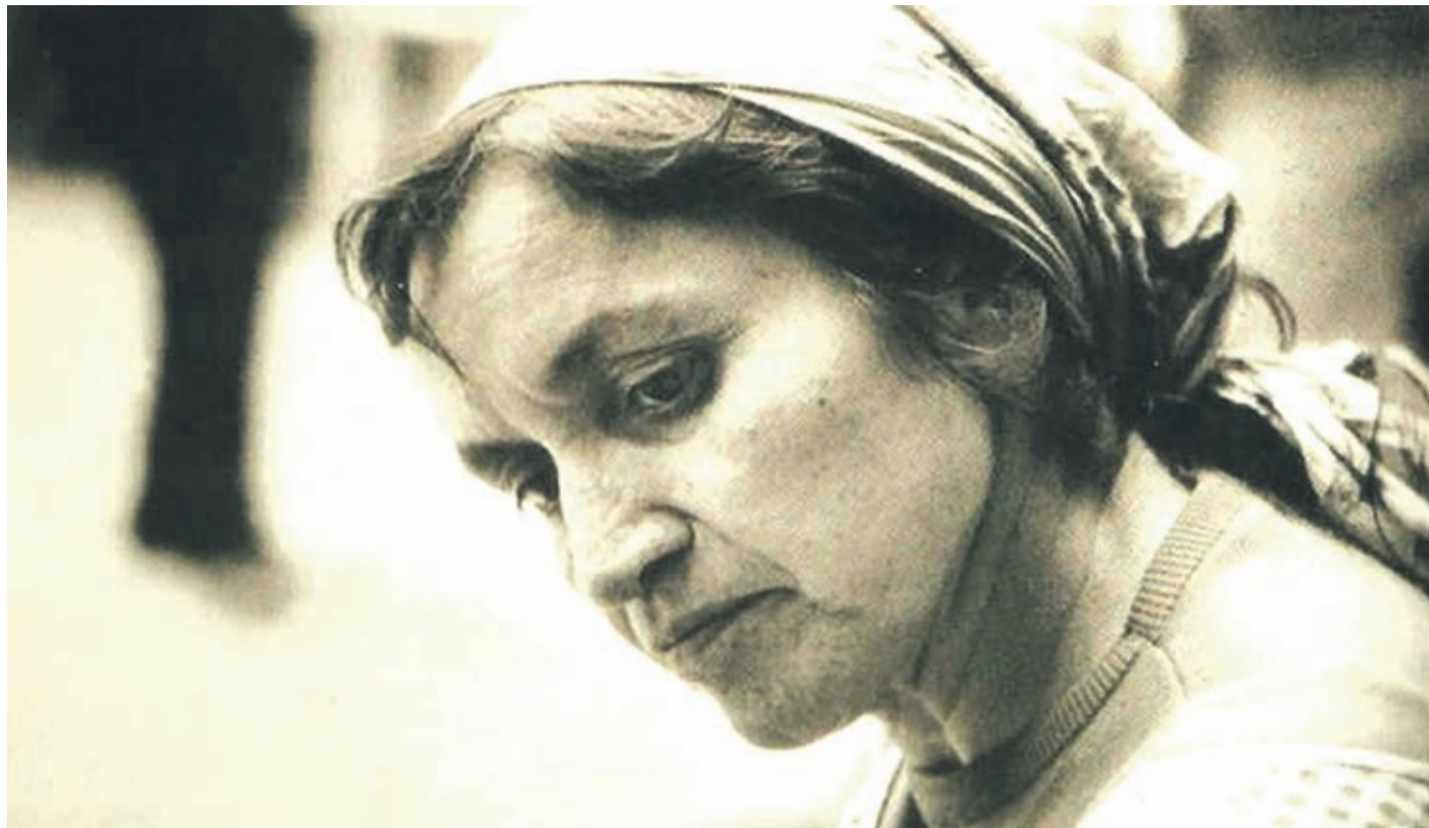
La chilena fue una artista integral que dejó un importante legado, no solo como compositora, sino también como poetisa, pensadora, pintora y escultora. REFERENCIAL