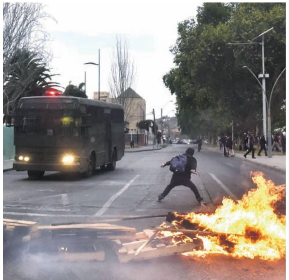
Los manifestantes cortaron el tránsito en Pedro Pablo Muñoz con barricadas. ALEJANDRO PIZARRO

En la región, la convocatoria se realizó en la Plaza Buenos Aires de La Serena y en la Plaza Las Américas de Coquimbo, hasta donde llegaron alrededor de 70 personas. A eso de las 18:00 horas, se