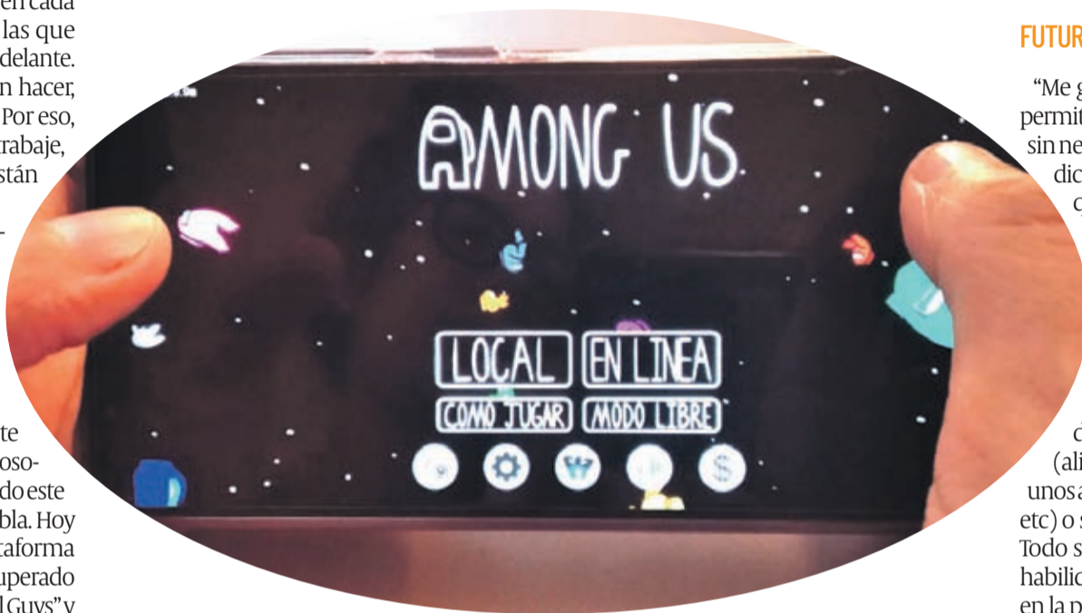
Un jugador iniciando una partida de "Among Us".

El videojuego "Among Us", que ha adquirido fama mundial gracias a influyentes "youtubers", se ha vuelto un fenómeno viral, líder en ventas, y ha cosechado millones de descargas en todo el mundo.