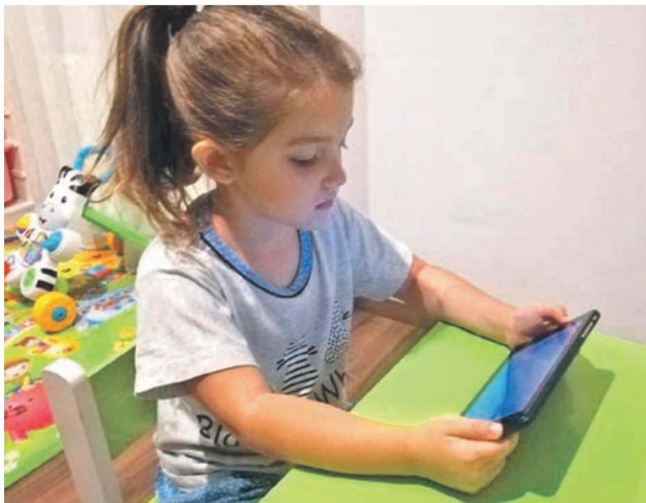
Algunos estudios publicados en revistas científicas sugieren que el uso excesivo de las pantallas en menores podría lastrar su desarrollo cognitivo.

El uso excesivo de dispositivos con pantalla por parte de los niños se acentuó durante la pandemia debido a las cuarentenas, confinamientos y restricciones de desplazamientos que obligan a las familias a permanecer más tiempo en casa, pero el problema viene de antes, señalan los expertos, quienes explican cómo remediarlo.