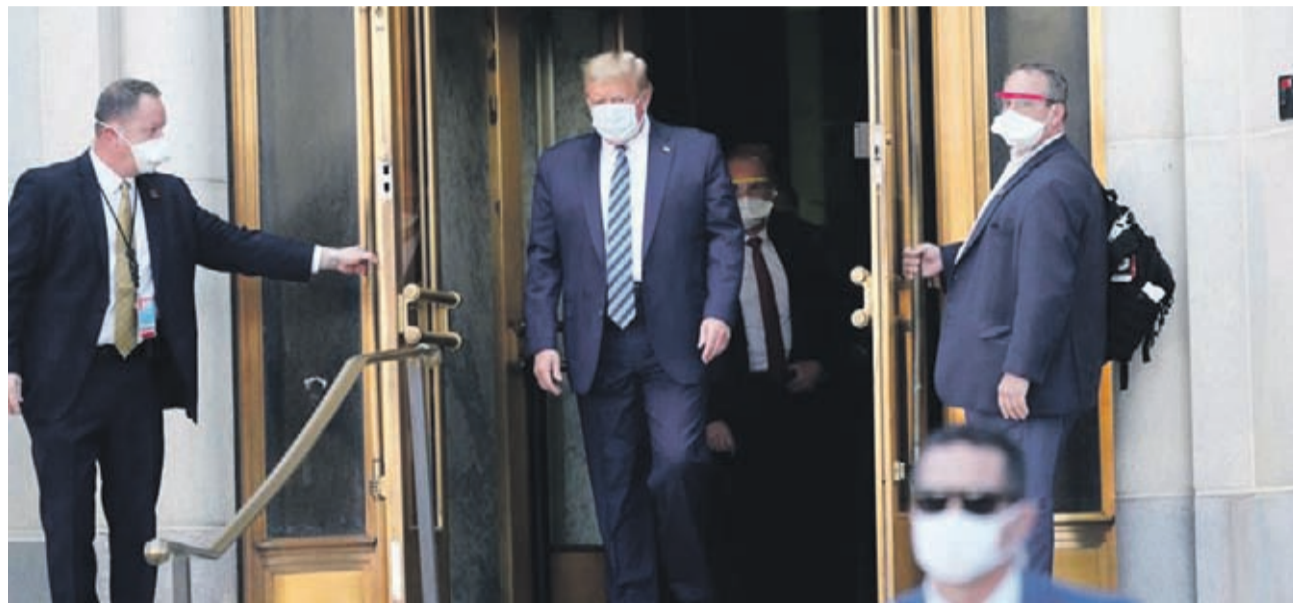
El Presidente de Estados Unidos, Donald Trump, saliendo del hospital militar Walter Reed este lunes, tras ser internado el viernes por contagio de Covid-19.