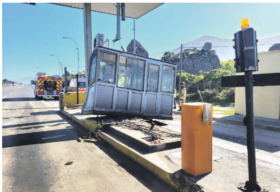
Producto del impacto de la carga que transportaba el camión sobre la caseta de peaje, la estructura de ésta última resultó gravemente dañada.

Además, se detalló que el detenido mantenía cinco antecedentes por lesiones menos graves y falsificación de licencia de conducir.