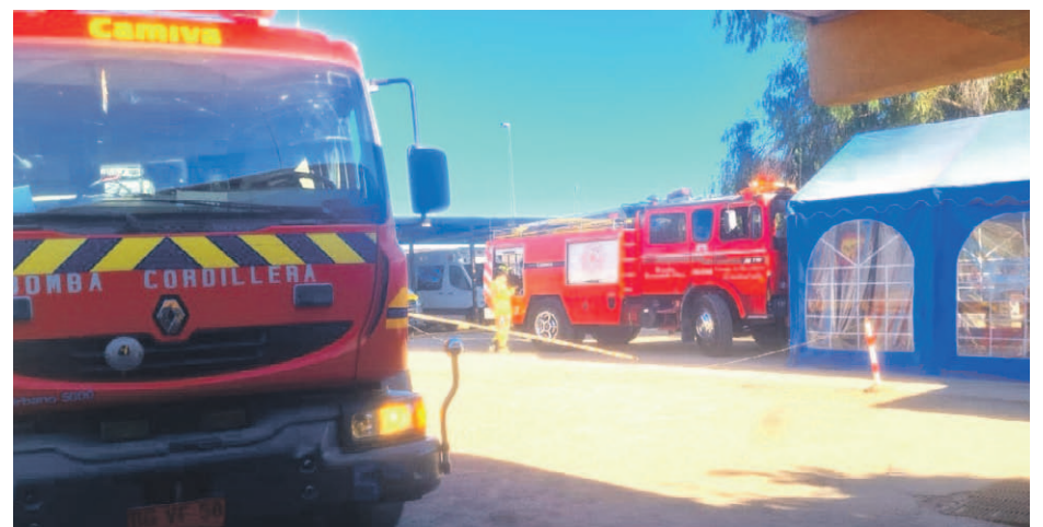
Bomberos concurrió al hospital de Combarbalá por una emanación de gas, cuyo origen resultó desconocido.

De esta manera, el recinto fue evacuado completamente según lo indicó el director del Hospital de Combarbalá,