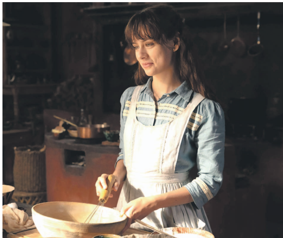
La actriz Azul Guaita es quien encarnará a Tita de la Garza.

El enorme éxito de la primera novela de la escritora mexicana Laura Esquivel, publicada en 1989, la convirtió en una de las más importantes revelaciones literarias latinoamericanas. Traducida a más de 30 idiomas, “Como agua para chocolate” encabezó las listas de “best sellers” más prestigiosas del mundo, incluida su reseña publicada durante más de un año ininterrumpido en el New York Times, como uno de los libros más vendidos.