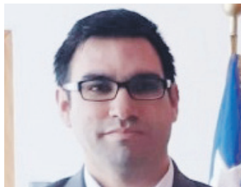
CARLOS LILLO SEREMI DE ECONOMÍA

Conocemos la gran fuerza emprendedora que existe en nuestra región y, es por eso, que como cartera de economía realizamos un arduo trabajo en el año 2019 para formalizar a las empresas que estaban trabajando de manera informal.