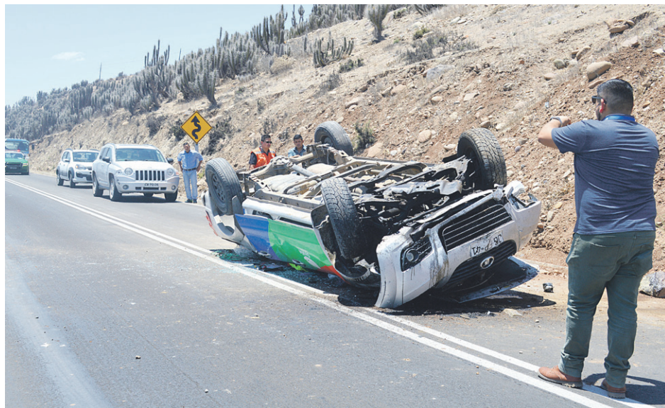
La camioneta de la contratista que presta servicios para la Municipalidad volcó en la vía al pueblo de Limarí

Pasadas las 13.00 horas de ayer martes, una camioneta adscrita a la municipalidad dio vuelta en el sector curvas de La Silleta. El conductor, que viajaba solo, salió por sus propios medios del vehículo.