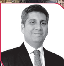
CLAUDIO IBÁÑEZ Ex intendente regional. (PPD)