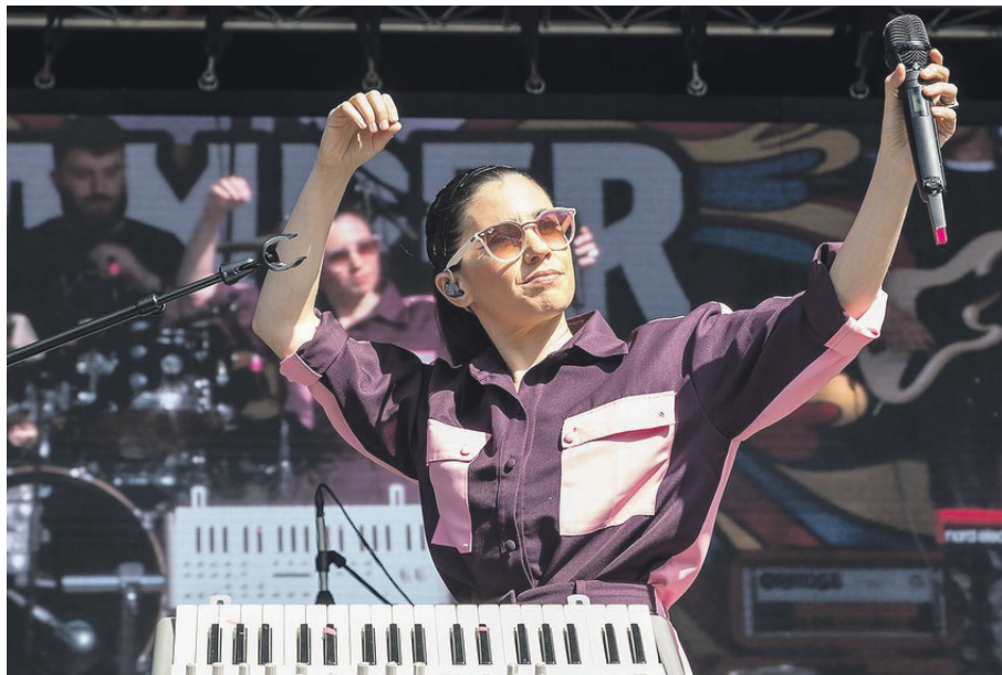
La joven que fue parte del Festival de Viña del Mar 2016 interpretará éxitos como "Espada", "Luz de piedra de luna", "Acá entera", "Cámara lenta", entre otros.

Pero la jornada no será solo música, ya que también habrá un boulevard de emprendedores locales, quienes comercializarán y exhibirán sus productos como libros, diseños e ilustra-