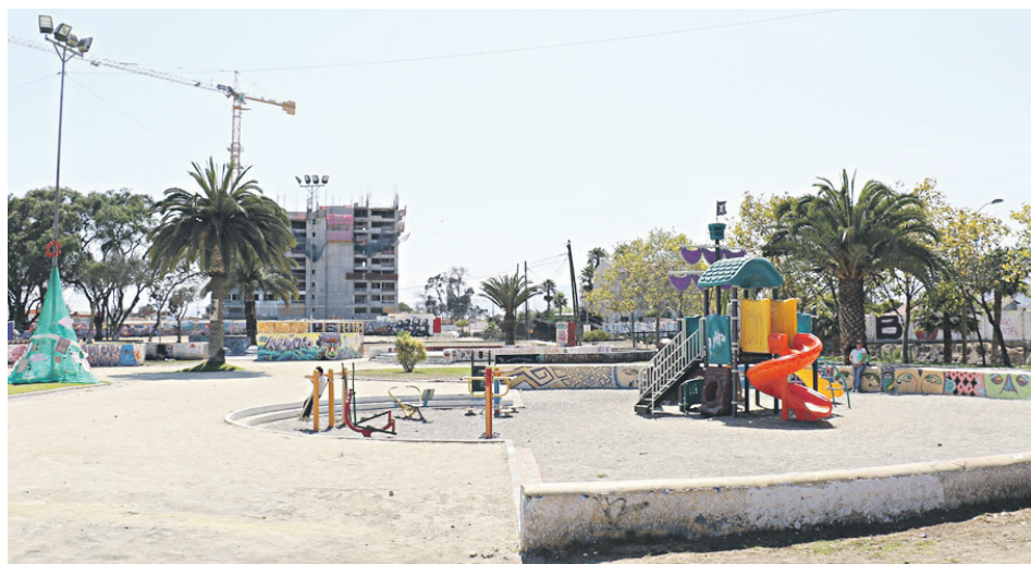
La Plaza de Las Américas en Coquimbo.