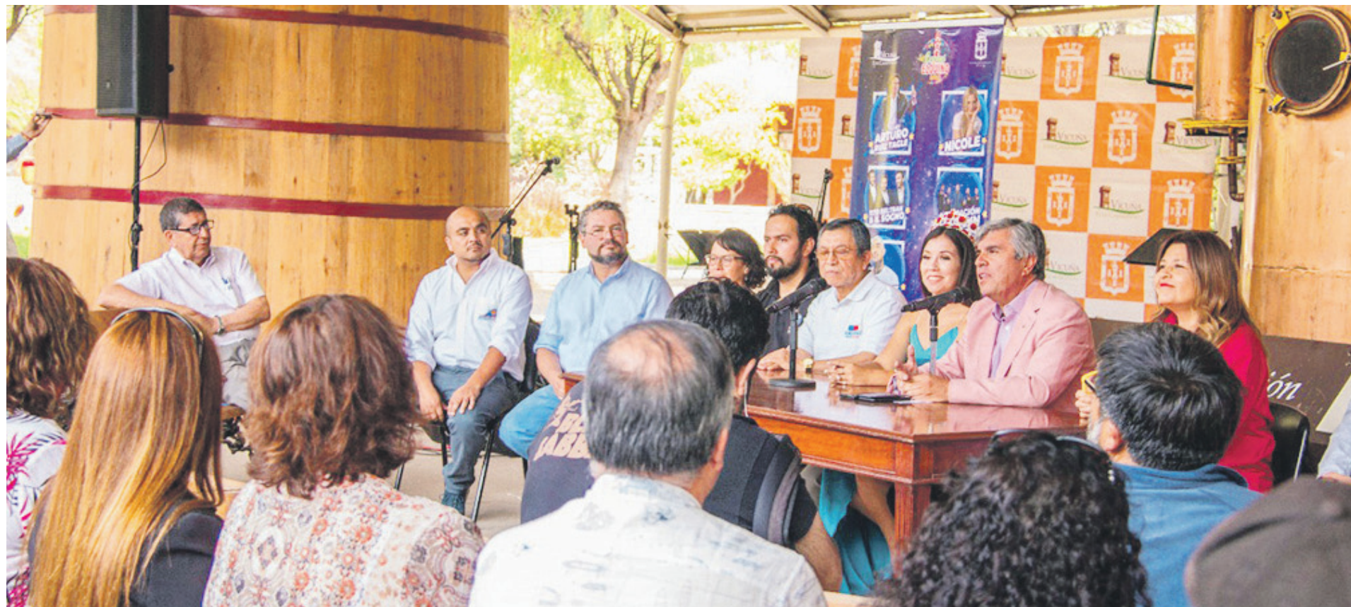
El alcalde de la comuna elquina dio el vamos a una nutrida agenda de actividades.