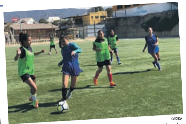
Sobre el césped de San Juan , en Coquimbo, las aspirantes buscan una oportunidad de vestir la camiseta aurinegra.