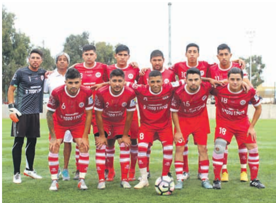
Los Copihues cayó en el Complejo Juan Soldado, pero este domingo tendrán la chance de revertir la serie. RUBÉN ARAYA