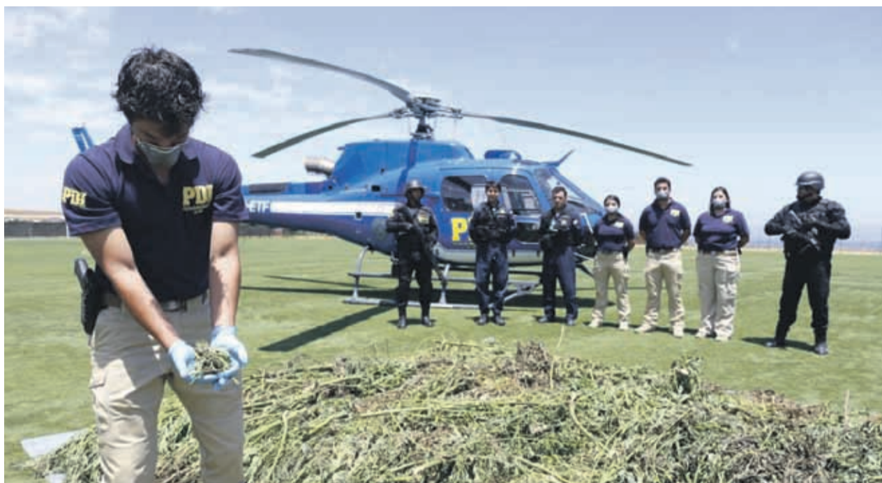
Durante el año 2018 se logró incautar la cantidad de 45.792 plantas en las provincias del Choapa y Limarí a través de esta Plan. El presente año, sólo en los operativos realizados en el mes de enero, los detectives de la Región de Coquimbo han erradicado casi el 80% del total del año pasado.

"El Plan Cannabis 2019 ha sido bastante fructífero, ya que a través de las Brigadas Antinarcoóticos y Contra el Crimen Organizado (BRIANCO) de La Serena y Los Vilos, se han logrado erradicar más de 36 mil plantas en lo que va del mes de enero. El Plan continúa en ejecución, se está trabajando con denuncias