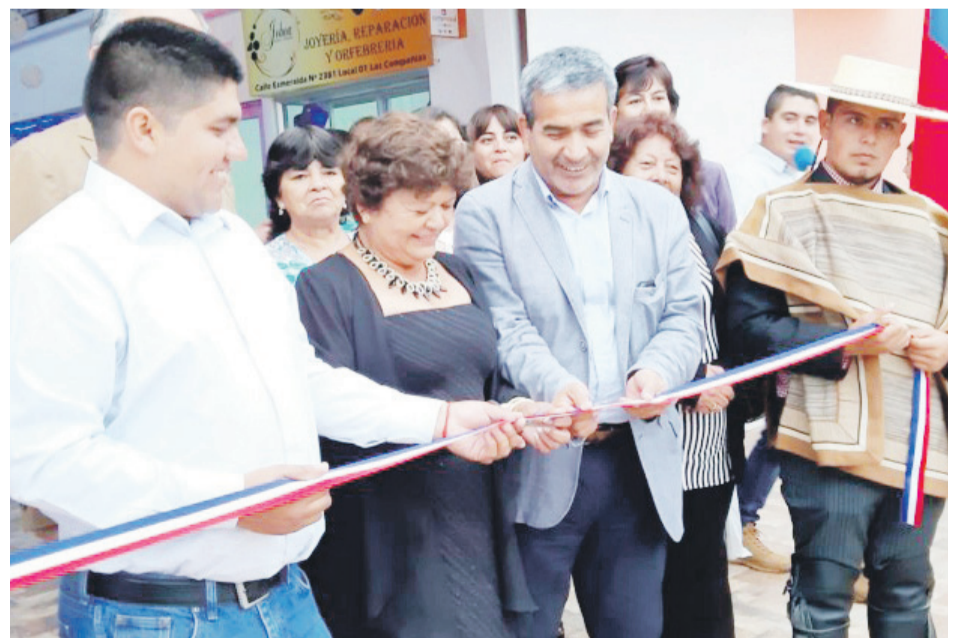
Este lunes, con la presencia de autoridades y vecinos, se inauguró la Galería Esmeralda de las Compañías.

“Queremos solicitar a todos los presentes, divulgar, comentar, conversar entre sus conocidos y familiares, que Las Compañías ya tiene su centro comercial y que no es necesario ir al centro a buscar lo que necesita. Esperamos que pronto otros empresarios se motiven con esta iniciativa y así poder realizar el prestigio de nuestro sector”, concluyeron los locatarios. 62-011