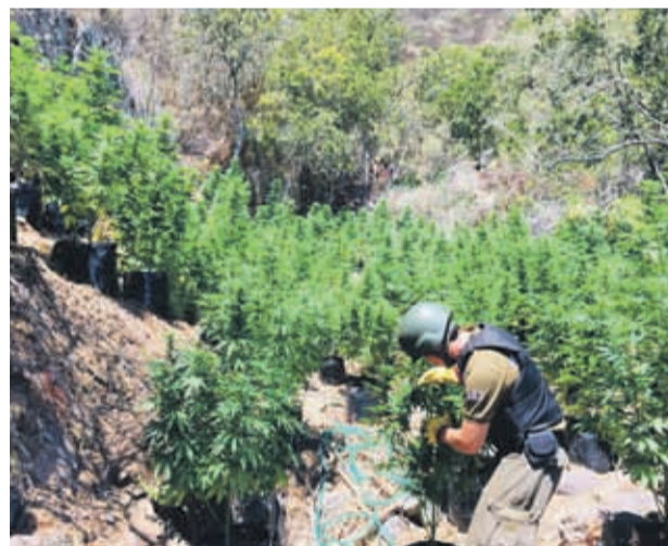
Carabineros encontró, además, campamentos artesanales con armas, municiones y víveres.

los cuales se encontraron 34 cartuchos de escopeta sin percutir, víveres y diferentes elementos utilizados por los sujetos para el resguardo de los plantíos, lo que motivó a los funcionarios policiales a