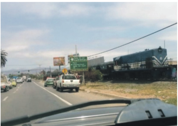
La imagen muestra el sector del accidente a pocos minutos de ocurrido, con el tren detenido.