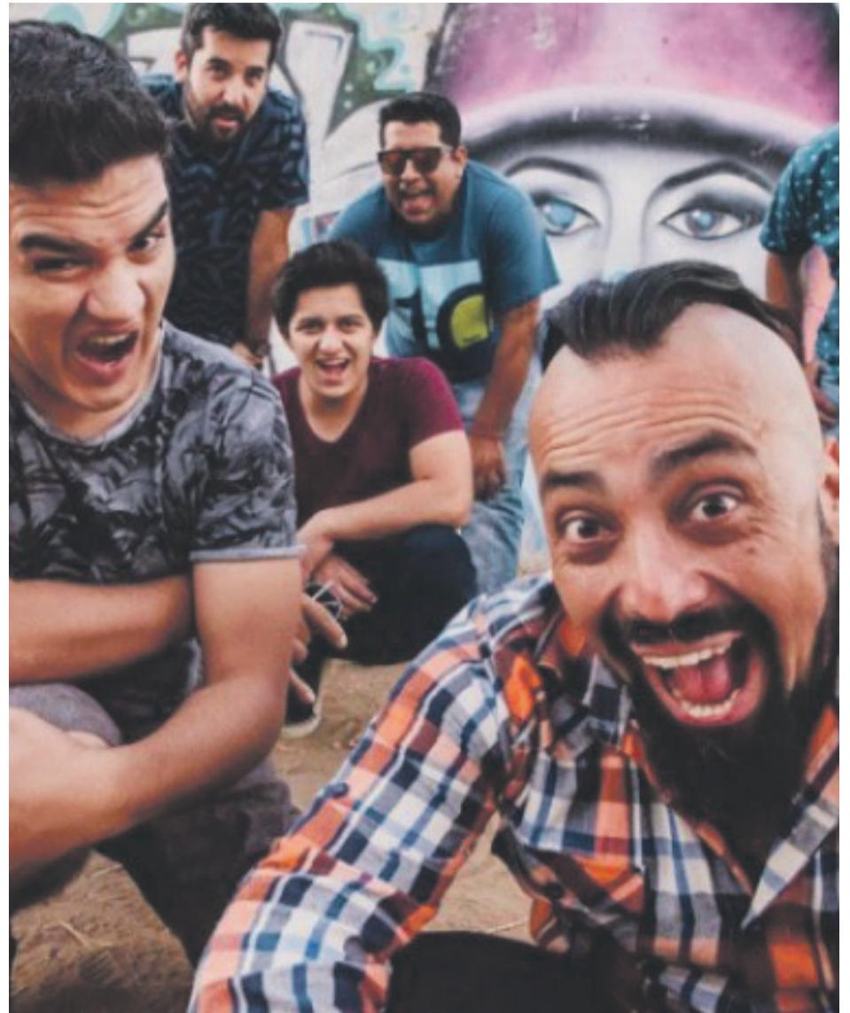
Los Pata Negra llegarán con toda la pachanga a hacer bailar a todos los asistentes.

Asimismo, habrá comidas gourmet, food trucks, muestra de artesanía y zona de juegos para los más pequeños, quienes podrán ingresar gratis en compañía de un adulto. Las entradas pueden ser adquiridas a través del sistema Ticket plus, Aki Chip (galería Serena Oriente), Restaurante San Bar y en tiendas Sorella (Balmaceda 545). 6005