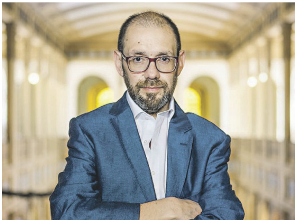
En entrevista exclusiva nos habla del panorama literario chileno, de contingencia y sus proyectos.

“Son dos tomos, la reedición de 1899 que es del 2011 y que originalmente fue presentada en la Feria del Libro de La Serena y la actual, que es su secuela 1959. En la presentación