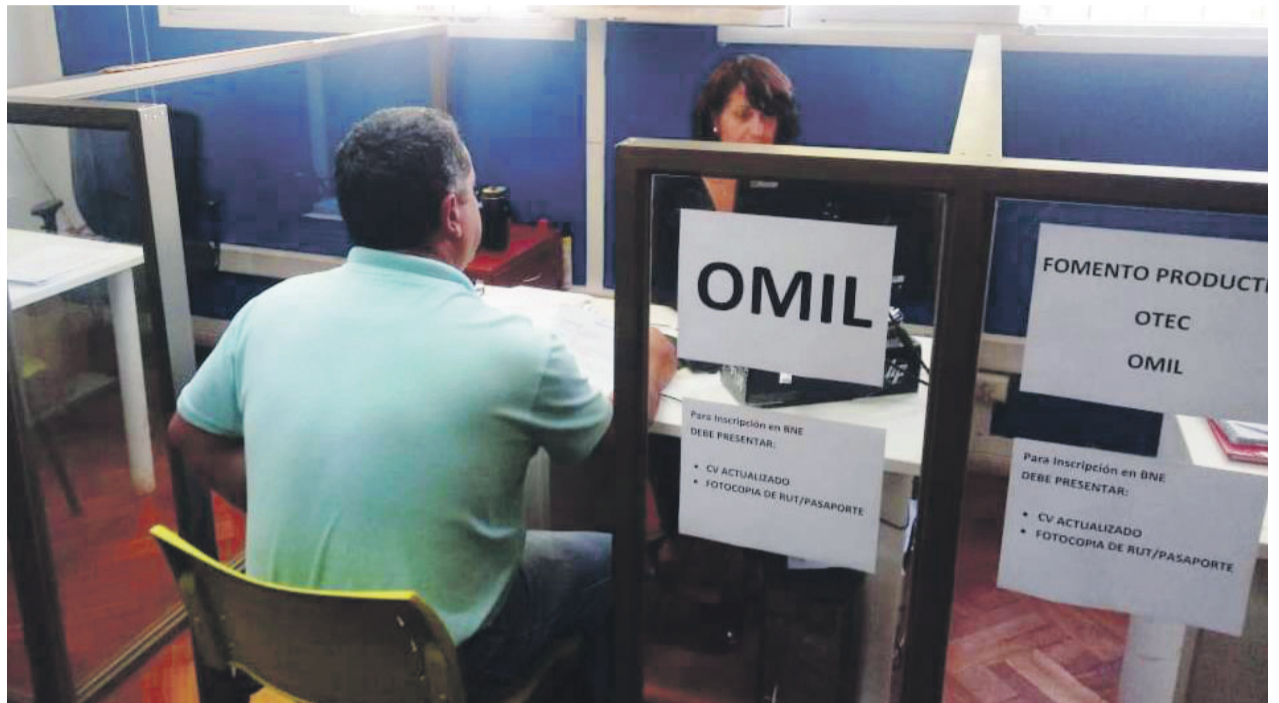
El municipio, en alianza con Compas Group que presta servicios a Codelco, abrió 40 puestos de trabajo para personas de La Serena.

gestión en conjunto con el Sence. Ahí se hace un proceso de reclutamiento en base a los antecedentes que ya están disponibles en la OMIL. “En términos numéricos, este es el primer gran grupo que es contratado por una empresa y que van a prestar servicios específicamente en la mine-