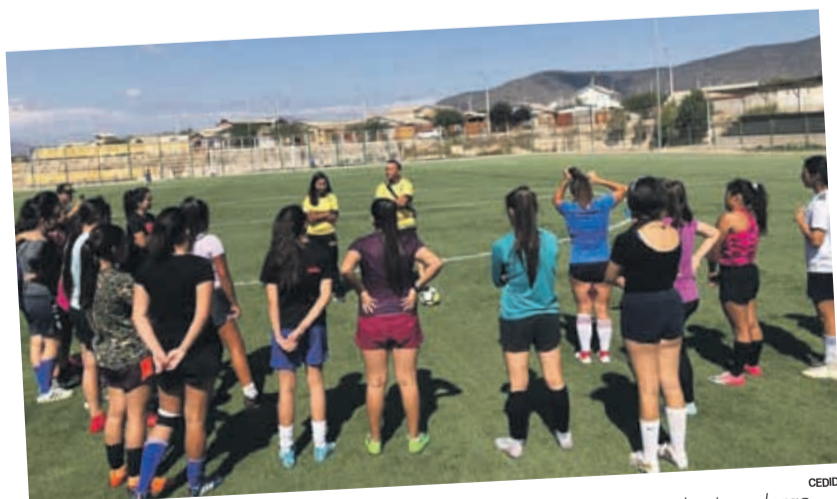
LAS CONVOCATORIAS han sido masivas y de alto interés entre las jugadoras.