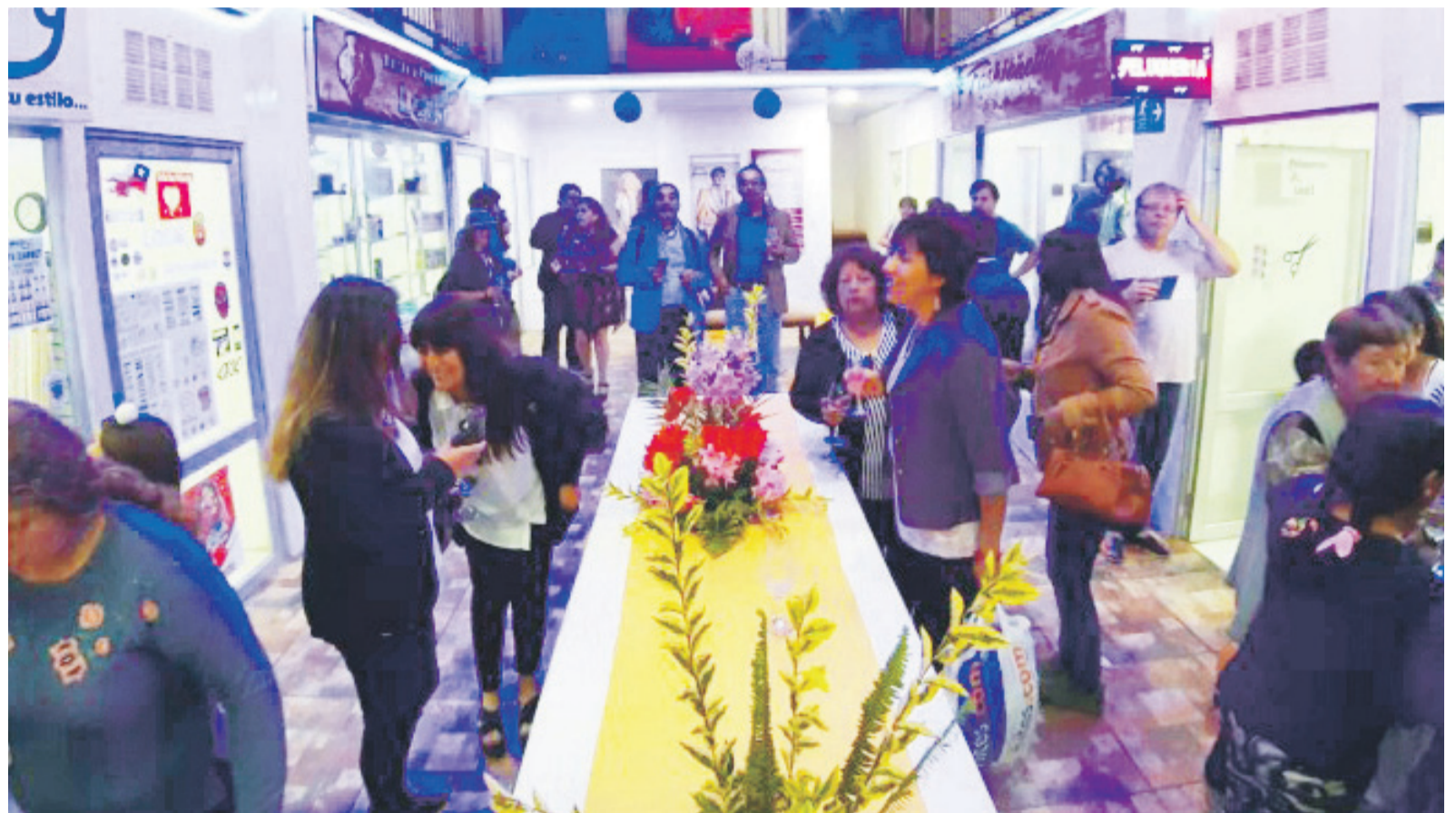
Entre la oferta de productos y servicios se cuentan peluquerías, boutiques, paqueterías, joyerías y artículos para el hogar.