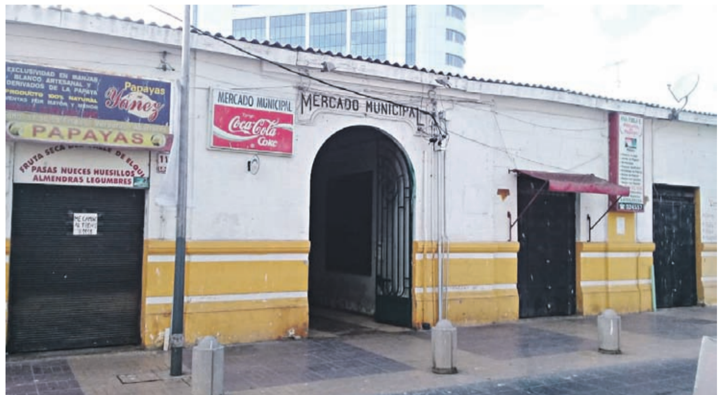
EL MERCADO DE COQUIMBO HA ESTADO EN EL OJO DEL HURACÁN LOS ÚLTIMOS AÑOS, YA QUE ALLÍ SE PRETENDE CONSTRUIR UN MODERNO EDIFICIO Y TRAS VARIOS JUICIOS HAY ÓRDENES DE DESALOJO DE LOS LOCATARIOS.

El recinto lo consideran un patrimonio de la comuna y anunciaron que insistirán en los tribunales y que llegarán hasta la Corte Suprema para evitar que desaparezca. En el lugar una empresa privada pretende construir un moderno edificio de siete pisos con estacionamientos subterráneos.