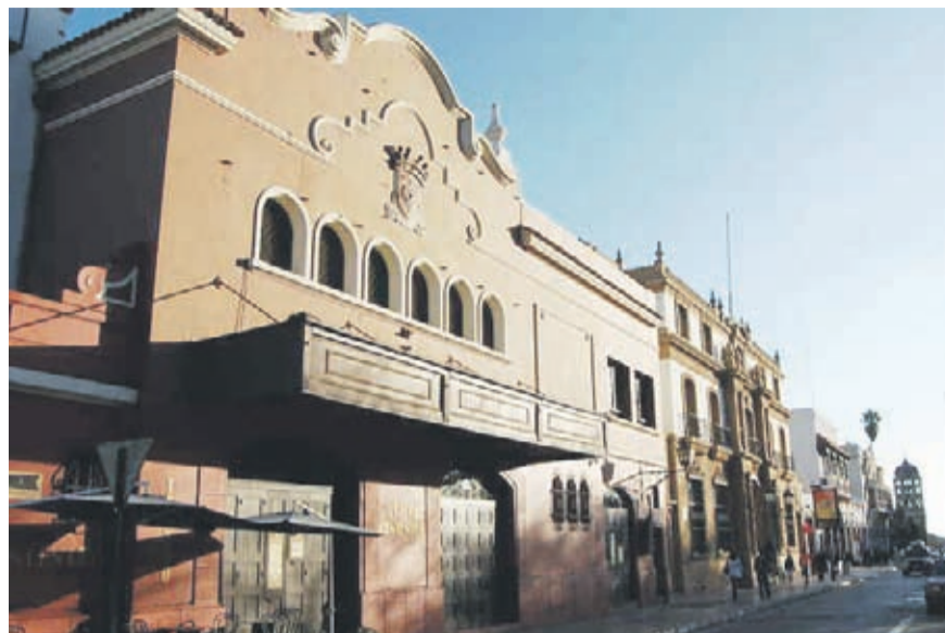
El inmueble ubicado en Los Carrera con Gregorio Cordovés se ha transformado en una verdadera reliquia patrimonial de la ciudad.

En este punto, el arzobispo de la capital regional explicó que el centro cultural no se estaba usando hace mucho tiempo,