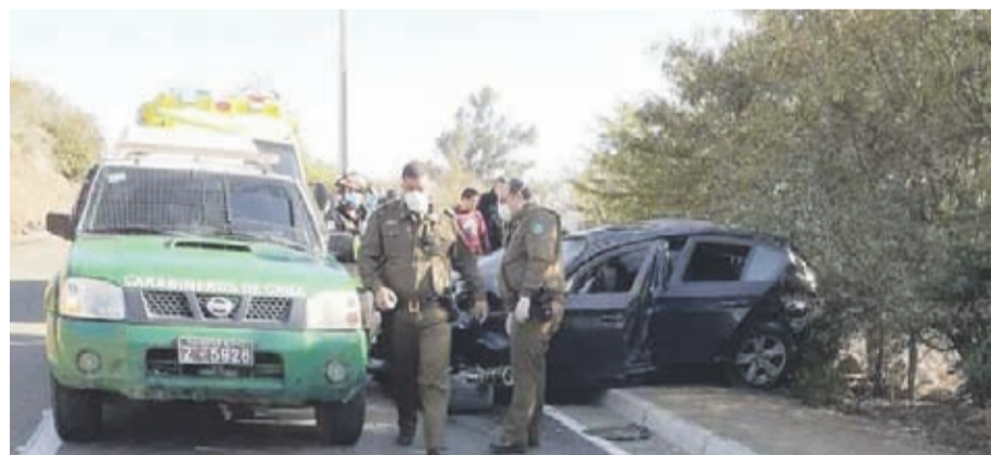
Uno de los jóvenes, de iaproximadamente 29 años, falleció debido a la gravedad de sus lesiones

Unidades de Rescate llegaron al lugar, encontrando a dos de los ocupantes atrapados en el móvil y trasladándolos hasta el hospital de la comuna.