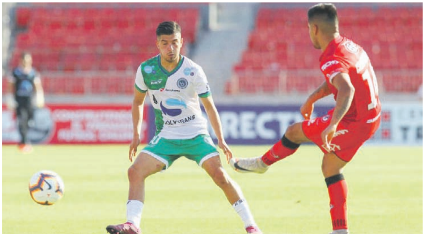
El lateral del elenco chillanejo, quien se encuentra en la zona cumpliendo con el receso en el fútbol profesional, comentó que la medida fue comunicada por la institución que cubrirá la diferencia.

El elenco del Ñuble que milita en la Primera B, se transformó en el primer equipo nacional que se acoge a la Ley de Protección del Empleo y ya notificó a sus jugadores, cuerpo técnico y trabajadores. La suspensión del vínculo con el club será hasta que vuelva la actividad deportiva.