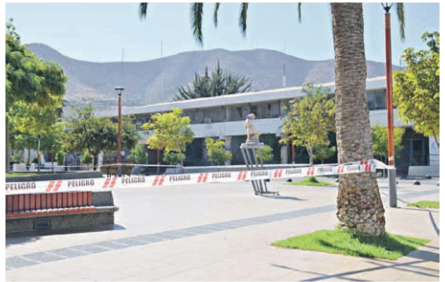
Un cierre perimetral fue instalado en la comuna de Illapel en su Plaza de Armas. Igual medida se repitió en el puerto de Coquimbo en varios puntos de la comuna

contribuir a la campaña “Illapel Unido contra el Coronavirus” y, con ello, resguardar la salud de la comunidad dado el brote de Covid-19 que afecta a la ciudad. La decisión se replicará en otros lugares públicos de Illapel en los próximos días.