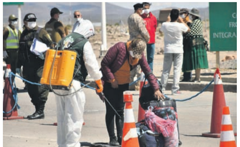
Una ciudadana boliviana se somete al control sanitario para entrar a su país y pasar la cuarentena en un campamento de Pisiga.

El director interino de Migración acusa que quieren “desestabilizar al país” y ahonda en vínculos de afectados con el MAS, partido de Evo Morales.