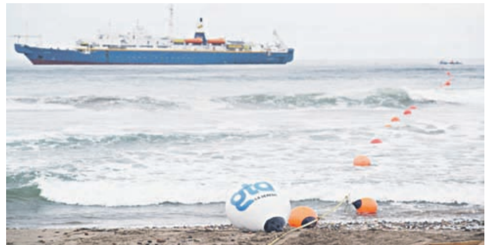
La región de Coquimbo será uno de los 12 puntos de enlace de este megaproyecto.

Desde el punto de vista estratégico, en tanto, "la región alcanza estándares de conectividad de nivel internacional que facilitan y atraen el crecimiento de inversión y promueve la investigación, desarrollo de polos de educación a distancia, etc".