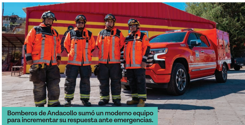
Bomberos de Andacollo sumó un moderno equipo para incrementar su respuesta ante emergencias.

En la ceremonia de recepción y bendición destacó la presencia del presidente nacional de bomberos, Juan Carlos Field.