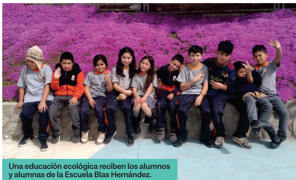
Una educación ecológica reciben los alumnos y alumnas de la Escuela Blas Hernández.

La docente, nacida y criada en Andacollo, señala que la escuela recibe a estudiantes provenientes de familias en que sus padres se desempeñan en empleos de la minería, ganadería y crianceros, y su sello está orientado a promover personas con conciencia ecológica, mediante una educación que incentive el cuidado del entorno.