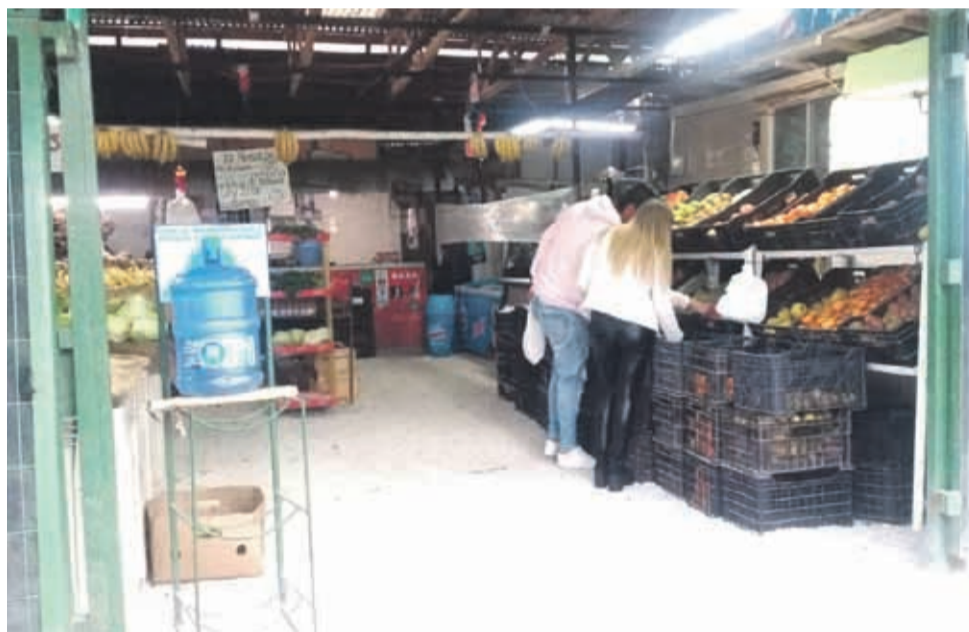
Los almacenes y verdulerías de barrio creen que esta crisis la van a pasar ya que la gente está temiendo ir a los grandes comercios para evitar las aglomeraciones.

Estos pequeños negocios han aprendido a acomodarse a las restricciones e incluso han agregado productos que son los más necesarios e incluso han innovado con otros como mascarillas, guantes y alcohol gel.