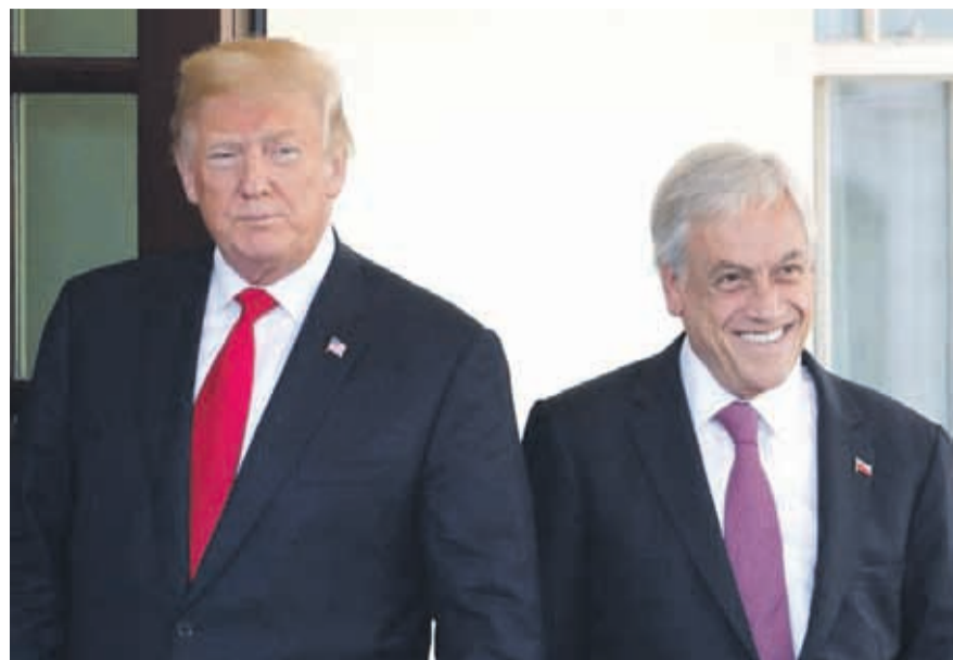
En la llamada Trump agradeció a Piñera el “apoyo inquebrantable a la democracia y libertad en la región”.

La oficina de Trump no detalló qué tipo de asistencia propuso, pero, en las últimas semanas, el mandatario ha ofrecido ayuda médica o respiradores a