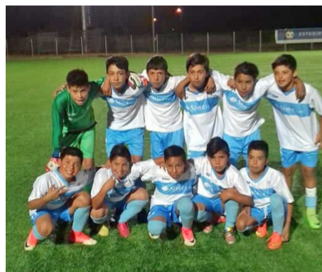
Los niños tienen un lugar de privilegio en el club deportivo Católica.

Junto con fundar un club y tener una sede, el objetivo principal de los socios era la cancha de fútbol. Demoraron 10 años en conseguir el título de dominio, logro que se consiguió el 23 de febrero del 2009. Pero fueron años de sacrificios, considerando que la cancha se creó en un terreno agreste y de malas condiciones. Pero los socios con palas y picotas trabajaron para emparejar el terreno y convertirla en la cancha de la Católica, donde los niños y niñas comienzan a forjar sus sueños.