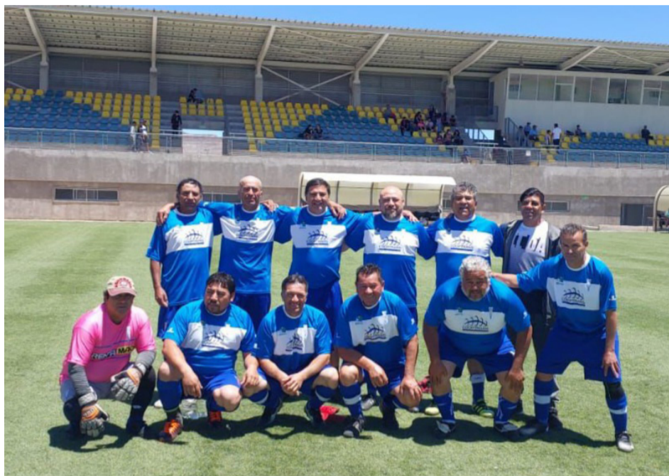
Los senior del club se han ganado la admiración por sus esfuerzos.

Con el correr del tiempo el Club Deportivo Católica conformó las series de fútbol infantil, juvenil, primera adultos, segunda, sub 35 y sub 45. Pero no se quedaron ahí, puesto que también formaron una rama femenina y como había socios que no le pegaban ni dentro de una caja de zapatos, se creó la rama de dominó y rayuela. También formaron los equipos de baby fútbol masculino