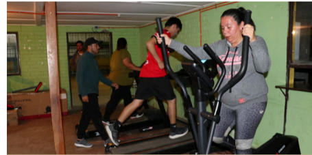
Más de cien personas han sido evaluada en el gimnasio del club Churrumata.

En las dependencias de la institución se instalaron maquinarias, además de contar con el acompañamiento de una nutricionista y un preparador físico.