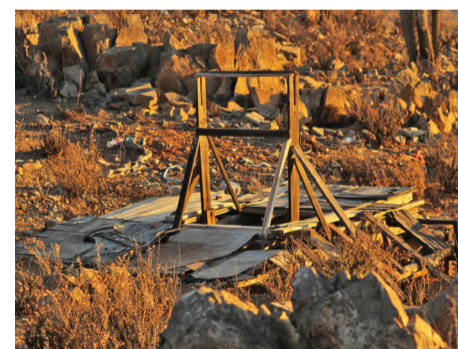
La actividad tradicional también tiene su lugar en el archivo de la fotógrafa.

INFÓRMATE DE LOS PROCESOS DE TRONADURA WWW.TECK.COM, MUNICIPALIDAD DE ANDACOLLO Y MEDIOS DE COMUNICACIÓN DE LA COMUNA.