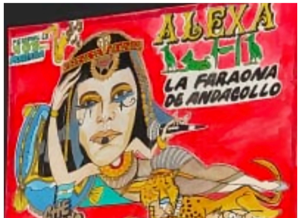
Alexa también se ganó un hermoso trabajo.