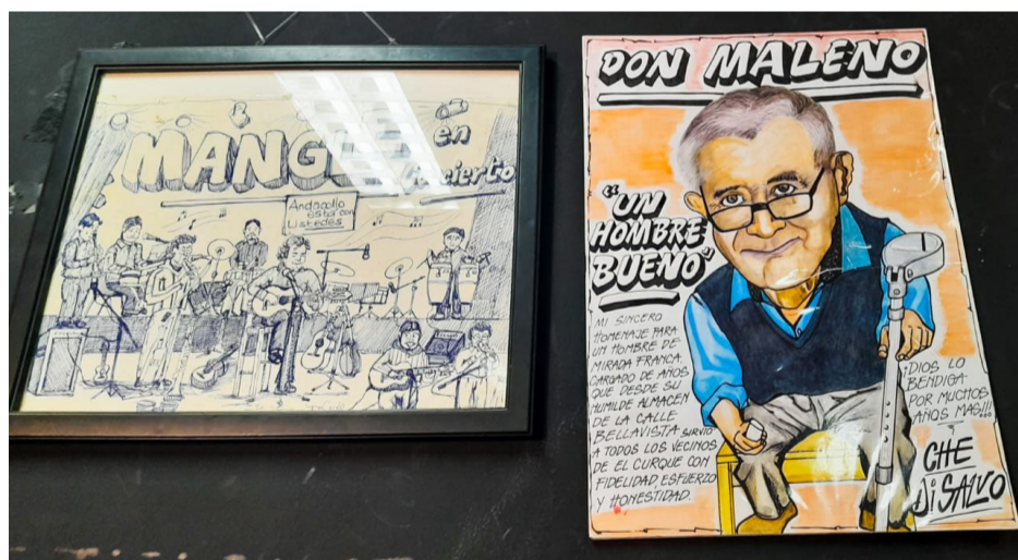
Buenos personajes fueron destacados por Di Salvo.