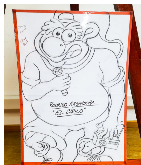
Rodrigo Argandoña dibujado por Luis Santander.