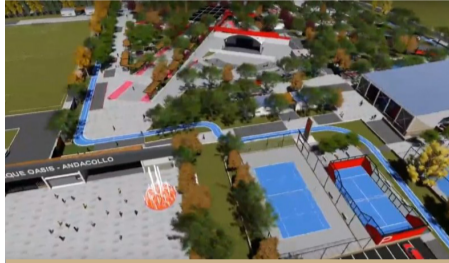
Así quedará el Parque Oasis después de la remodelación.

Es resultado del trabajo conjunto entre Gobierno Regional y la autoridad local.