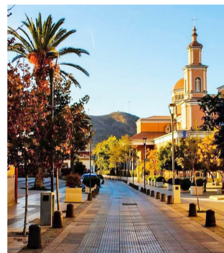
Calle Urmeneta.