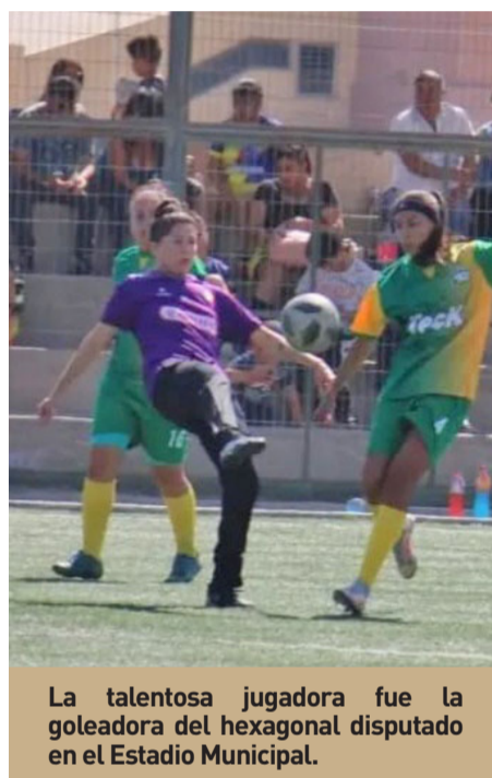
La talentosa jugadora fue la goleadora del hexagonal disputado en el Estadio Municipal.

El talento la llevó a integrar las cadetes de Coquimbo Unido, pero no continuó por darle prioridad a los estudios. Está en la etapa que hay que comenzar a definir sus prioridades, pues sus sueños son llegar a la universidad y "para eso debo subir el promedio de notas, que ahora es un 5.7. Además, prepararme para la PAES (Prueba de Acceso a la Educación Superior) pues mi objetivo es ser profesora de Educación Física, profesión ligada al deporte".