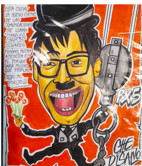
Las caricaturas se ganaron los aplausos.