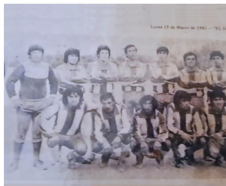
El gran equipo del primera adulto, que disputó la Copa de Campeones la temporada 1982.