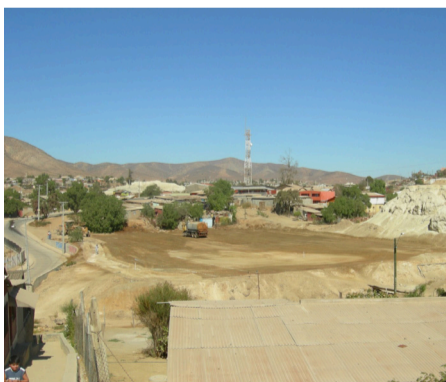
Los socios del club hicieron su cancha con palas y picotas. Fueron años de sacrificios.