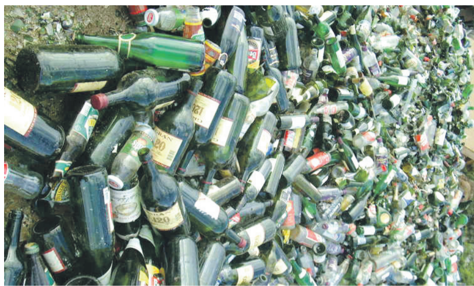
Seis puntos limpios tiene la comuna de Coquimbo para gestionar los residuos reciclados en los puntos verdes.

La pandemia obligó a cerrar varios puntos verdes y centros de acopio en la conurbación. En Coquimbo continúa el reciclaje de vidrio, mientras que en La Serena se han buscado alternativas para no paralizar por completo la actividad, incentivando la cooperación entre distintos actores.