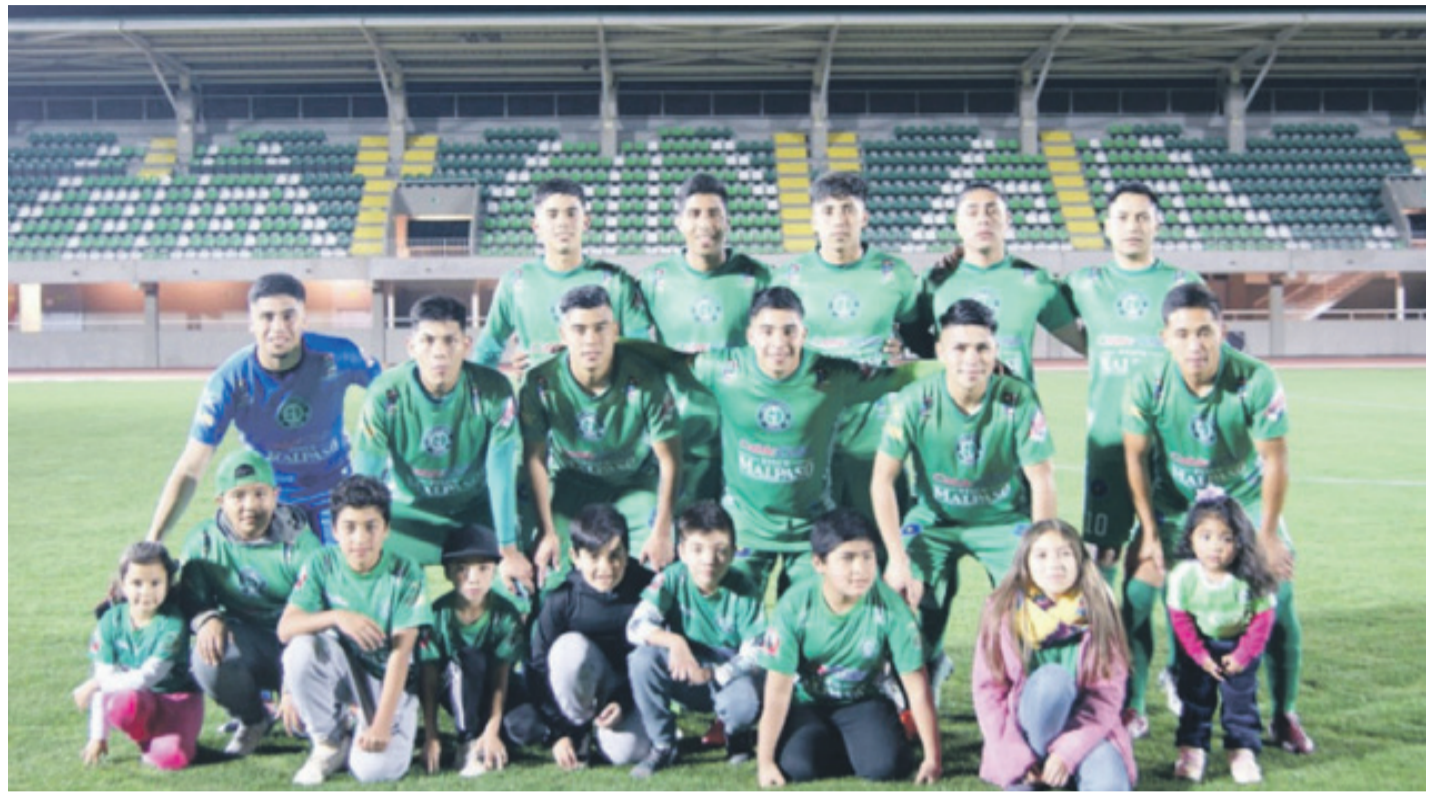
Varios futbolistas recibieron ayuda en alimentos de socios y colaboradores del club.

“En esa reunión, la mayor preocupación era saber la situación de los jugadores, algunos temas y casos eran difíciles ya coordinamos la manera de ayuda, hicimos campaña y colaboraciones de incluso algunos han manifestado que no continuarán en actividades para este 2020.