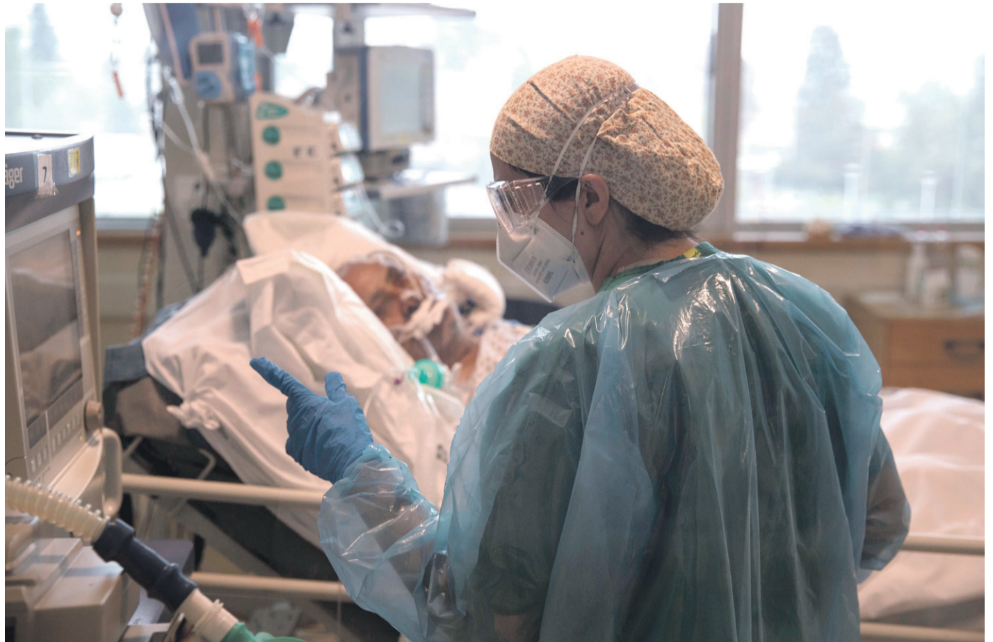
Reajuste de datos se da tras la entrega de cifras de fallecidos y contagios más altas desde el inicio de la pandemia

Respecto a los pacientes que se encuentran hospitalizados, el ministro de Salud dijo que hay 1.336 personas