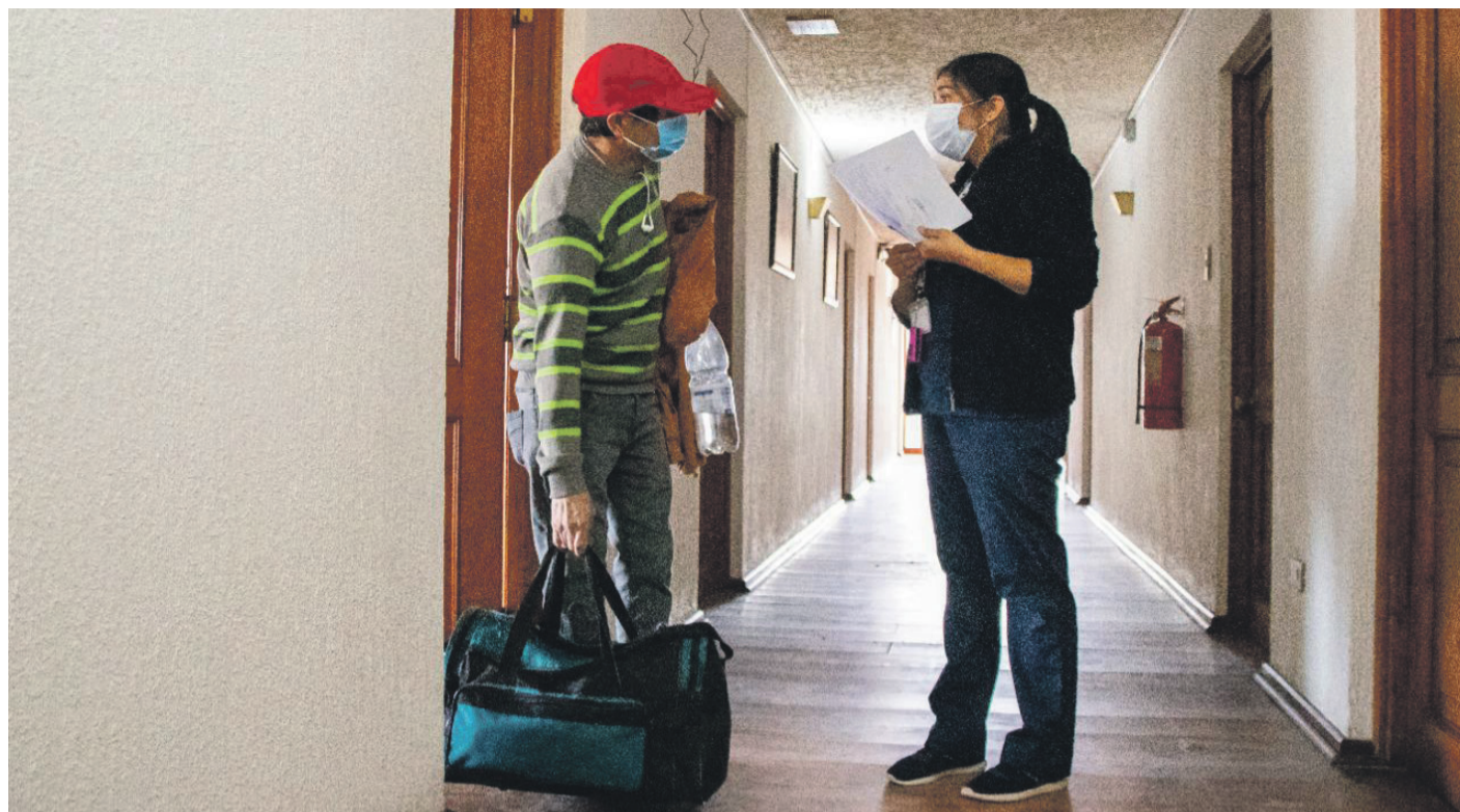
SERVICIO SALUD COQUIMBO

Añadió que “a los pacientes post hospitalizados también les hago un seguimiento más constante en vista que ya tuvieron una hospitalización previa con ventilación mecánica, todas eventualidades las tomo