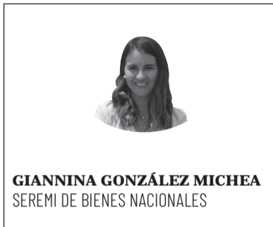
GIANNINA GONZÁLEZ MICHEA SEREMI DE BIENES NACIONALES

Los difíciles tiempos que estamos viviendo, han obligado a que todos modifiquemos la forma en que habitualmente hacemos las cosas. En ese sentido, el Ministerio de Bienes Nacionales, desde antes de la pandemia había comenzado una forma nueva de interactuar con la comunidad, le llamamos “Bienes a tu casa”. Esto significa que el Servicio se dirige al domicilio del beneficiario para hacer la entrega del título de dominio. Este mismo programa, lo hemos modificado tomando todas las medidas sanitarias y lo hemos incrementado, dirigiéndonos al domicilio de nuestros usuarios a entregarle las buenas noticias, así hemos logrado ver rostros inolvidables, compartir anhelos y sueños de un futuro mejor, familias agradecidas y esperanzadas. Hoy con mayor fuerza que antes tenemos que seguir trabajando con la certeza de que detrás de cada expediente en tramitación existe la esperanza de una familia cuyos sueños dependen de ese título de dominio.