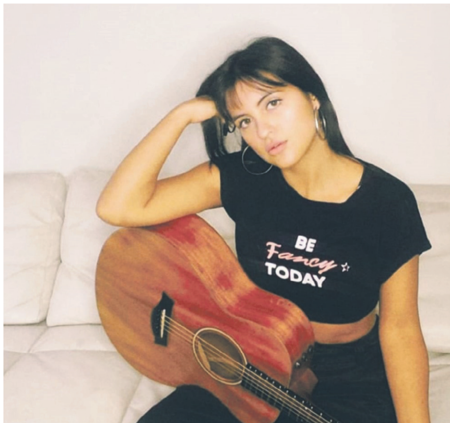
Tras un verano intenso, con shows en varias ciudades de Chile, la joven serenense tuvo que hacer una pausa en su agenda debido a la rápida programación del coronavirus.

En el plano personal, reconoce estar muy tranquila y más cerca que nunca de su familia. “Ha sido un periodo de pausa, reflexión y regaloneo que en otras instancias