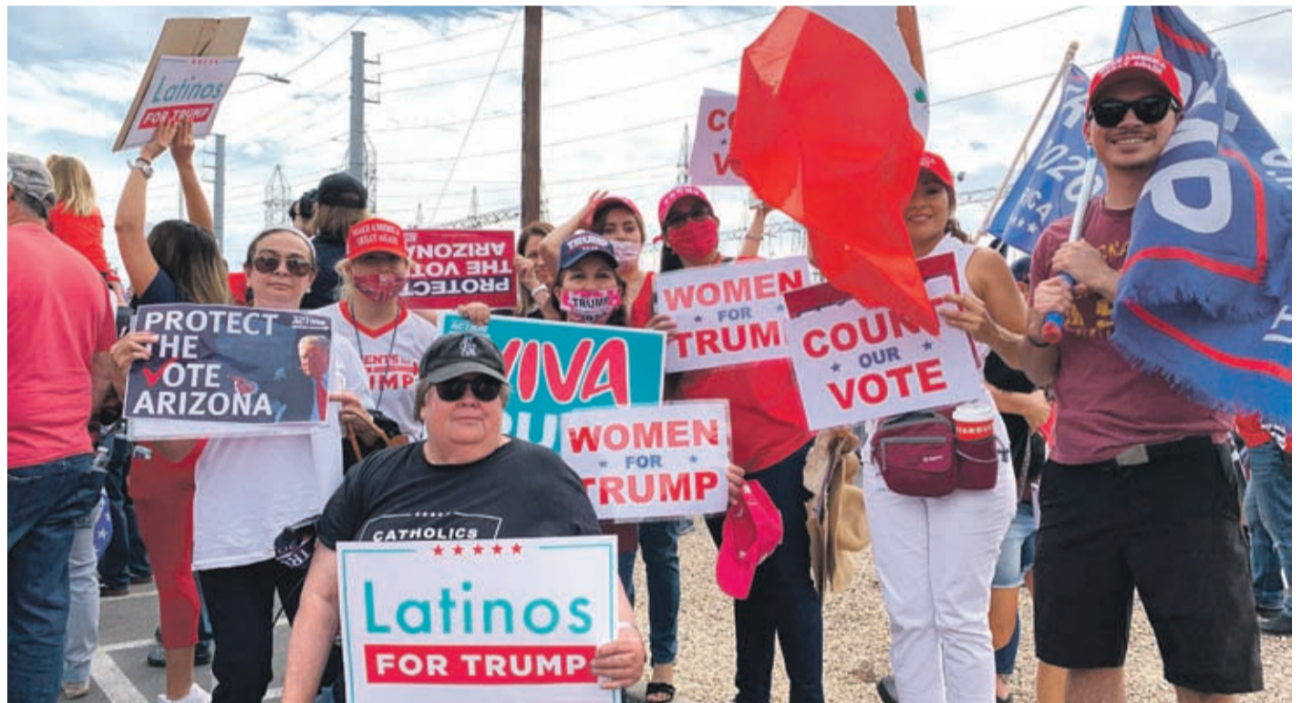
Seguidores del presidente Trump sostienen pancartas y banderas durante una protesta este viernes en Phoenix, Arizona. Protestan por lo que consideran un proceso "corrupto" que ha favorecido al candidato presidencial demócrata, Joe Biden.

El camino hacia la reelección del presidente estadounidense, Donald Trump, es cada vez más estrecho y pasa necesariamente por Pensilvania, sin cuyos 20 votos en el Colegio Electoral le será imposible lograr un segundo mandato en la Casa Blanca.