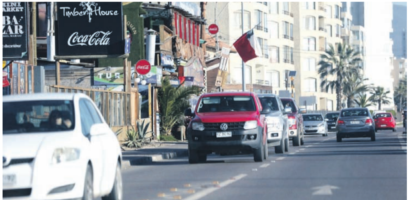
El plan fue presentado ante los gremios locales y autoridades del Gobierno Regional para su socialización, comentarios y, por sobre todo, para generar un trabajo unido.

La iniciativa comenzará a ejecutarse este mes con promoción a través de redes sociales, medios de comunicación y aeropuertos, entre otros, para mostrar que la región de Coquimbo se preparó en la aplicación de los protocolos Covid-19. De hecho, la CRDP y Sernatur capacitaban a empresas y trabajadores en esos protocolos, se hicieron visitas inspectivas a los establecimientos, junto a INACAP se creó un sistema de cartas con códigos QR para restaurantes, un grupo de guías de turismo ingresó al registro nacional de calidad gracias a cursos dictados junto a la Cruz Roja