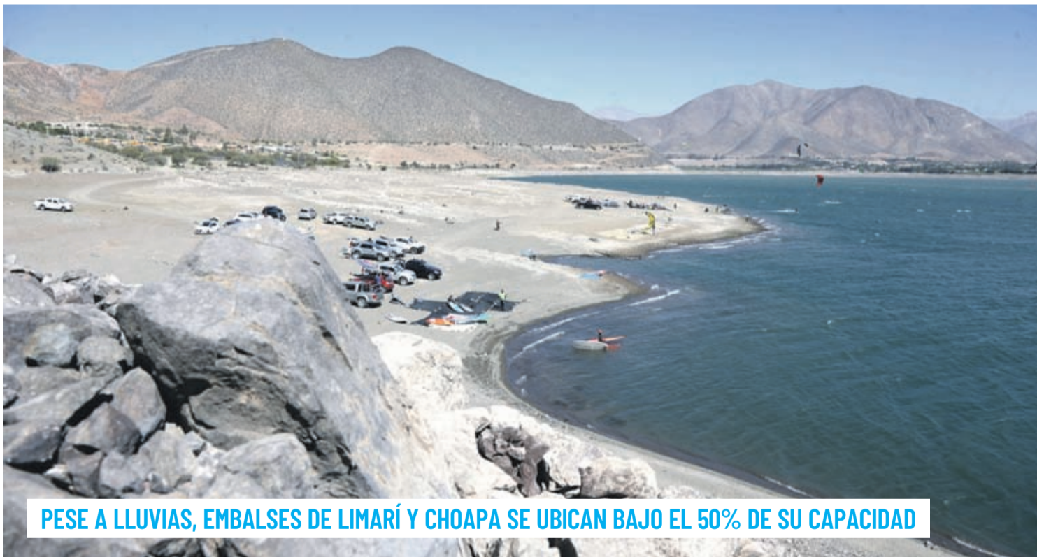
PESE A LLUVIAS, EMBALSES DE LIMARÍ Y CHOAPA SE UBICAN BAJO EL 50% DE SU CAPACIDAD

Luego de que el Gobierno anunciara que presentará un plan para reabrir las fronteras de Chile, las autoridades locales comenzaron a trabajar en dicho proceso. Si bien desde la Gobernación de Elqui indicaron que aún no manejan una fecha clara de reactivación, aseguran que el paso limítrofe cuenta con todas las condiciones en materia sanitaria para recibir a turistas. 6