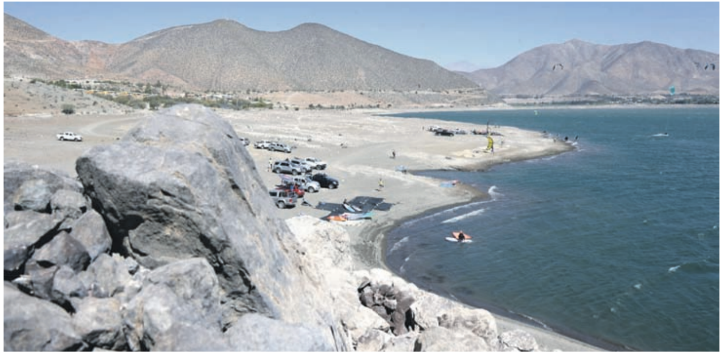
Pese al déficit presente en los embalses de la región, el agua para riego y abastecimiento humano está asegurada.