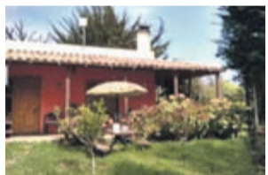
La Serena Terreno sup. 8,5 hect. Cuenta con 6.27 acciones de agua

inscritas, arroyuelo presente en la propiedad 22 UF F: contacto@mgestion.cl