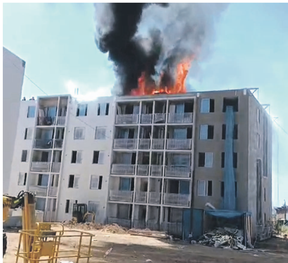
Pasadas las 15 horas, un incendio se declaró en un edificio en construcción en Coquimbo.

Finalmente, Ecomac reiteró su compromiso con la seguridad. “Continuaremos con nuestra permanente política de máxima seguridad en nuestras obras para cautelar la integridad de nuestros equipos”, se concluyó en el comunicado.