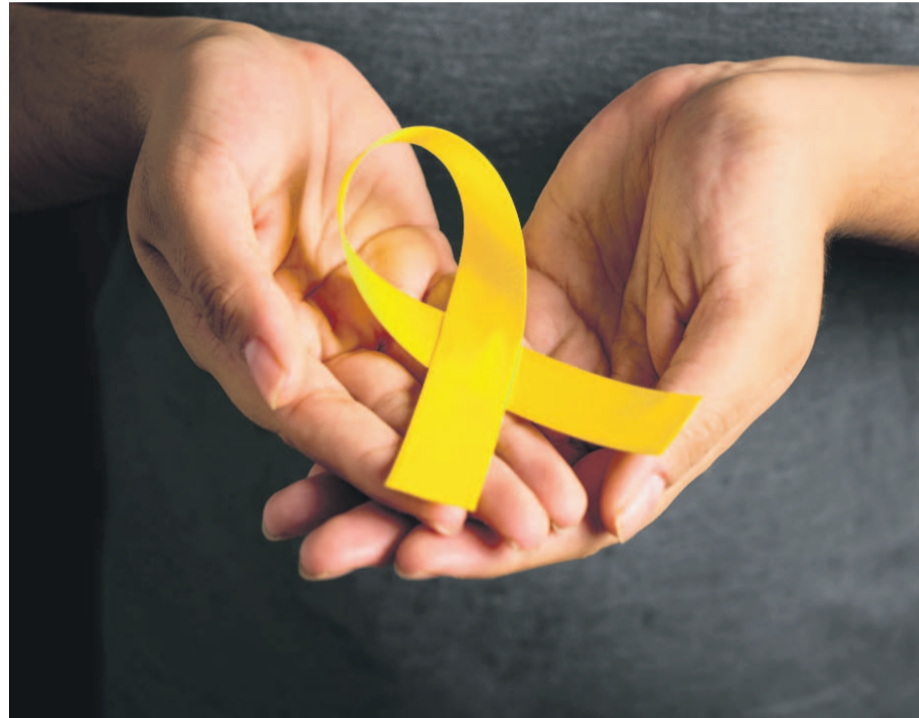
La actividad se enmarcó en la necesidad de crear redes de apoyo para evitar la ocurrencia de suicidios.

La capacitación tuvo por objetivo que los asistentes, adquirieran herramientas prácticas para reconocer las señales de alerta y proporcionar una respuesta adecuada en situaciones de riesgo. A través de diversas charlas y ejercicios, se abordaron temas cómo los factores