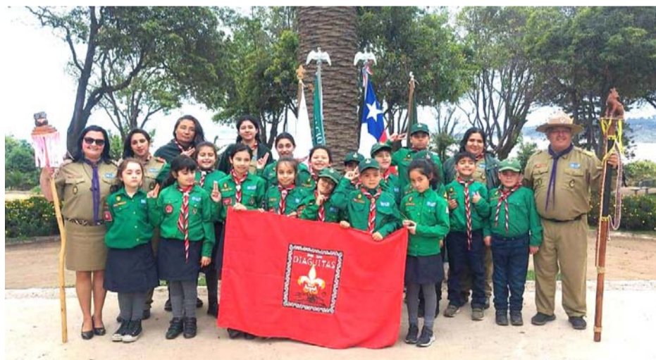
23 niños y niñas forman el Grupo Scout “Diaguitas” de La Serena.