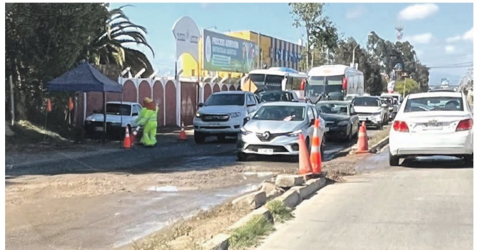
Las externalidades que gatillaron la detención de obras fue el levantamiento de polvo de los camiones que transitan al botadero, así como también la afectación en avenida Ulrikson.

"En base a eso, los inspectores fueron a verificar el cumplimiento de las medidas de mitigación y según