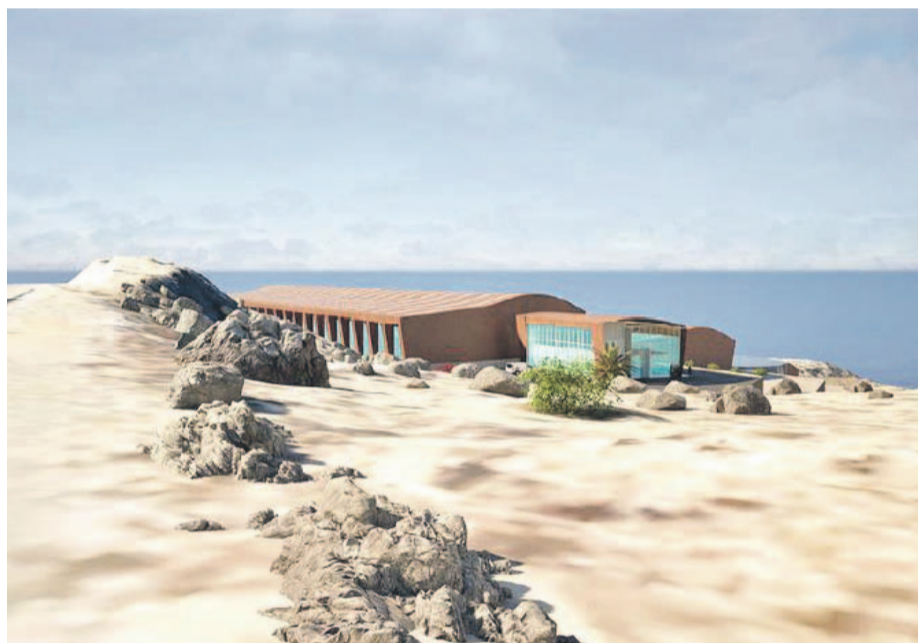
La planta se ubicaría a 20 kilómetros al norte de La Serena y tendrá una capacidad de 2 mil litros por segundo.

Desde el consorcio Aqua Terra, quienes están a cargo del desarrollo de la iniciativa que busca extraer agua de mar en un sector ubicado a 20 kilómetros de la capital regional, señalaron que esperan ingresar el estudio de impacto ambiental durante el próximo año, proyectándose su puesta en marcha a principios de 2030.