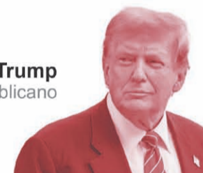
Donald Trump Partido Republicano