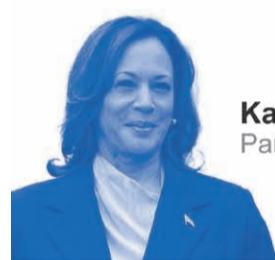
Kamala Harris Partido Demócrata