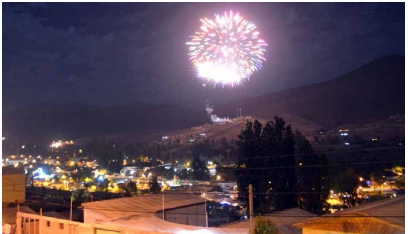
Finalmente, no habrá fuegos artificiales en Illapel para recibir el año 2024.