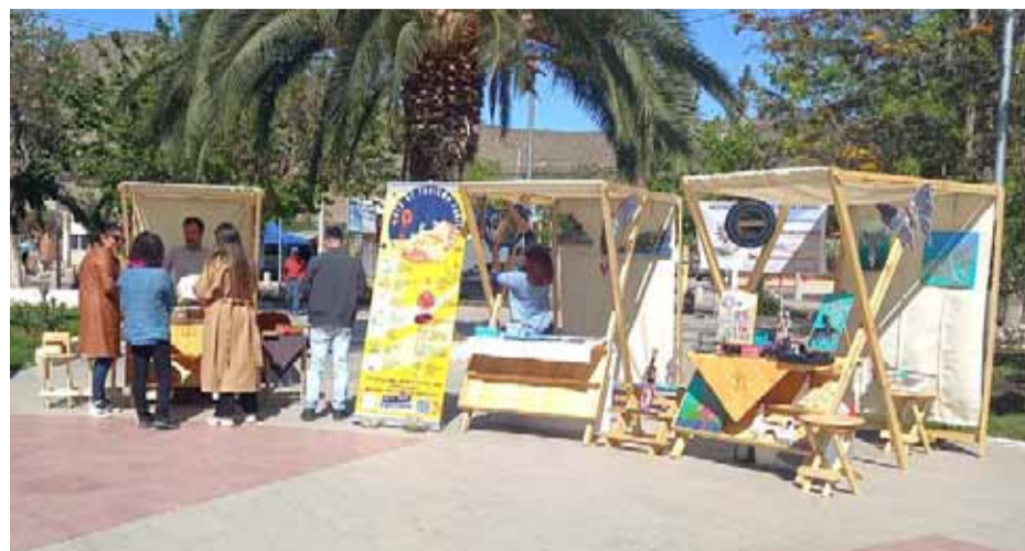
Emprendedores de la provincia darán a conocer al público todas sus creaciones.

En este contexto, durante este jueves 7 de diciembre se desarrollará el lanzamiento del calendario de verano para la Provincia del Limarí, con la instalación de stands con productores y emprendedores de Ovalle, Monte Patria, Combarbalá, Punitaqui y Río Hurtado.