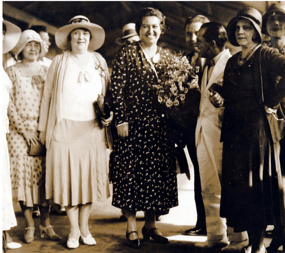
La destacada Premio Nobel falleció en el año 1957 en Estados Unidos.

“La provincia de Elqui tiene el privilegio de que ella haya estado los primeros 21 años de su vida en este