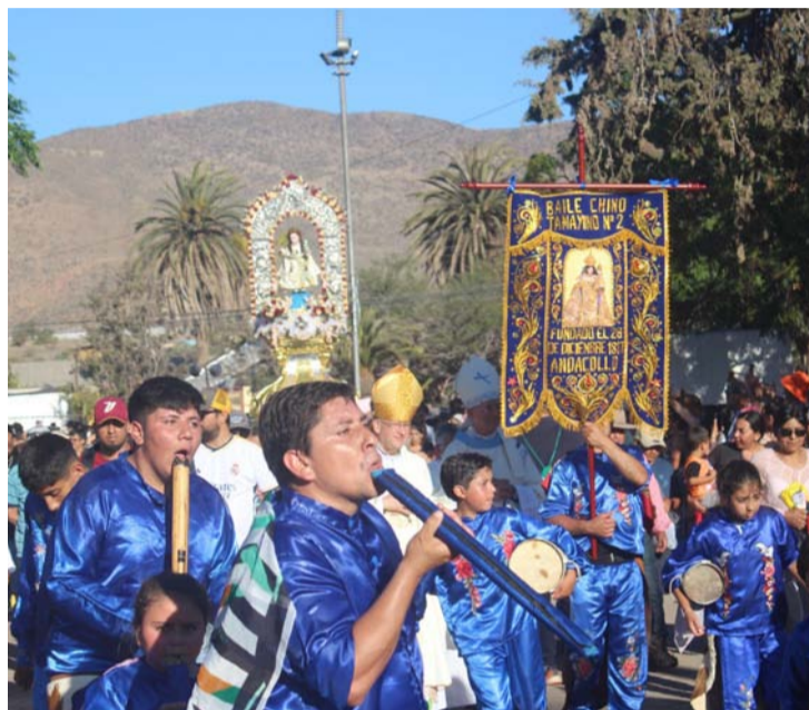
Este domingo se realizó la procesión en Sotaquí, y los peregrinos y bailes religiosos se mostraron molestos por el comercio informal.

"Fue una fiesta un poquito triste, porque eran los 150 años del Niño Dios,