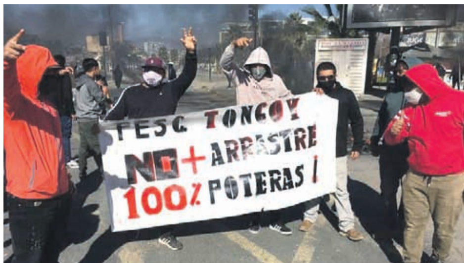
Los pescadores artesanales de la región se sumaron a la protesta nacional por la apelación al Tribunal Constitucional que busca abolir la llamada “Ley de la Jibia”.

Sobre las movilizaciones en medio de la contingencia sanitaria, llamó a los pescadores de todo el país para seguir dialogando como en las últimas semanas y “con resultados tangibles”.