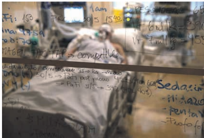
La capital es el principal foco de la pandemia, donde la red hospitalaria está al límite.

El total de fallecidos por Covid-19 llega a los 2.264, de acuerdo a lo mencionado en el último reporte de la autoridad desde La Moneda.