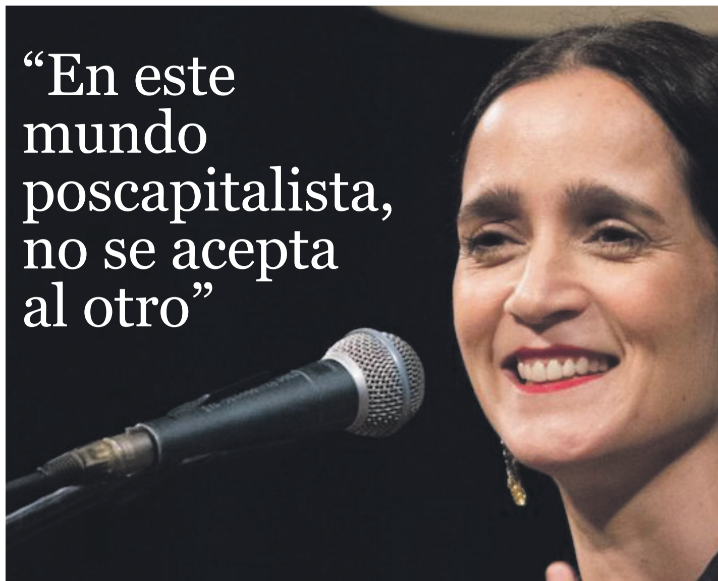
La cantante Julieta Venegas vuelve a los escenarios y pone el foco de sus canciones en temáticas sociales.