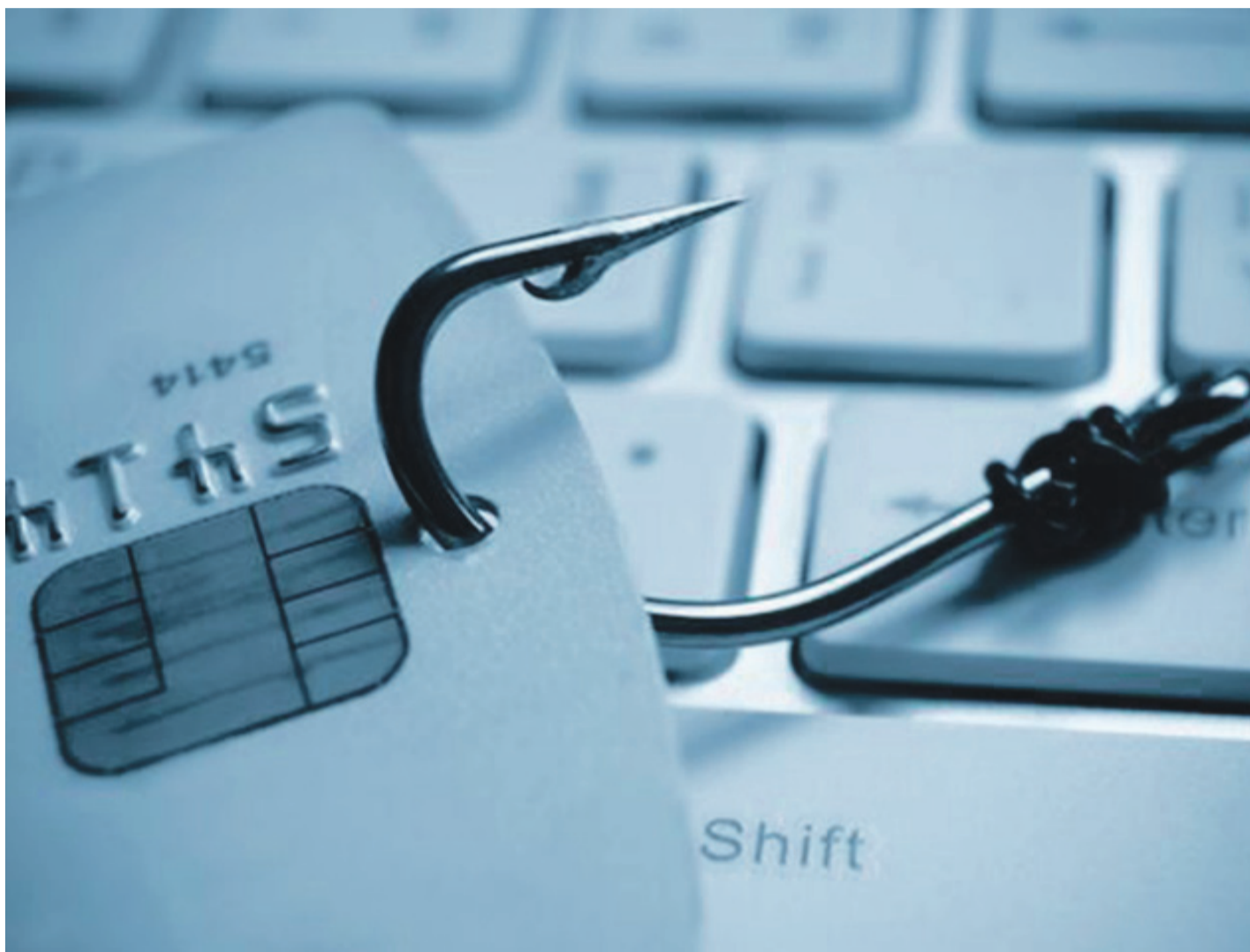
Según la misma encuesta, los países menos afectados por esta práctica fueron Costa Rica y Paraguay.