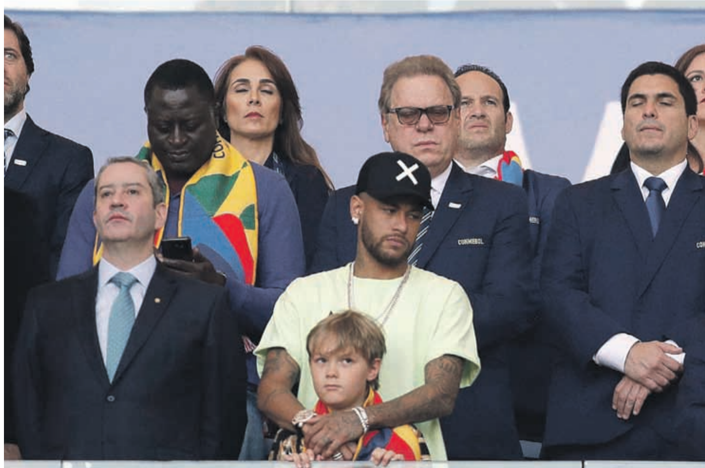
Neymar vio desde las tribunas el triunfo de sus compañeros. No han sido buenos tiempos para el talentoso atacante.

Tras esto, los dueños de casa manejaron por largos pasajes el trámite, lo cual se transformó en aproximaciones, que principalmente Roberto Firmino no pudo materializar en la segunda cifra para los dirigidos por Tite.