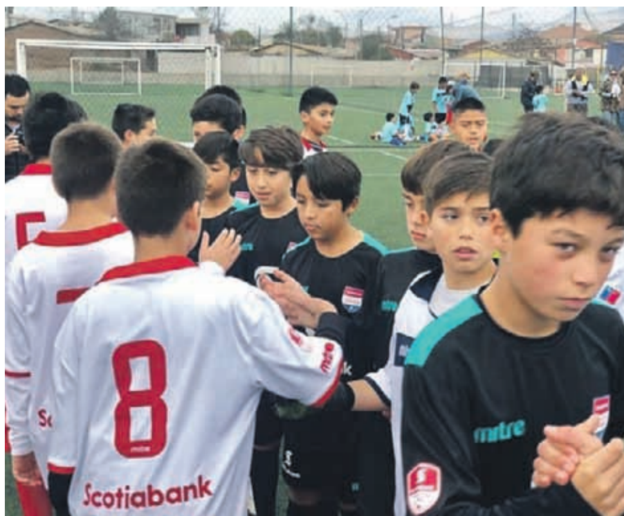
El fair play destacó entre los participantes de este torneo.