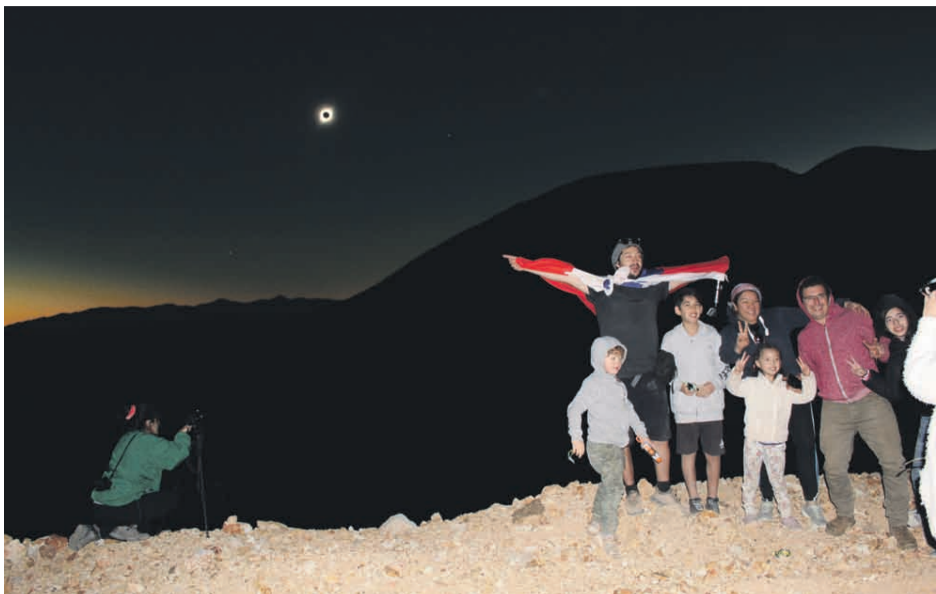
Una de las familias que llegó a Condoriaco se toma una fotografía con el eclipse total de sol a sus espaldas, un recuerdo que nunca olvidarán.

En la actualidad, una decena de personas