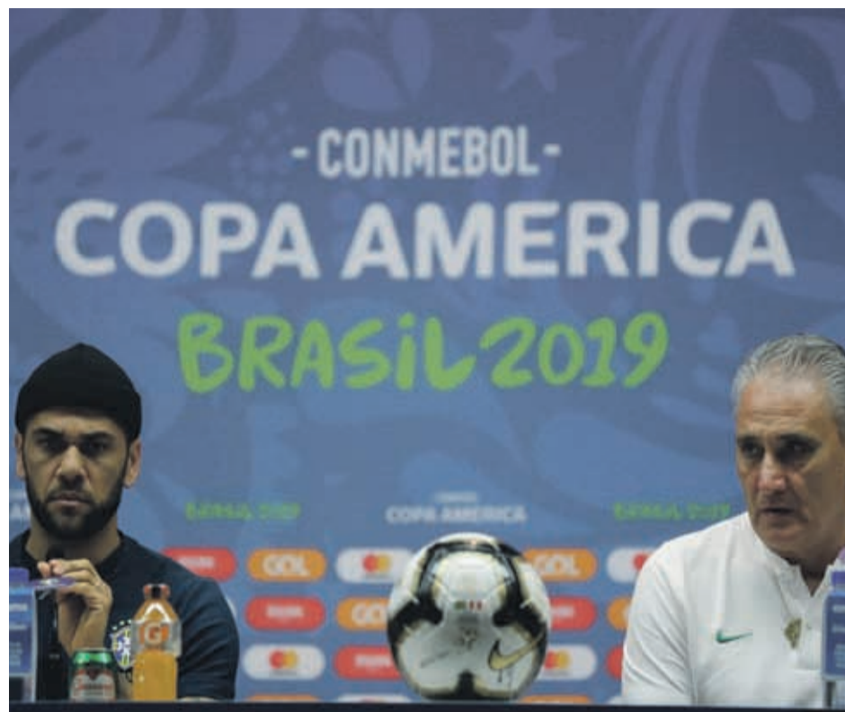
Dani Alves y Tite conversaron con los medios tras la obtención de un nuevo título para Brasil.