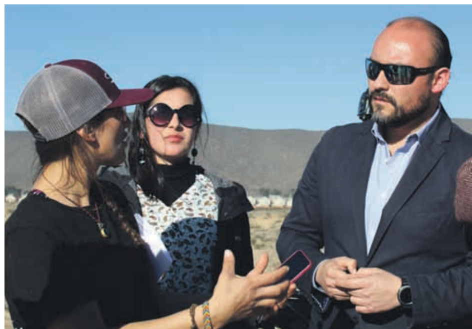
El alcalde de Coquimbo, Marcelo Pereira, siempre les ha dado su respaldo.