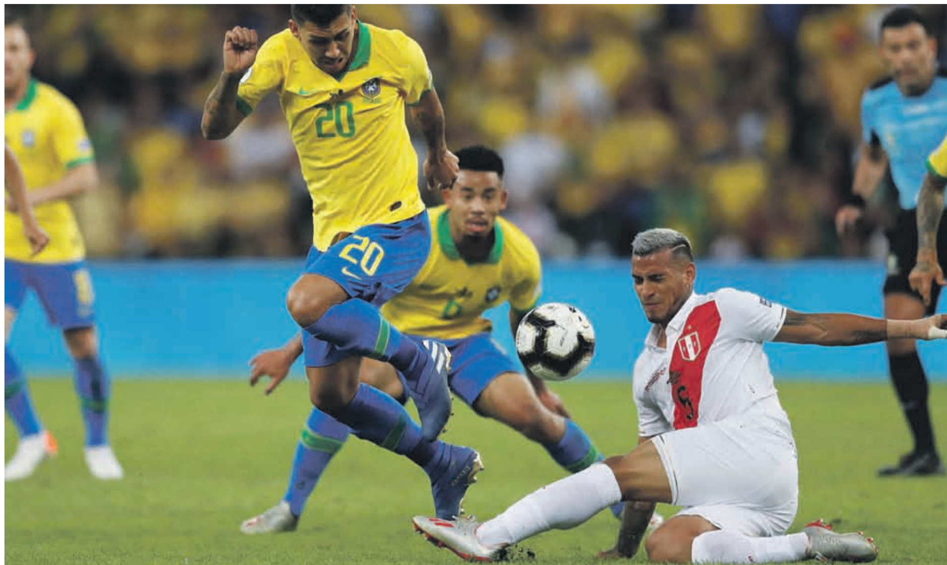
El trámite del compromiso fue áspero, pero los locales fueron muy certeros y obligaron a Perú a salir a buscar el partido.