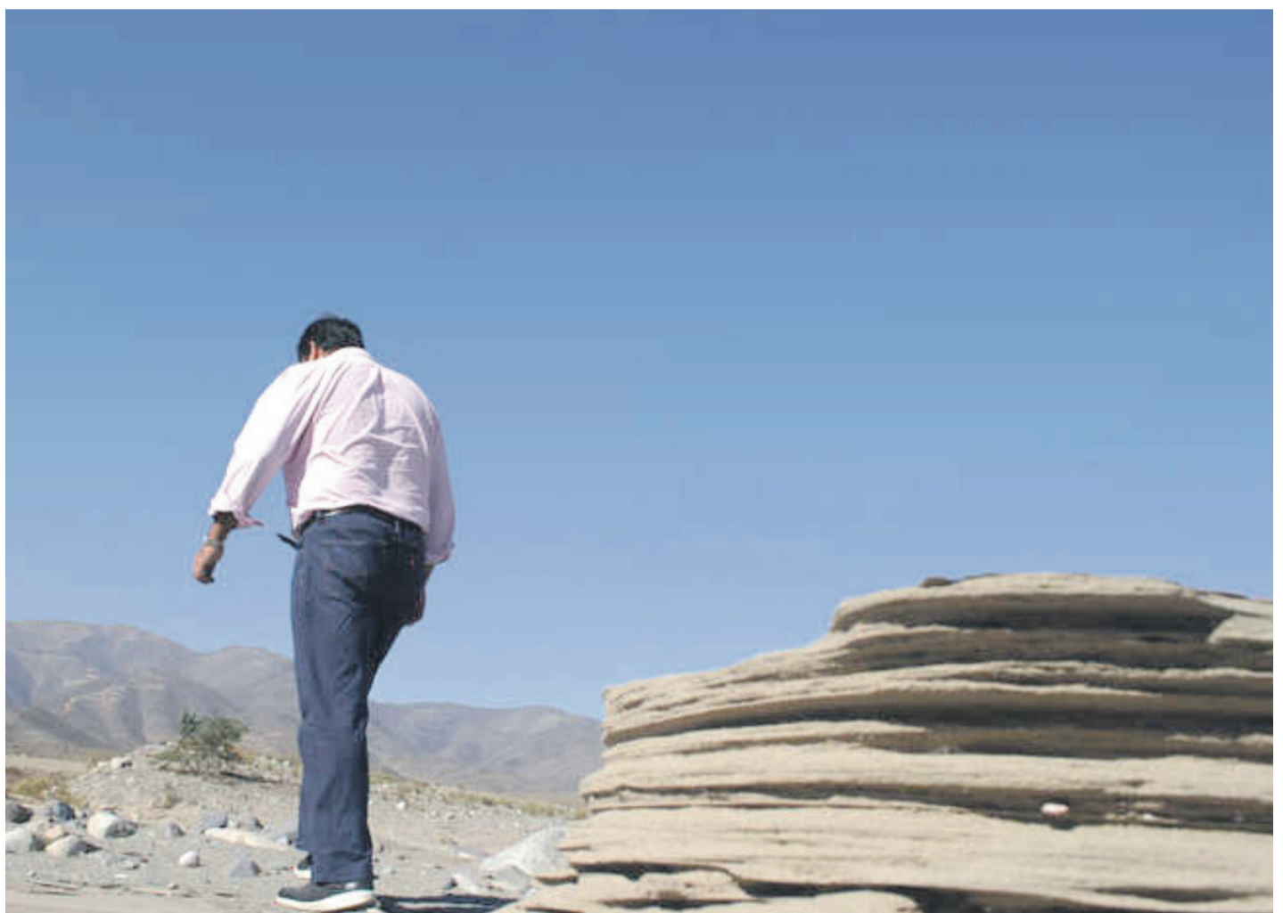
Las escasas precipitaciones que se han registrado en la región mantienen preocupado al sector agrícola.

La realidad que vive la Región de Coquimbo se condice con la del país completo. Según una encuesta realizada por la Sociedad Nacional de Agricultura, SNA, en su semi-