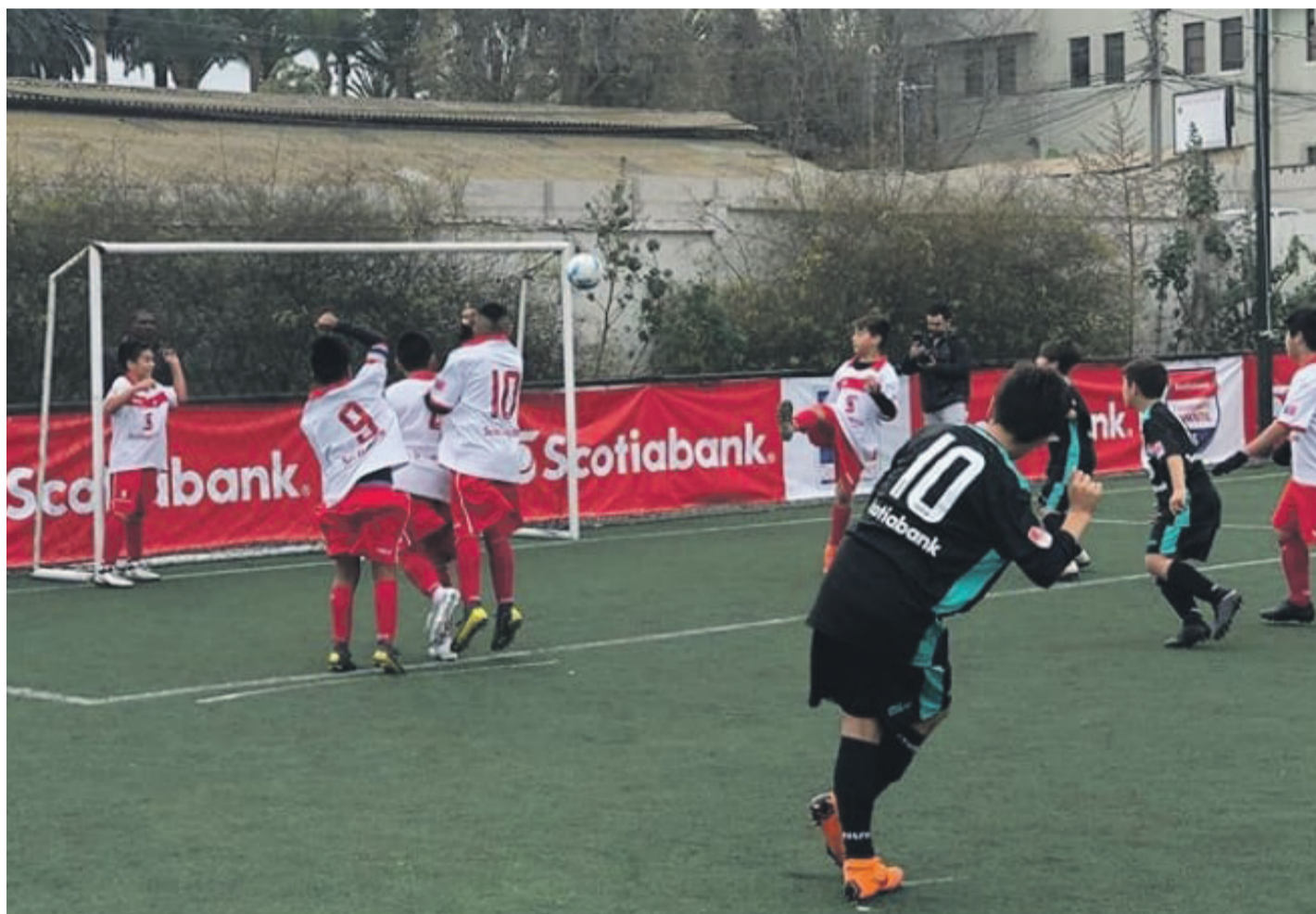
Las buenas jugadas fueron la tendencia. El torneo se desarrolló principalmente en el Complejo Pingüino.