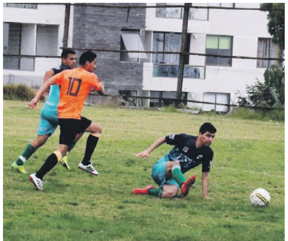
Los representantes de la UST en todo momento demostraron su hegemonía.

En la semana se cierra la competencia de fútbol, el que se disputa en la cancha de pasto sintético de la Universidad Católica del Norte de Coquimbo. El miércoles 10 se jugarán las finales de varones. 38071