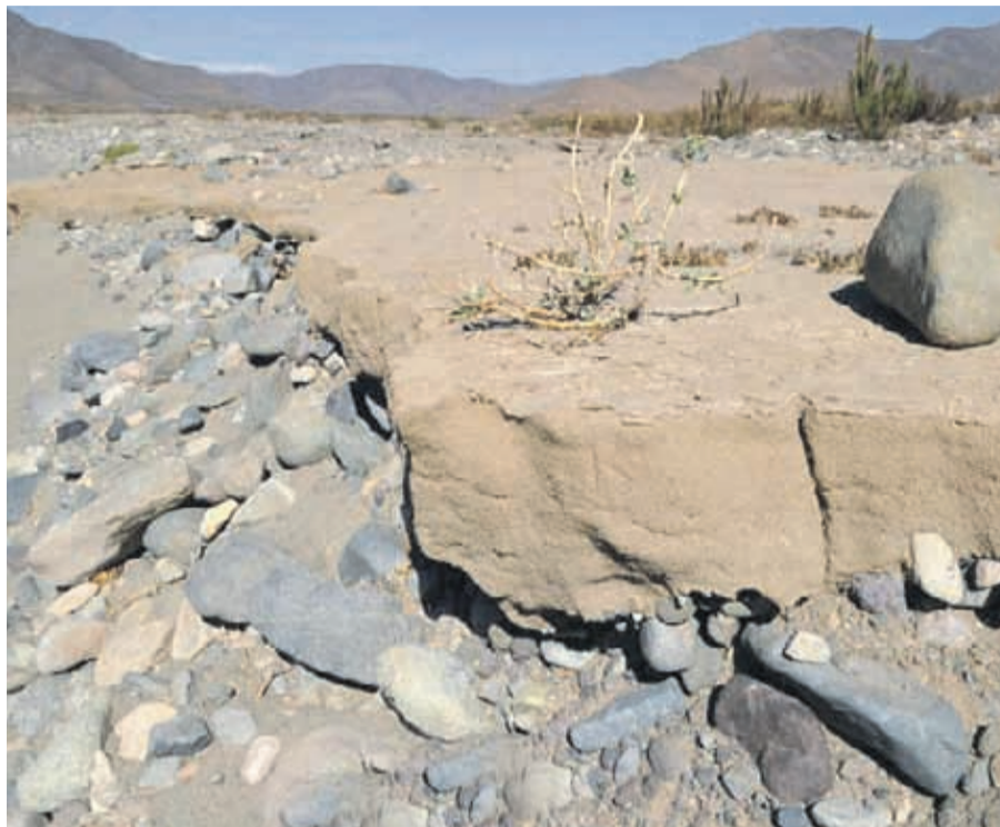
El nivel de embalses de la Región de Coquimbo alcanza un 64% del total.

Sin embargo, Figari puso el foco en otro problema: el cambio climático. "Lamentablemente, con la evaporación, debido a las altas temperaturas, se genera una complicación. De hecho, el punto de tope en la agricultura va por el lado del