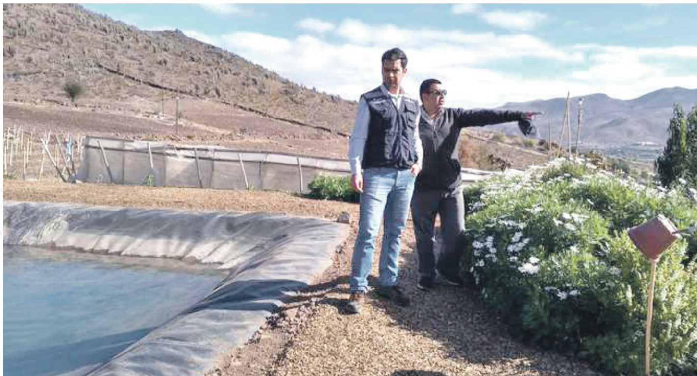
El Programa de Pequeña Agricultura incorpora a comunidades y regantes de localidades rurales que anteriormente no podían acceder a los recursos de la Ley de Riego.