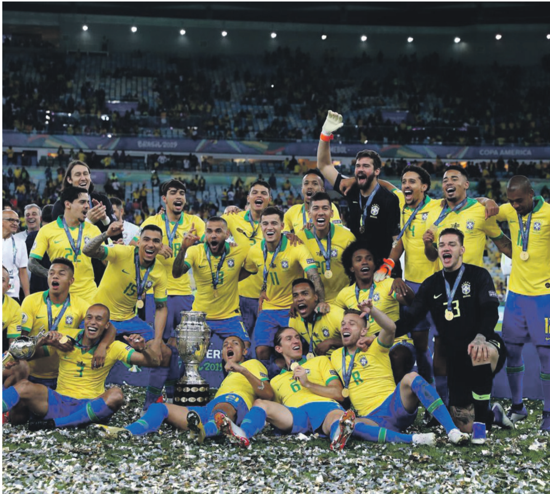
Los campeones festejaron en una de las catedrales del fútbol: el estadio Maracanã.