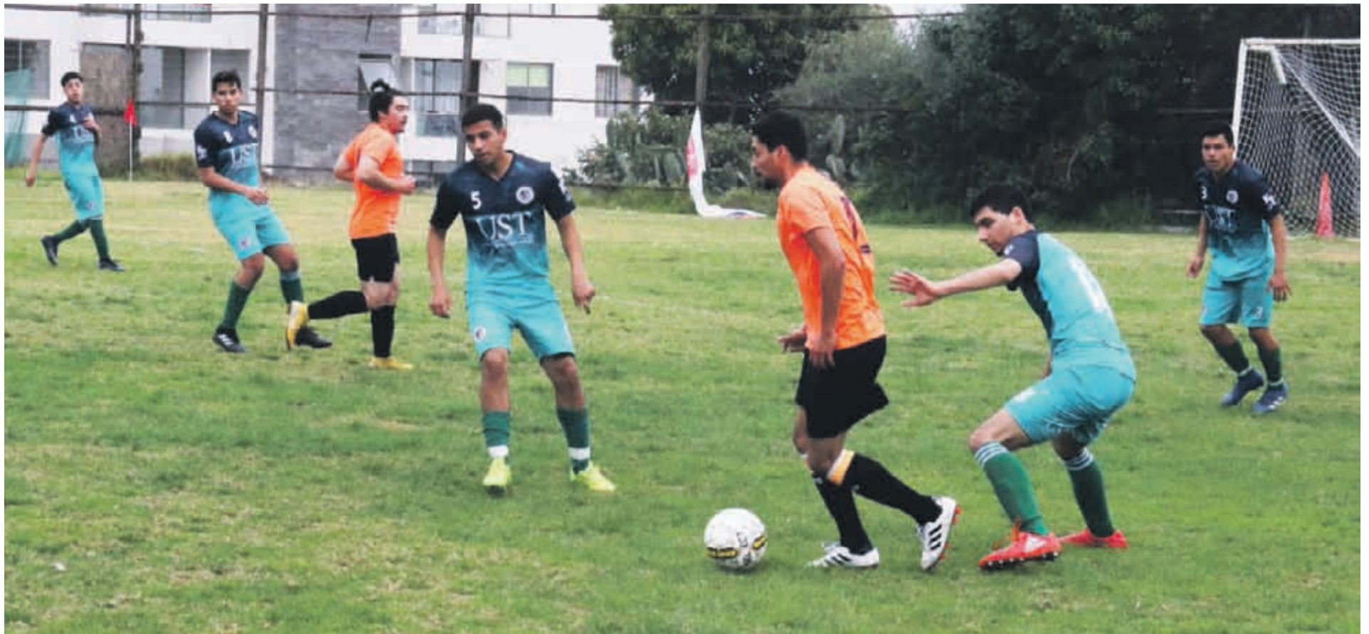
El encuentro entre la Universidad Central y la Universidad Santo Tomás fue de alto vuelo, más allá del amplio marcador.