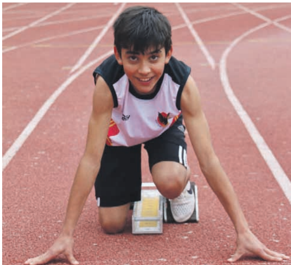
El joven deportista, además, es aficionado a la música.

Cabe destacar que el sábado ganó los 150 metros planos y finalmente clasificó al Regional, lo que tiene lleno de orgullo a su familia. Una satisfacción que es el fruto del respaldo a