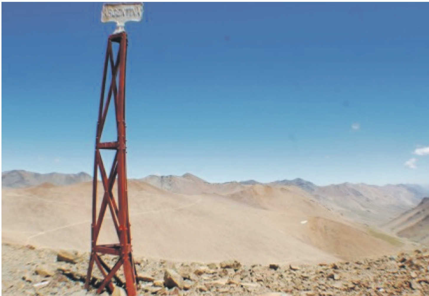
En la imagen, el hito que se ubica en el Paso Internacional.

La historia del mencionado paso tiene diversas aristas, las cuales lamentablemente, de acuerdo al punto de vista de investigadores, han quedado poco a poco olvidadas.