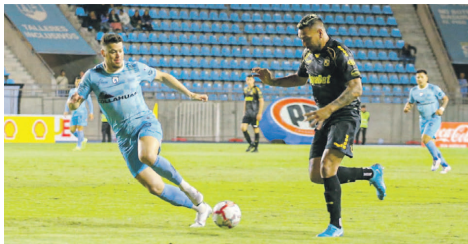
Coquimbo Unido saldrá hoy a la cancha a enfrentar a los iquiqueños muy motivados gracias a su triunfo por 1-2 en la ida.

Esa victoria en la ida, no sólo permitió que el equipo de Díaz volviera a los abrazos, sino que comenzara a afianzar una nueva estructura en el equipo pirata —ya iniciada en la caída por 1-0 ante la U también en casa— cuyo objetivo es recuperar la consistencia defensiva que se había extraviado en las últimas jornadas, con un modelo más conservador al que no se le hace muy complicado recuperar el balón. Sin embargo, sí le hace muy complicado administrarla, como ocurrió precisamente en la primera etapa contra el equipo de