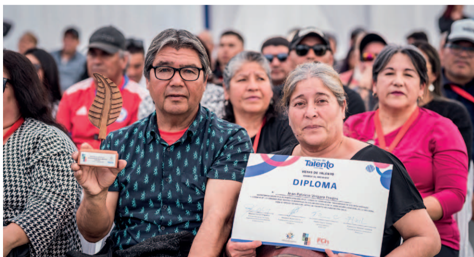
Grupo de beneficiarios durante la ceremonia que se desarrolló bajo el nombre “Juntos construimos un mejor futuro para nuestra región”.