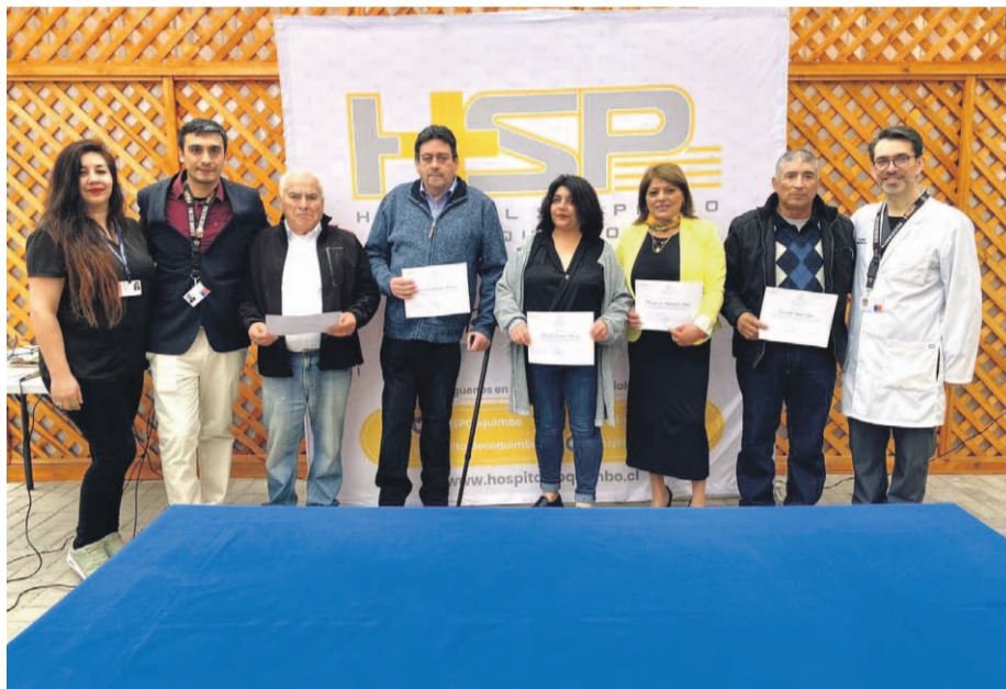
A la conmemoración del tercer aniversario de la Unidad de Medicina Hiperbárica asistieron autoridades, funcionarios y gran número de pacientes que han recibido tratamiento en ella.

Hoy, la Unidad de Medicina Hiperbárica del Hospital de Coquimbo celebró su tercer aniversario, destacando al recinto porteño como uno de los pocos centros de salud del país que cuenta con un equipo de esta envergadura para dar solución a la alta tasa de accidentes por descompresión que afectan a los buzos de la región, pero además, abriendo esta medicina a nuevos procedimientos. Por ejemplo, actualmente es posible aplicar oxigenoterapia para el tratamiento de intoxicaciones por monóxido de carbono y lesiones por radioterapia