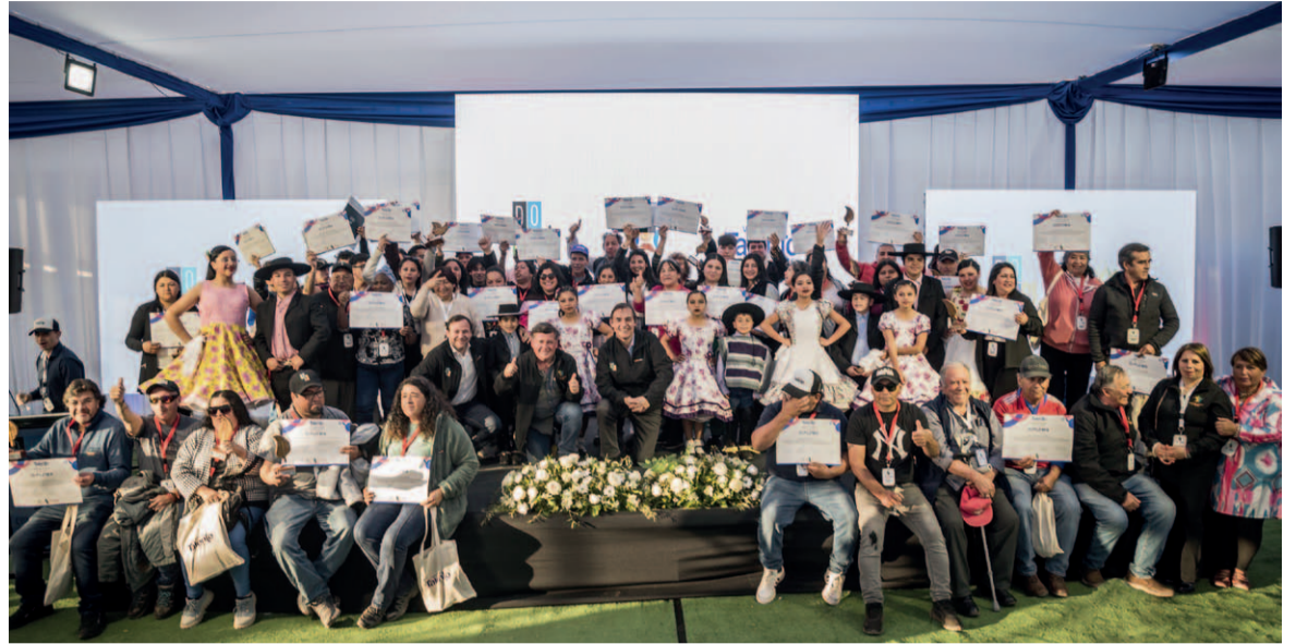
Grupos de beneficiarios del programa Crecer + de Vetas de Talento de Fundación Chile.

La iniciativa, impulsada por Dominga y la Asociación Comunal de La Higuera, forma parte de los compromisos del Acuerdo para el Desarrollo Humano, Productivo y Ambiental para la comuna, que formaliza la relación entre ambas partes, en beneficio del desarrollo sustentable de la región de Coquimbo.