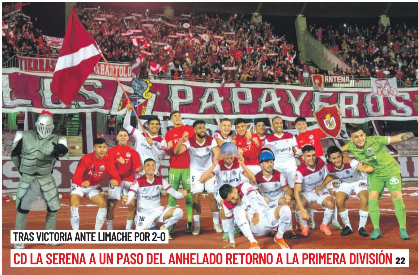
TRAS VICTORIA ANTE LIMACHE POR 2-0